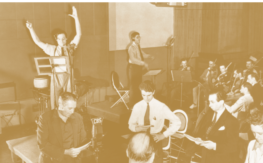
The War of the Worlds. Orson Welles, 1938

El radioart és una disciplina, dins del gènere de l'art sonor, amb què molts artistes han fet ús del mitjà, l'aparell i el mateix concepte radiofònic per a explorar possibilitats creatives de tota mena. Molts d'ells han fet ús d'aparells de ràdio en instal·lacions artístiques, o fent-los servir com a instruments de peces sonores. Però la ràdio, des del seu component socialitzador, ha estat també un format ideal per a convocar i donar veu (de la forma més directa que ens podem imaginar) a col·lectius de tota mena. Les accions sonores realitzades per artistes esdevenen experiències (i a vegades experiments) en què caben multitud de formes d'expressió: la narració, l'entrevista, la ficció (la radionovel·la), la poesia, experiments sonors, els documentals, etc. Si desitgeu ampliar més informació sobre aquests aspectes, vegeu l'annex "Art sonor i radioart".