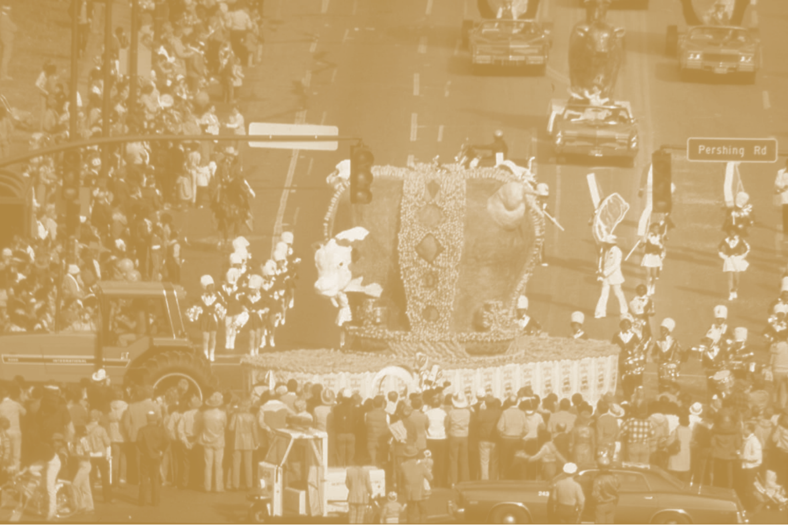
Wheat & Steak. Antoni Miralda, 1981.