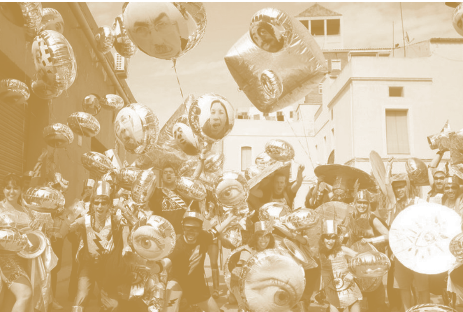
Reflectantes contra el mal. Colectivo Enmedio, 2013