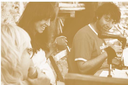
Emisiones Cacatúa. Teatron, 2012