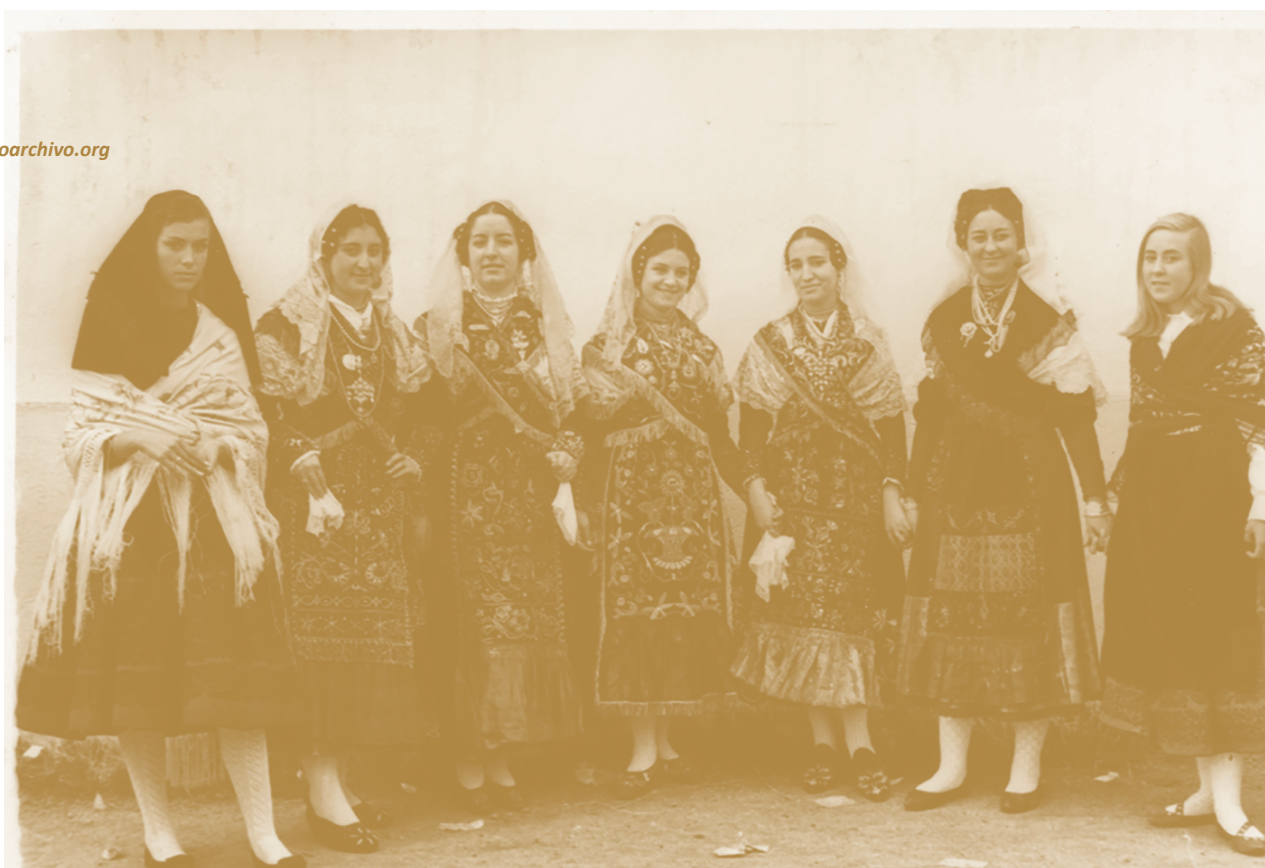
Autor: José Garzón Font: www.territorioarchivo.org

Per acabar, amb la JORNADA MEMORABLE volem generar un acte reivindicatiu i col·lectiu en el qual es visibilitzen possibles noves fites de la història del poble basades en aquelles experiències personals, però també socials i comunitàries, i donar valor així a les reflexions prèvies.