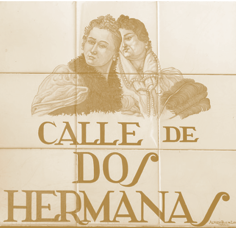
Placa d'un carrer de Madrid.

En la fase de recerca i creació de les històries, l'objectiu es acostar a l'alumnat les possibles fonts primàries per a conèixer un moment i interpretar-lo de forma crítica, en aquest cas volem donar valor a les històries quotidianes i possiblement properes en el temps enfront dels grans personatges de temps allunyats a la realitat actual de l'alumnat, volem generar la consciència que l'experiència viscuda és una font que cal tractar i donar valor a les fonts orals, als testimonis... per a conèixer i generar un procés de creació.