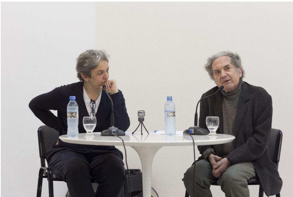
Dora García y Ricardo Piglia.