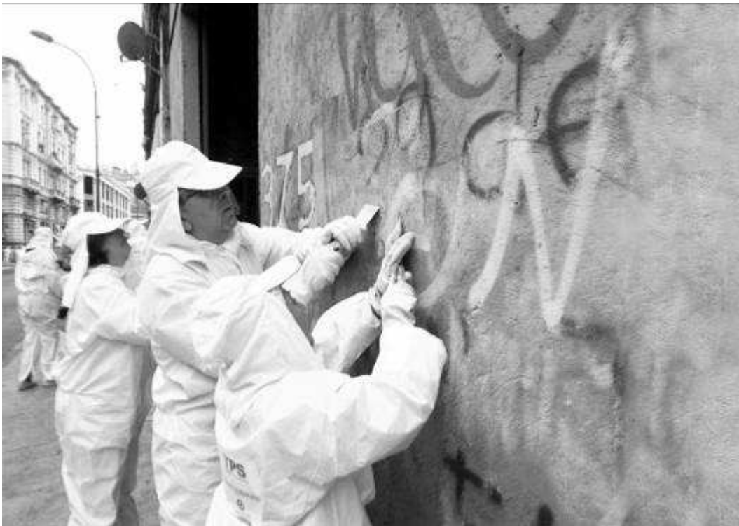
Valparaíso White Noise, 2012

En torno al proyecto de Valencia, RADICAL GEOGRAPHICS presenta una serie de proyectos de López Cuenca como el que se focaliza en la ciudad chilena de Valparaíso, Valparaíso White Noise, o Nerja Once, acerca de la ciudad natal del artista.