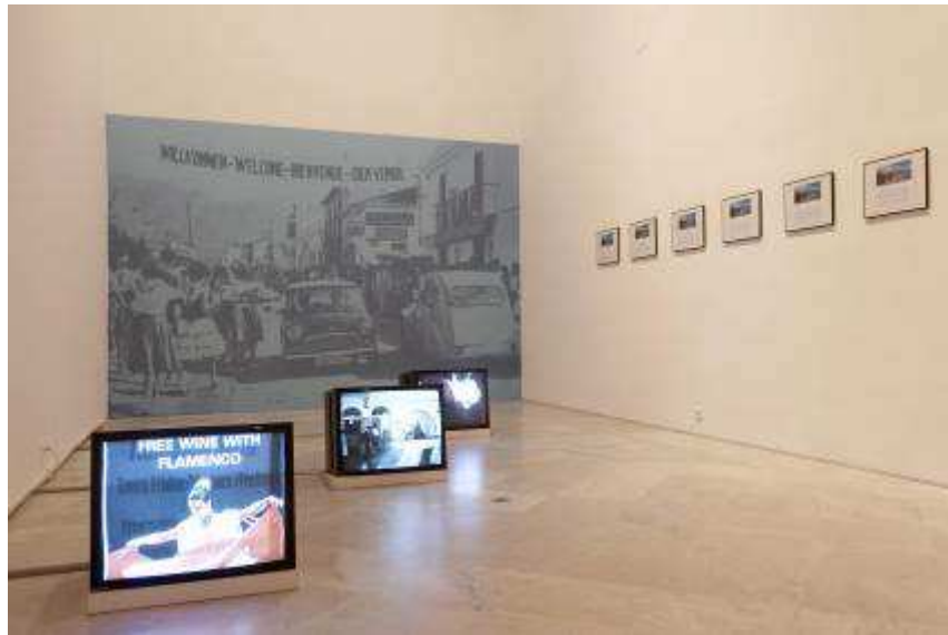
Nerja Once , 2004

El golpe de Estado del 11 de septiembre de 1973 dió sus primeros brutales zarpazos en Valparaíso. Las localizaciones de este mapa son en su mayoría lugares utilizados como centros de detención y tortura, pero también espacios que, por más que nunca se vieran salpicados de sangre, guardan el mudo estigma de su papel como nodos del régimen de terror que devastó Chile durante dos décadas.