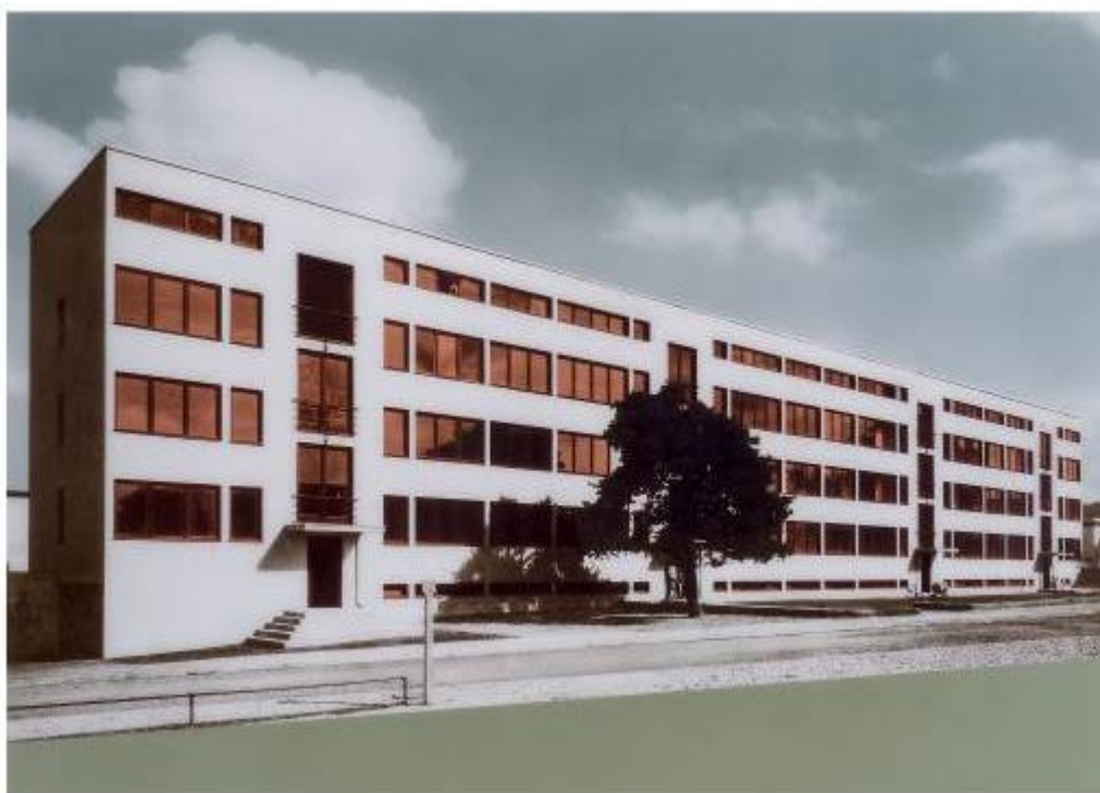
W.H.S. 02, 2002. Thomas Ruff. IVAM. Dipòsit Cal Cego