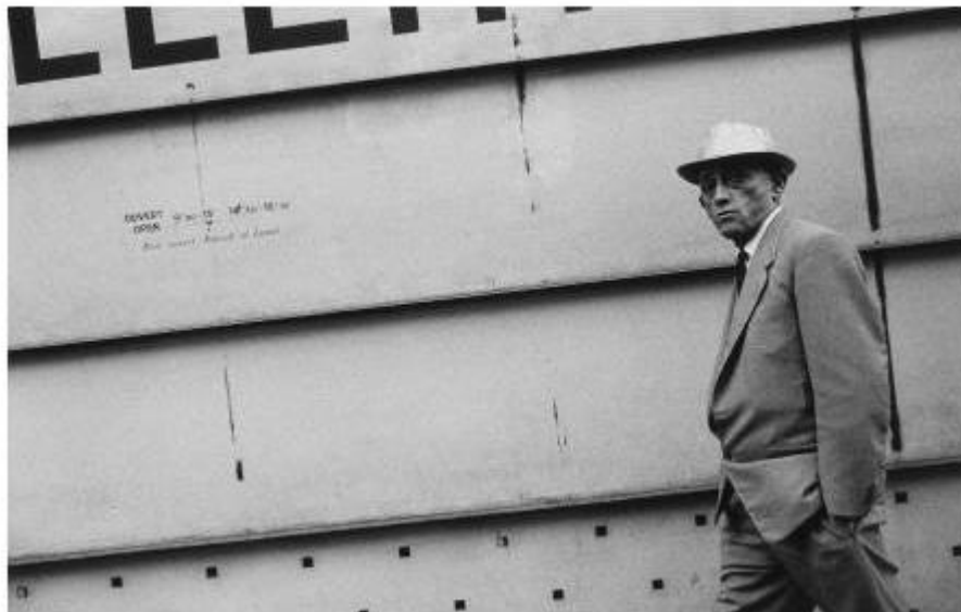
Rue de la Paix, Paris, 1962. Gabriel Cualladó. IVAM

entre 1993 i 1994 realitza Recorridos fotográficos por Arco 94 i Puntos de vista de la colección Thyssen-Bornemisza .