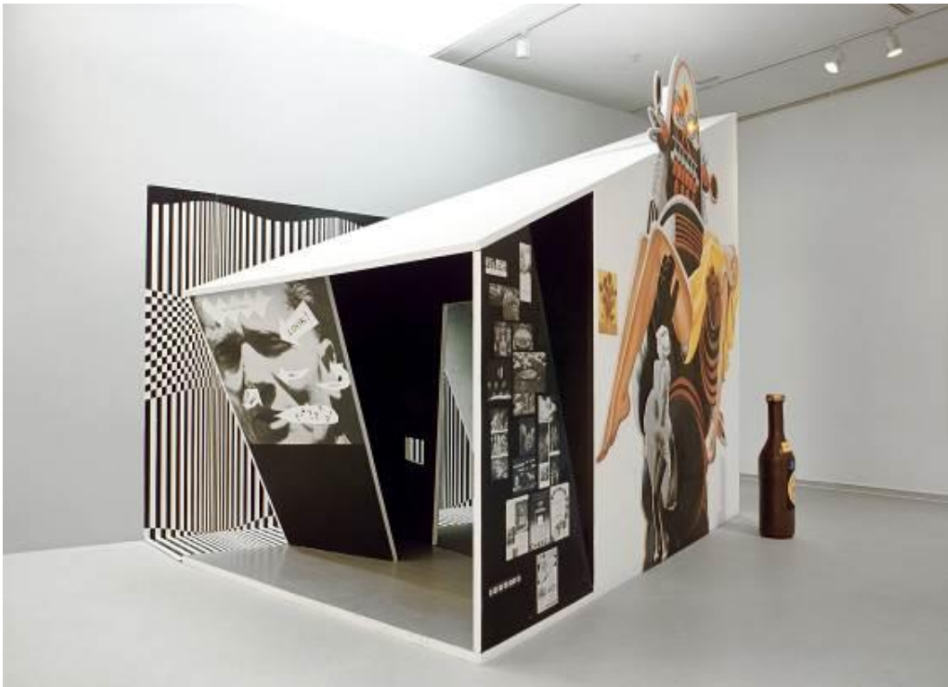
Fun House , 1956. Richard Hamilton. IVAM

A través de este extenso recorrido, que incluye fragmentos de películas como Alphaville , 1965, de Jean-Luc Godard , Skyscraper Symphonie , 1929, de Robert Florey ; In the Street , 1948, de Helen Levitt ; Empire , 1964, de Andy Warhol ; Splitting , 1970, de Gordon Matta Clark y Broadway by Light , 1958, de William Klein , pasamos de una gran celebración de las metrópolis, en el que la ciudad era la más clara manifestación de la modernidad, al desencanto que se materializa en la expresión de los miedos, la soledad, el control o la vigilancia.