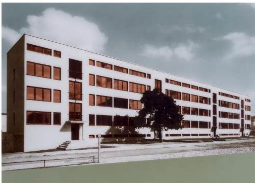
W.H.S. 02, 2002. Thomas Ruff. IVAM. Depósito Cal Cego