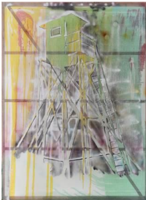
Torre de vigilancia, 1984. Sigmar Polke. IVAM

Antoni Muntadas (1942) ha sido uno de los artistas que ha analizado de forma específica los espacios arquetípicos del poder. En Stadium I-XV , 1989-2011, critica la política de tener entretenido al pueblo para suprimir la protesta y conseguir la paz social.