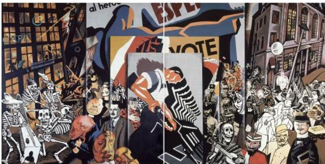
El panfleto , 1929. Equipo crónica. IVAM

Los habitantes de estas grandes metrópolis también sirven de fuente de inspiración a artistas como Robert Doisneau (1912-1994), Sergio Larraín (1931-2012), Ramón Masats (1931) o George S. Zimbel (1929), que buscan historias de individuos y multitudes. Fotógrafos como Agustí Centelles (1909-1985) o Kineo Kuwabara (1913-2007) relatan el papel de los ciudadanos en los principales hechos históricos.