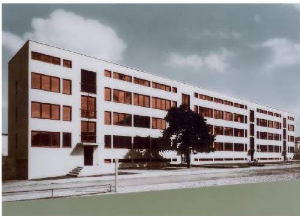
W.H.S. 02, 2002. Thomas Ruff. IVAM. Depósito Cal Cego