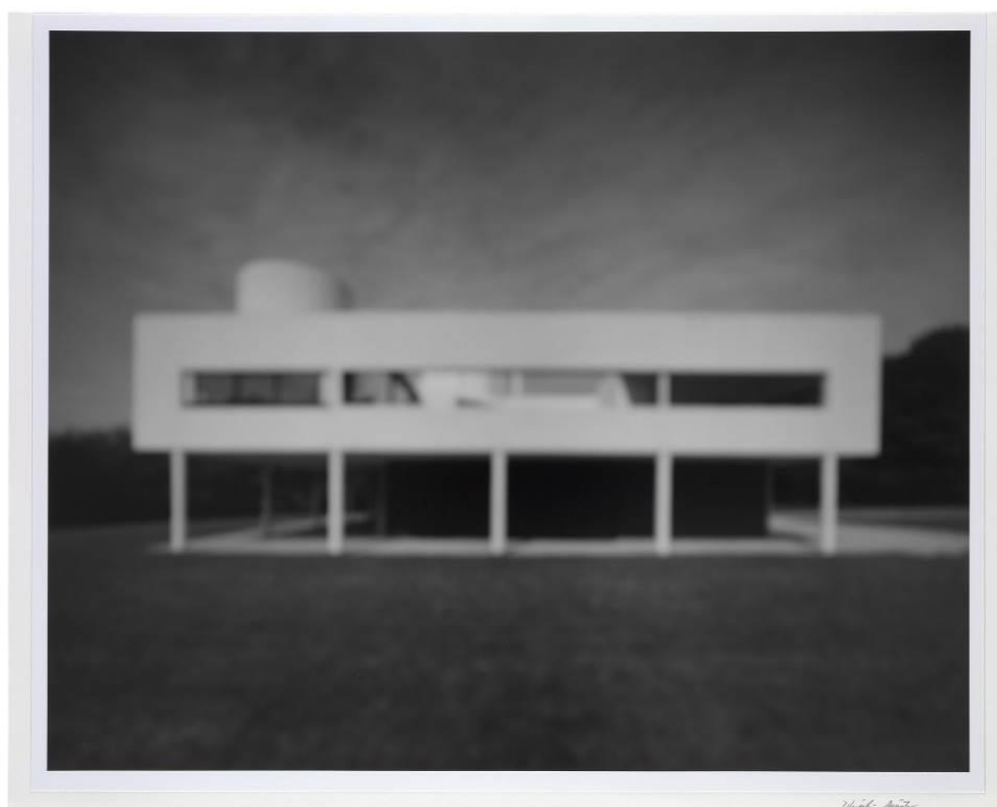
Villa Saboye , 1998. Hiroshi Sugimoto. IVAM. Depósito Cal Cego

En la serie de pinturas de paisajes urbanos nocturnos a la que pertenece Wet Evening , 1986, Alex Katz (1927) es capaz de articular el silencio, el inconsciente, la melancolía y la laxitud de las normas durante la noche.