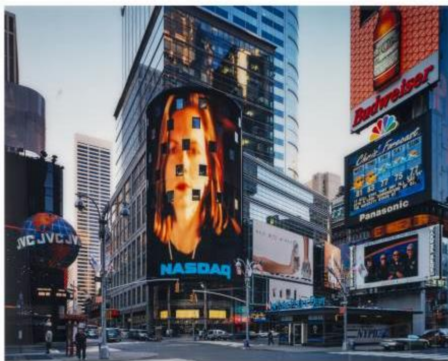
Times Square N.Y. 2000. Thomas Struth. IVAM. Depósito Cal Cego

En esta quinta sala pueden verse los edificios fotografiados por Gabriele Basilico (1944-2013), o el inventario de construcciones industriales de Bernd y Hilla Becher (1931-2007/1961-2007). Estos últimos fotógrafos alemanes recogen el espíritu documental y taxonómico de la obra, además de la obsesión minimalista por el serialismo y la pulcritud del objeto estético.