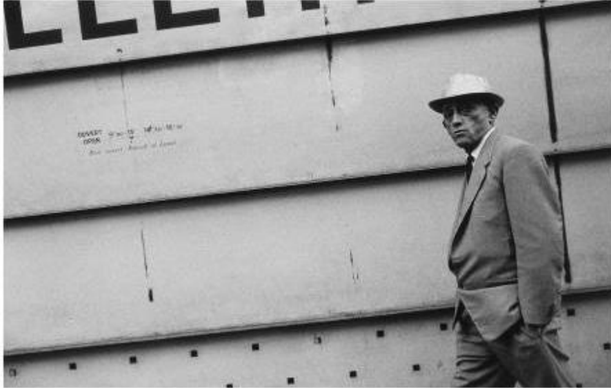
Rue de la Paix, Paris, 1962. Gabriel Cualladó. IVAM

y entre 1993 y 1994 realiza Recorridos fotográficos por Arco 94 y Puntos de vista de la colección Thyssen-Bornemisza .