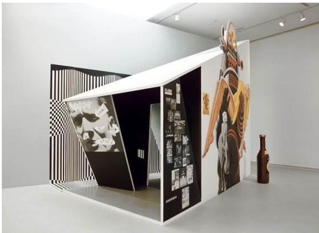
Fun House, 1956. Richard Hamilton.

A través de este extenso recorrido, que incluye fragmentos de películas como Just Image , 1930, de David Butler , Skyscraper Symphonie , 1929, de Robert Florey ; In the Street , 1948, de Helen Levitt ; Empire , 1964, de Andy Warhol y Splitting , 1970, de Gordon Matta Clark , pasamos de una gran celebración de las metrópolis, en el que la ciudad era la más clara manifestación de la modernidad, al desencanto que se materializa en la expresión de los miedos, la soledad, el control o la vigilancia.