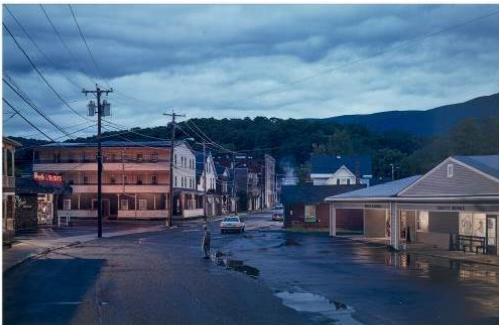
Untitled (Oasis) , 2004. Gregory Crewdson. IVAM. Depósito Cal Cego

Artistas como Anzo (1931-2006) y Juana Francés (1924-1990) y, posteriormente, Juan Muñoz (1953-2001), desarrollan trabajos reflexivos y críticos respecto a la condición existencial del ser humano frente al progreso industrial y tecnológico. En su obra Aislamiento , 1967, Anzo hace hincapié en la pérdida de sentido y de identidad de la persona descontextualizándolo, representándolo como un asceta en perfecta comunión con la mecanización, la industrialización y la vida en las oficinas. Juana Francés produce su serie El hombre y la ciudad , 1963, describiendo un entorno angustioso y agobiante, dominado por la incomunicación, la alienación y la continua transformación del hombre en máquina. Los personajes monocromos de rasgos impersonales de Juan Muñoz , como la escultura Chino frotándose las manos , 1995, analizan el aislamiento y la carencia de comunicación.