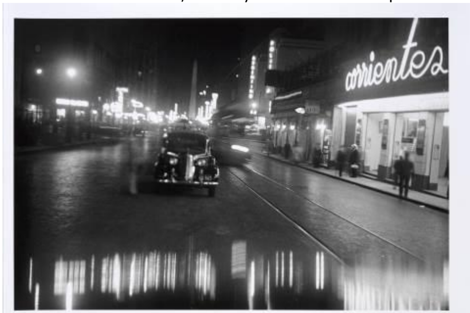
Corrientes esquina Uruguay, 1936. Horacio Coppola. IVAM

Horacio Coppola (1906-2012) crea decenas de imágenes en las que da cuenta del espíritu de Buenos Aires desde un punto de vista vanguardista, mostrando una ciudad moderna, abierta y ávida de nuevas experiencias.