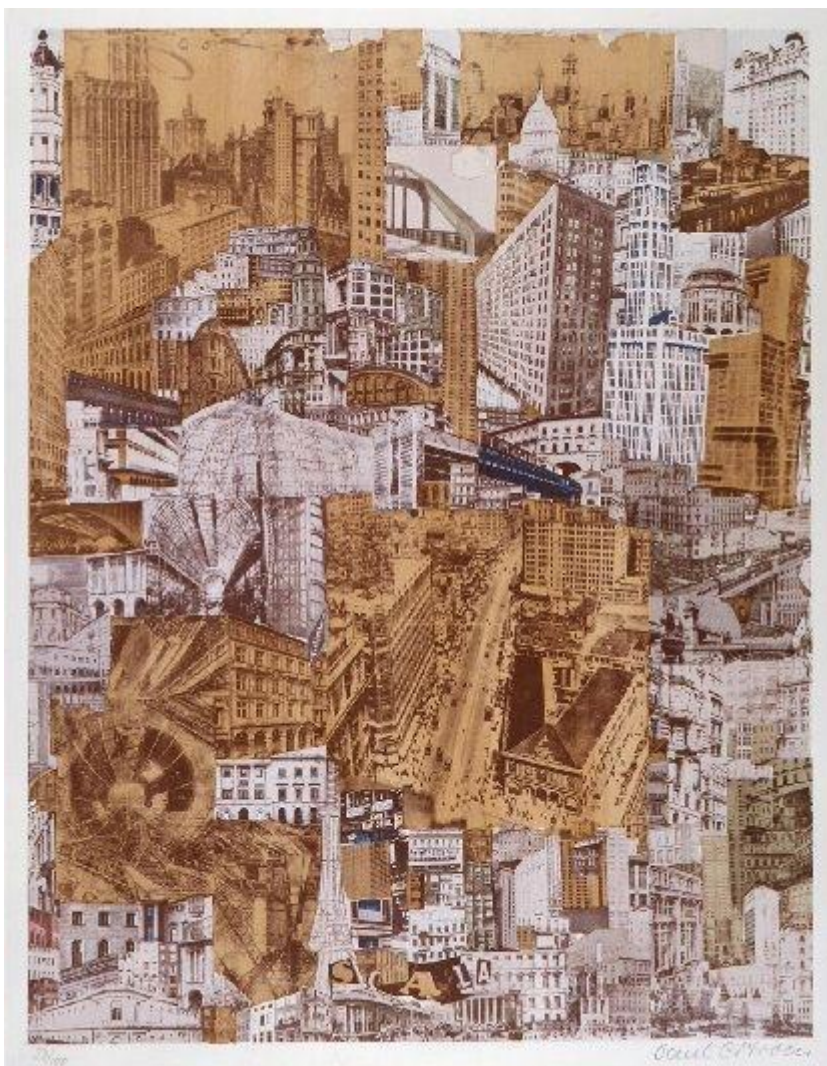
Metropolis , 1923. Paul Citroën. IVAM