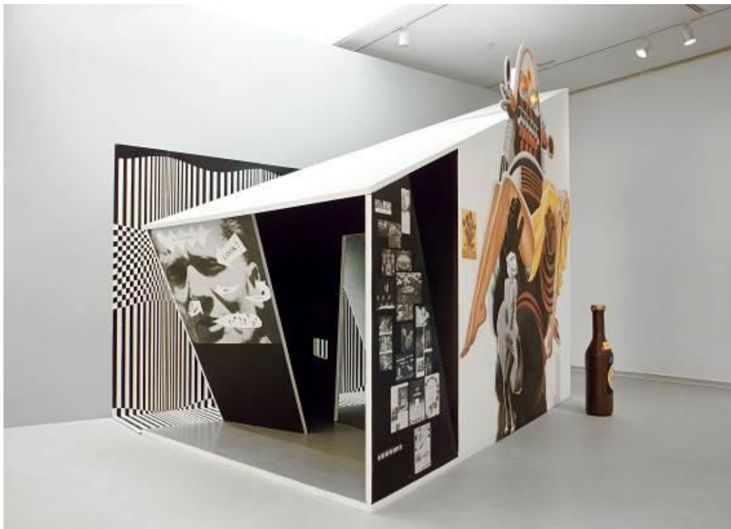
Fun House, 1956. Richard Hamilton.

A través de este extenso recorrido, que incluye fragmentos de películas como Just Image , 1930, de David Butler , Skyscraper Symphonie , 1929, de Robert Florey ; In the Street , 1948, de Helen Levitt ; Empire , 1964, de Andy Warhol y Splitting , 1970, de Gordon Matta Clark , pasamos de una gran celebración de las metrópolis, en el que la ciudad era la más clara manifestación de la modernidad, al desencanto que se materializa en la expresión de los miedos, la soledad, el control o la vigilancia.