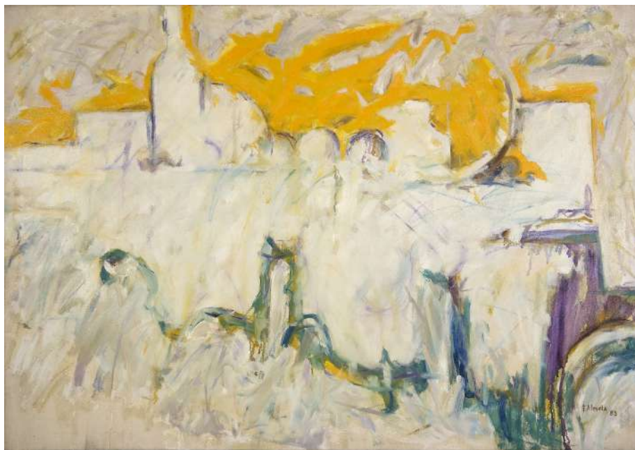
Bodegón entre amarillo y verde, 1983. Fernando Almela. IVAM

coleccionistas particulares y de la Fundación Anzo. Se trata de la primera exposición que dedica el museo al artista valenciano José Iranzo Almonazid 'Anzo' (Utiel, 1931-Valencia, 2006) tomando como objeto de estudio la serie Aislamientos , su trabajo más visionario e innovador..