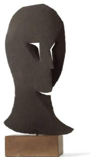
Máscara de adolescente , Ca. 1929-1930. Julio González

Les seues investigacions de les possibilitats expressives i estètiques del ferro l'han exalçat com l'inventor de l'escultura realitzada amb aquest metall, que ha donat il·lustres exemples en les últimes dècades dins i fora de les nostres fronteres. Com es pot comprovar en aquesta mostra, les solucions estructurals i la càrrega emocional que presenten les obres de Julio González van preparar el camí per a les imponents propostes espacials d'altres grans escultors.