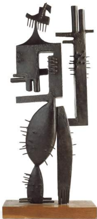
Hombre cactus I , 1939 Julio González

L'obra de Julio González orienta el desenvolupament de l'escultura contemporània en molts i diferents països i les seues troballes prometen més fruits en aquest camp artístic. La seua fortuna crítica no ha parat d'incrementar-se i encara que el reconeixement públic li va arribar tard, quan ja l'artista havia mort, successius homenatges han intentat corregir la seua discreta presència durant els seus anys d'activitat. En aquesta creixent admiració pels seus èxits plàstics, cal destacar el paper crucial que exerceix un altre gran escultor com va ser David Smith , amb el ja cèlebre article " González, el primer mestre de la soldadura ", publicat a Art News el 1956.