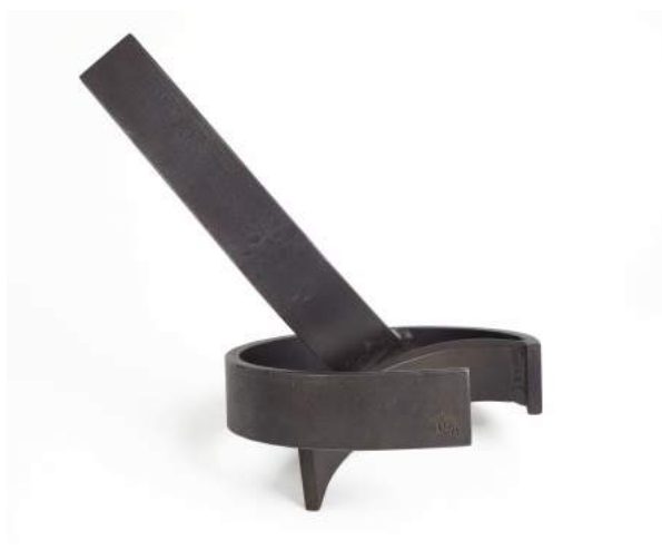
Subproducto móvil de la desocupación de la esfera, Ca. 1957-1958. Jorge Oteiza