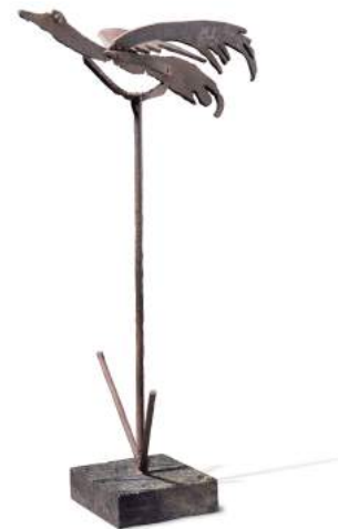
Tempus Fugit , 1951, David Smith

En definitiva, en el recorregut per l'obra escultòrica de Julio González podem parlar a grans trets d'una primera fase caracteritzada per una anàlisi formal a través de plànols, amb planxes retallades i soldades. Després sorgeix una altra forma lineal que li permet aprofundir en l'expressió del caràcter tridimensional i dinàmic de les figures.