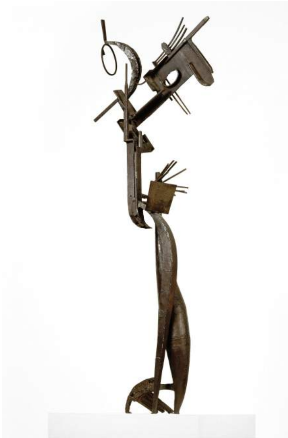
Mujer ante el espejo, ca. 1936-1937. Julio González

la base i el cap de Mujer ante el espejo de Julio González , la nostra mirada descobreix amb sorpresa la metamorfosi de la figura femenina, en seqüències rítmiques formals que aturen el temps i amplien l'espai. En aquesta mateixa sala les escultures de David Smith i Joel Shapiro apel·len a la imaginació i a les vivències de l'espectador per establir els diferents plans de la realitat del món i del cos.