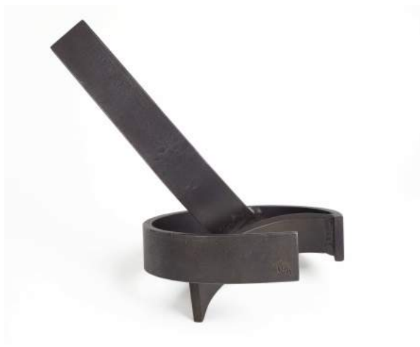
Subproducto móvil de la desocupación de la esfera, Ca. 1957-1958. Jorge Oteiza