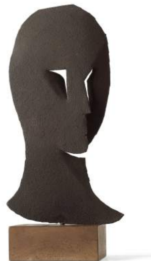
Máscara de adolescente , Ca. 1929-1930. Julio González

Sus investigaciones de las posibilidades expresivas y estéticas del hierro lo han encumbrado como el inventor de la escultura realizada con este metal, que ha dado ilustres ejemplos en las últimas décadas dentro y fuera de nuestras fronteras. Como puede comprobarse en esta muestra, las soluciones estructurales y la carga emocional que presentan las obras de Julio González prepararon el camino para las imponentes propuestas espaciales de otros grandes escultores.