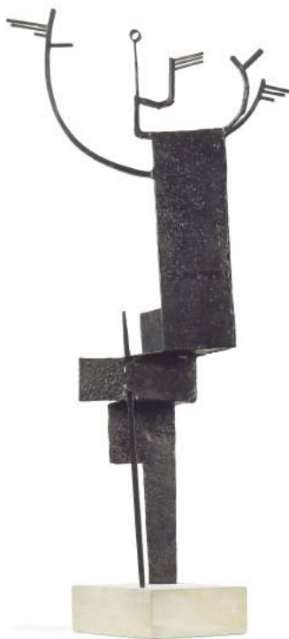
Daphné , 1937. Julio González

El IVAM presenta Las constelaciones de Julio González: entre la representación y la abstracción , una nueva lectura de la colección de Julio González (Barcelona, 1876 – Francia, 1942). Custodiada por el museo desde su fundación, dicha colección está considerada la más completa que existe sobre la obra del escultor español. De las más de 200 obras que integran estos fondos, se ha seleccionado para esta muestra más de 40, entre las que no faltan las más singulares y representativas del denominado "maestro del hierro" , como Mujer ante el espejo (ca. 1936-1937), Los enamorados II (ca. 1932-1933), Daphné (1937), El sueño/el beso (ca. 1934) o Máscara de adolescente (ca. 1929-1930).