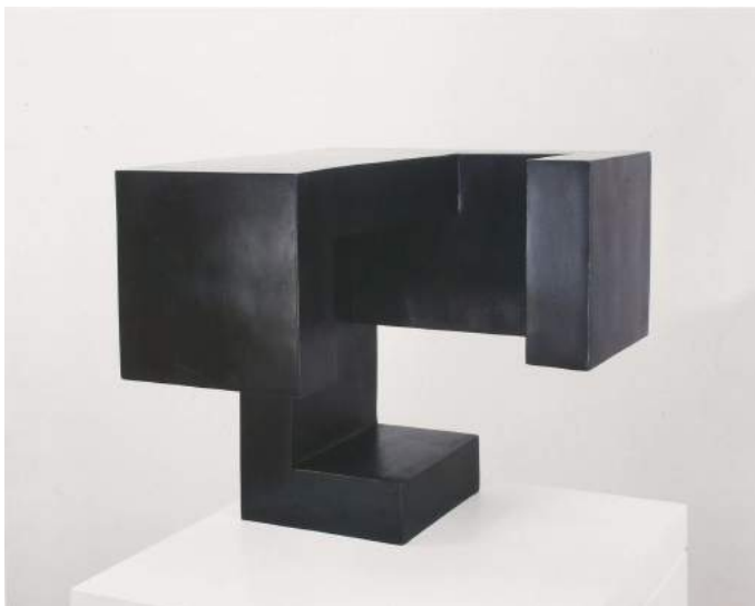
The Keys to Given!, 1965. Tony Smith

El artista incorpora la nueva sensibilidad a sus personajes dotándolos de movimiento y plasticidad, con un fuerte componente expresivo en el trabajo de la planchas y otros elementos. Tanto Tony Smith como Martín Chirino siguen el rumbo anunciado por Julio González y se debaten entre las manifestaciones del orden y la naturaleza.