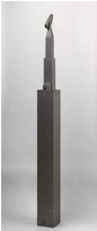
Totem de luna, 1995, Miquel Navarro

Julio González superó ampliamente las posibilidades constructivas de los materiales artesanales e industriales. La estabilidad y resistencia técnicas de distintos fragmentos forjados y soldados resuelven una invención formal que afecta a la experiencia y percepción. Por su parte la naturaleza plástica de la luz se incorpora en la obra de este artista a la forma, al tiempo que las partes sombreadas constituyen la posesión del vacío. Las misteriosas formas de Reiner Ruthenbeck y Georg Herold reivindican el poder evocador de otro tipo de materiales integrados en actividades humanas de distinta índole, mientras que la propuesta totémica de Miquel Navarro nos devuelve el concepto de jerarquía y estructura.