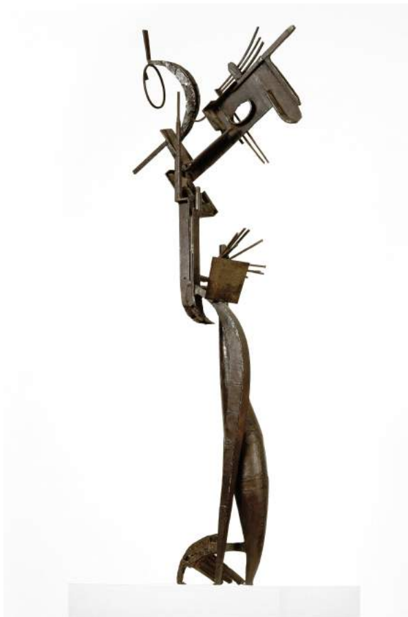
Mujer ante el espejo, ca. 1936-1937. Julio González

público como una figura unívoca y definitiva, sino que reclama la creación de relatos. Entre la base y la cabeza de Mujer ante el espejo de Julio González , nuestra mirada descubre asombrada la metamorfosis de la figura femenina, en secuencias rítmicas formales que detienen el tiempo y amplían el espacio. En esta misma sala las esculturas de David Smith y Joel Shapiro apelan a la imaginación y a las vivencias del espectador para establecer los diferentes planos de la realidad del mundo y del cuerpo.