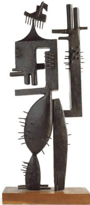
Hombre cactus I , 1939 Julio González

La obra de Julio González orienta el desarrollo de la escultura contemporánea en muchos y diferentes países y sus hallazgos prometen más frutos en este campo artístico. Su fortuna crítica no ha parado de incrementarse y aunque el reconocimiento público le llegó tarde, cuando ya el artista había fallecido, sucesivos homenajes han intentado corregir su discreta presencia durante sus años de actividad. En esta creciente admiración por sus logros plásticos, cabe destacar el papel crucial que desempeña otro gran escultor como fue David Smith , con el ya célebre artículo " González, el primer maestro de la soldadura ", publicado en Art News en 1956.