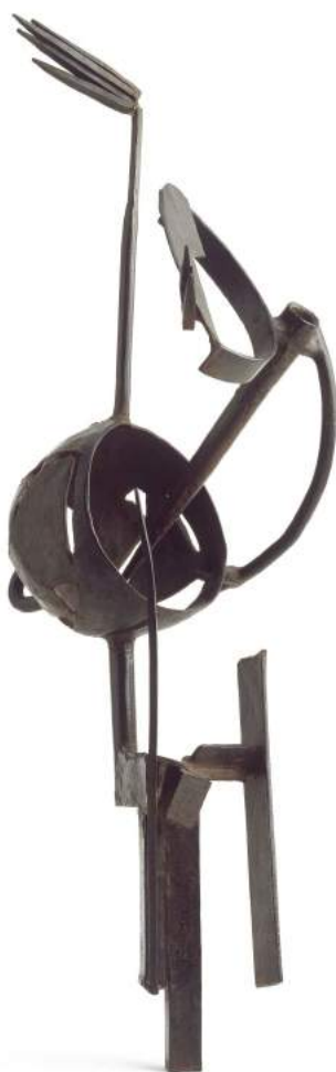
El sueño/El Beso, 1934. Julio González