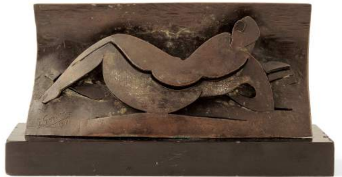
Mujer recostada leyendo, 1930, Julio González