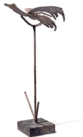
Tempus Fugit , 1951, David Smith

En definitiva, en el recorrido por la obra escultórica de Julio González podemos hablar a grandes rasgos de una primera fase caracterizada por un análisis formal a través de planos, con planchas recortadas y soldadas. Después surge otra forma lineal que le permite profundizar en la expresión del carácter tridimensional y dinámico de las figuras.