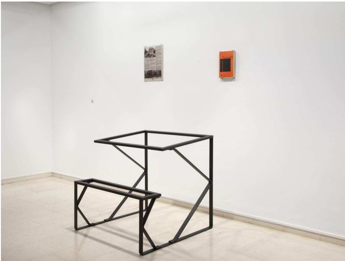
Arco voltaico , 2016. Xavier Arenós