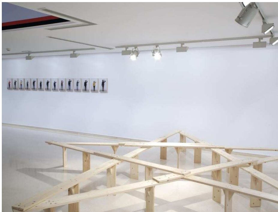
Dibujar una estrella de cinco puntas, 2016. Xavier Arenós

Esta obra, compuesta por un conjunto de fotografías y un banco de madera, fue realizada con la colaboración de los participantes del taller que dirigió Xavier Arenós en la facultad de Bellas Artes de Valencia y con el Instituto para Obreros como eje vertebrador.