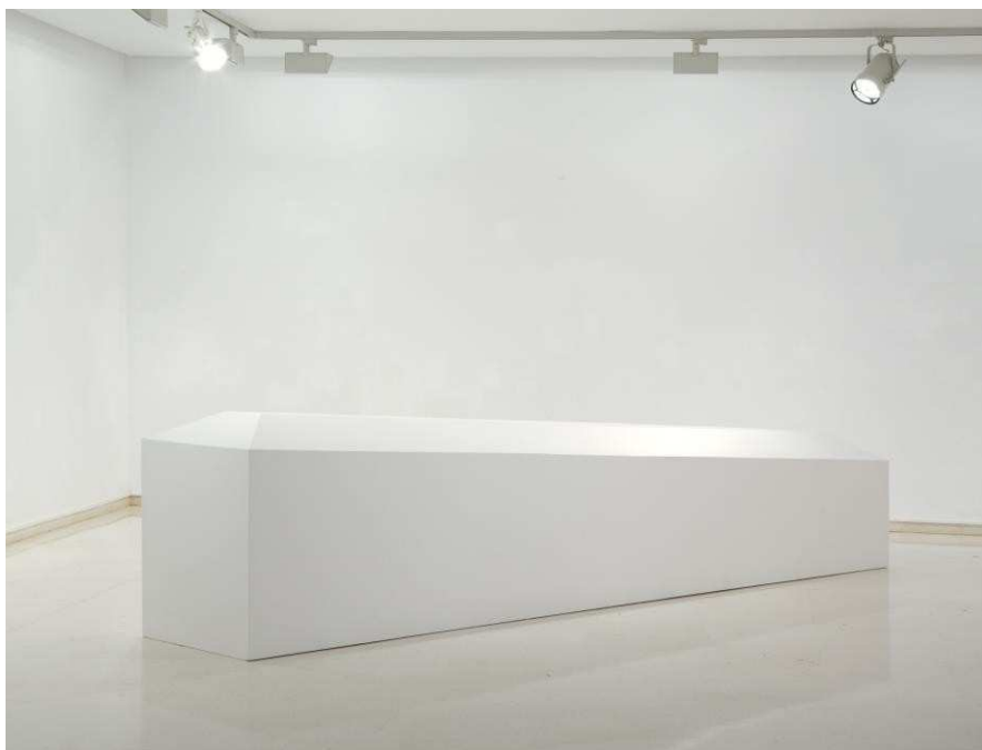
Peana para tres banderas, 2016. Xavier Arenós

El Pabellón se construyó sobre un terreno irregular y en pendiente que tuvo que tenerse en cuenta a la hora de instalar tres mástiles para que ondearan las banderas republicana, catalana y vasca. Para soportar la fricción del viento, por su elevada altura, se ideó un encofrado de cemento que anclase los postes bajo tierra.