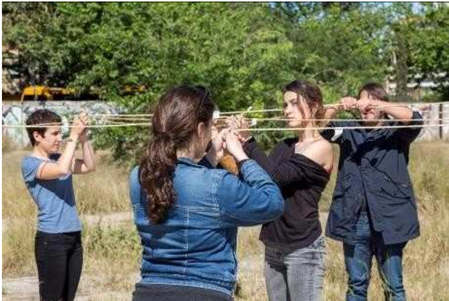
Imagen del Taller Dibujar una estrella de cinco puntas , 2016

Durante el taller se llevaron a cabo dos actividades relacionadas directamente con la exposición. La primera consistió en una fotografía colectiva realizada en una parte del Instituto que fue derruida donde, usando el cuerpo de los alumnos del taller como vértices, se compuso la forma de una estrella de cinco puntas imitando a la que aparecía en la fachada del Instituto Obrero.