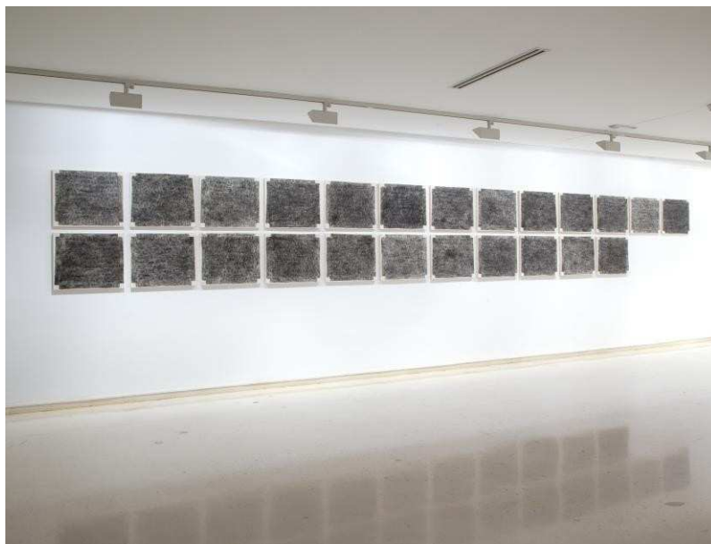
Trama y urdimbre, 2016. Xavier Arenós

Entre las icónicas fotografías del Pabellón Español hay una que muestra el patio totalmente vacío con dos filas de 24 sillas mirando el escenario. Es muy probable que en esas mismas sillas –perfectamente alineadas– se hubieran sentado algunos de los principales actores vinculados con el Pabellón. El vacío y la atmósfera de la imagen resulta inquietante y premonitoria porque parece anunciar la derrota y la soledad del exilio.