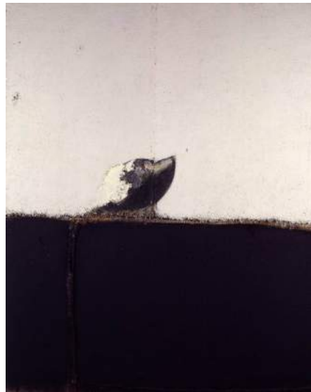
El perro II, 1985. Manolo Valdés. Col. IVAM

mítica Picadilly Circus londinesa con luminosos anuncios pintados con colores psicodélicos. Esta pieza dialoga con el tenebrismo de la pintura valenciana ribaltésca, eco del tenebrismo de Caravaggio pero también del autóctono, del primer naturalismo hispano de finales del s XVI y de la primera década del s. XVII.