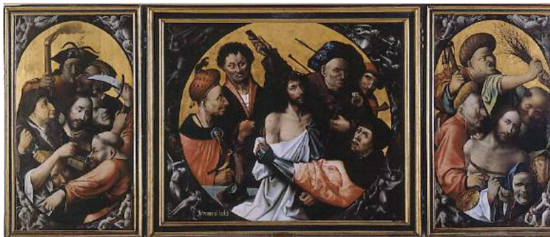
Triptico de los Improperios o de la Pasión, c. 1450-1516). El Bosco. Col. Museo Bellas Artes