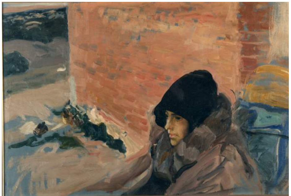
Retrato de María convalesciente, 1985. Joaquín Sorolla. Col. Museo de Bellas Artes