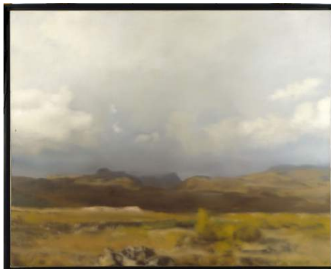
Islas Canarias, 1970, Gerhard Richter. Colección del IVAM

llunyania de Simon de Vós dialoguen amb els paisatges contemporanis de Roth i Richter.