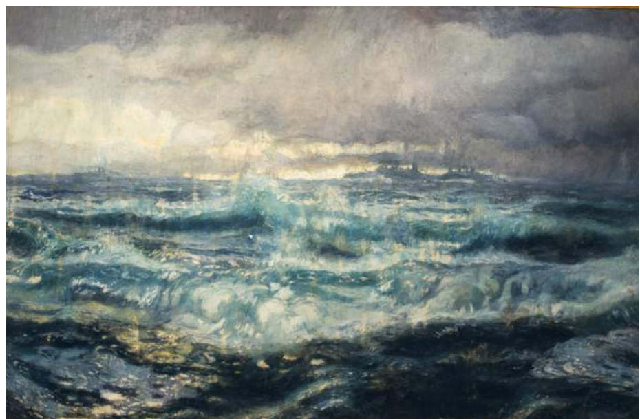
Sin rumbo , 1940. Pedro Ferrer Calatayud. Col. Museo de Bellas Artes.

TENÍEM TOT AL NOSTRE FAVOR La col·lecció de l'IVAM viatja al Museu de Belles Arts