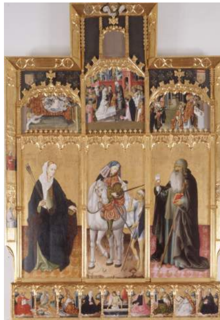
Retablo de San Martín, Santa Úrsula, San Antonio Abad. Gonçal Peris. Col. Museo Bellas Artes