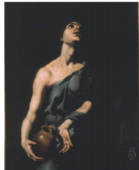
María Magdalena. Pedro Orrente. Col. Museo de Bellas Artes.

La obra La noche de Equipo Realidad (Jorge Ballester, València 1941-2014, Joan Cardells, València 1948), una obra contemporània perteneciente a la Colección del Museo de Bellas Artes muestra una escena nocturna de la