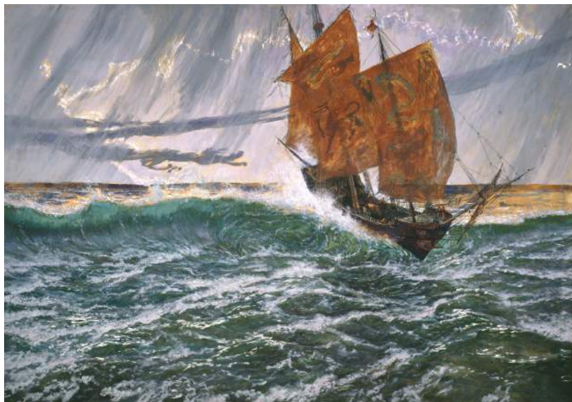
El buque fantasma , Antonio Muñoz Degraín. Col. Museo de Bellas Artes