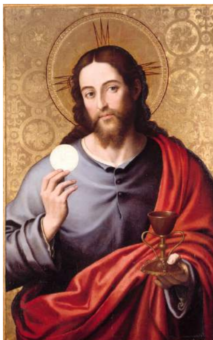
Salvador Eucarístico. Joan de Joanes. Col. Museo Bellas Artes

pretén generar un fil argumental sobre la gravetat, la llum, el cos i els processos.