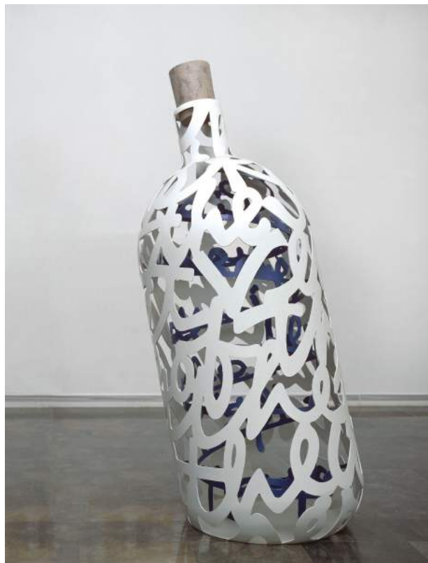
Bottle of notes , c. 1989-1990, Claes Oldenburg, Coosje van Bruggen. Col. del IVAM