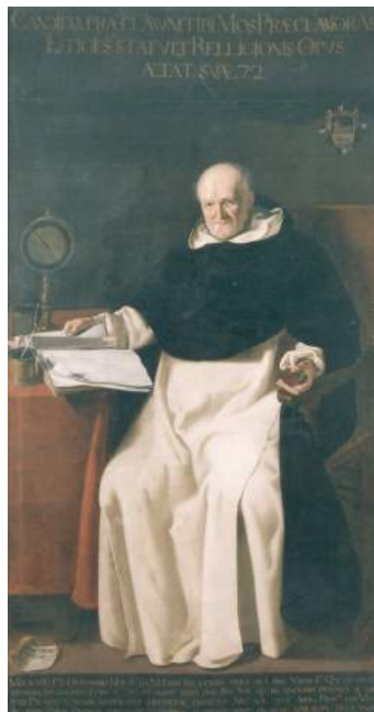
Retrato del padre Jerónimo Ros. Jerónimo Jacinto de Espinosa. Col. Museo de Bellas Artes

del primer naturalisme hispà de finals del s XVI i de la primera dècada del s. XVII.