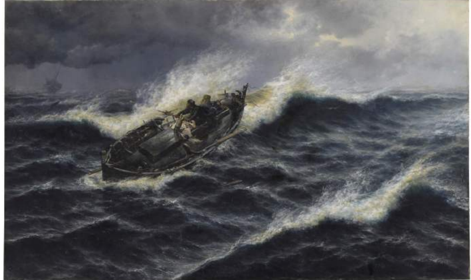
A la deriva en alta mar , 1887, Salvador Abril. Colección Museo de Bellas Artes

La muestra comienza con la escultura Bottle of Notes, model, ca. 1989-1990 de los artistas Claes Oldenburg & Coosje van Bruggen que se acompaña