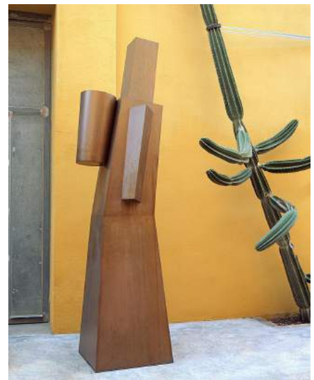
Torre prisma piramidal, 2001, Miquel Navarro. Col. IVAM

La exposició termina en el patio del Palacio del Embajador Vich, testimonio del renacimiento italiano en España, que acoge la Torre Prisma Piramidal de Miquel Navarro (València, 1945). Rodeado de las sólidas columnas de mármol de Carrara, este tótem del escultor valenciano brota desde el centro del patio como símbolo de lo sagrado.