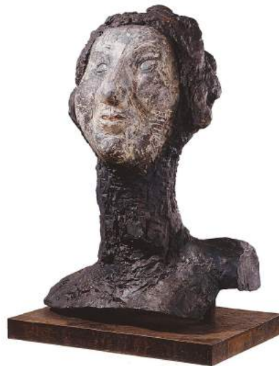
Kopf der Judith, 1995. Col. IVAM