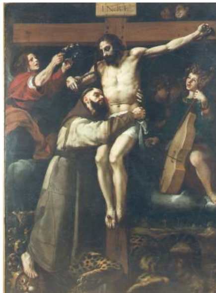
Abrazo de San Francisco de Asís al crucificado. Francisco Ribalta. Col. Museo Bellas Artes

crucificado de Francisco Ribalta en el qual s'aprecia com la punta del clau aflora de la mà de Crist. Un referent iconogràfic que transcendeix la religiositat més popular.