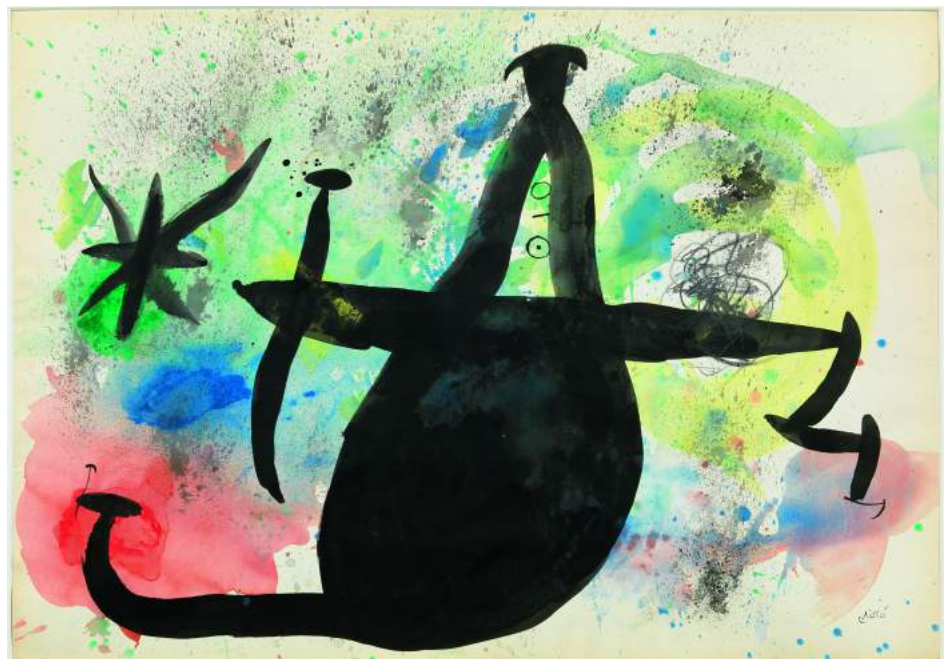
JOAN MIRÓ. Femme dans la nuit , 1970, Museu d'Art Contemporani de Barcelona. © Successió Miró 2018

La segunda sala muestra la experimentación en su obra pictórica en el trabajo de representación. En los años treinta algunos de sus signos empezaban a mostrar rasgos que