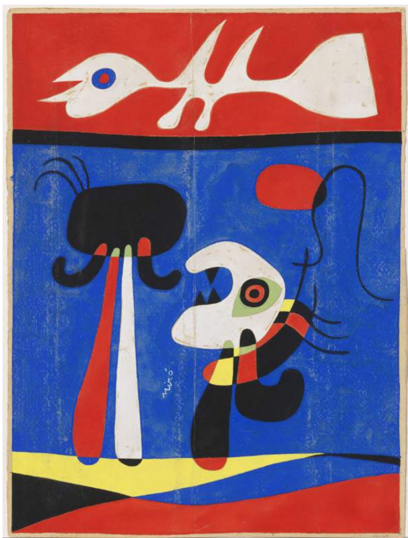
JOAN MIRÓ. Sin título (Diseño para estarcido), ca. 1946. Fundació Joan Miró.