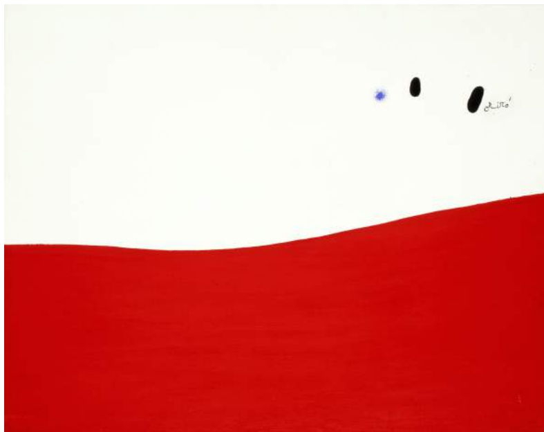
JOAN MIRÓ. Paisage, 1974. Fundació Joan Miró.

L'IVAM presenta presenta l'exposició Miró. Ordre i Desordre amb l'objectiu de mostrar la faceta més heterodoxa de l'artista a través de 200 obres, entre pintures, escultures, dibuixos, ceràmiques, cartells i peces vinculades amb les arts escèniques, procedents d'una quinzena d'institucions nacionals i internacionals, com el Museu Reina Sofia, el Museu Thyssen Bormemisza, la Fundació Juan March de Madrid, el MACBA, la Fundació Joan Miró, la Fundació la Caixa de Barcelona, el museu Es Baluard, la Fundació Pilar i Joan Miró de Palma, o el Museu Boijmans Van Beuningen de Rotterdam.