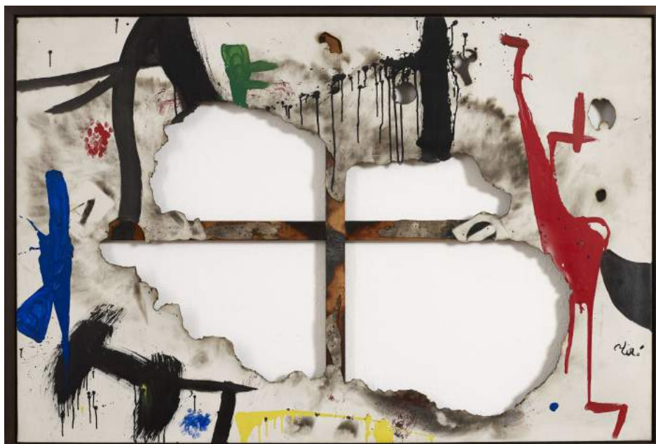
JOAN MIRÓ. Tela cremada, 1973. Fundació Joan Miró.

altre ordre. O en un altre desordre, com s'observa en l'obra del 1973 titulada Tela cremada .