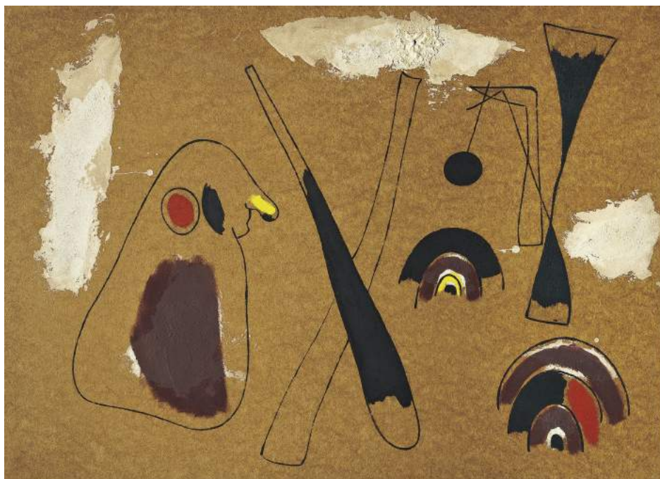
JOAN MIRÓ. Pintura (sobre masonite), 1936, Fundació Joan Miró.