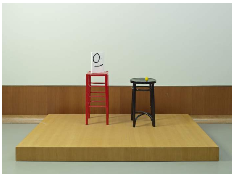
JOAN MIRÓ. Monsieur et Madame , 1969. Museum Boijmans van Beuningen