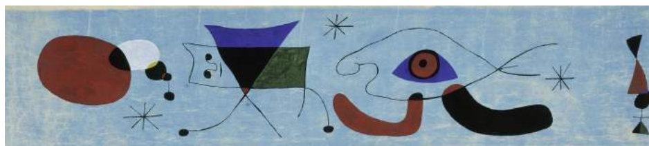
JOAN MIRÓ. Boceto para la pintura mural del Terrace Plaza Hotel de Cincinnati, 1947. Fundació Joan Miró.

de circ o la seua col·laboració amb els ballets russos de Diaghilev. Aquesta dedicació al món de l'escena té el seu colofó en l'obra Mori el Merma , un espectacle de la companyia Claca Teatre amb decorats, màscares i titelles dissenyats i pintats per Miró.