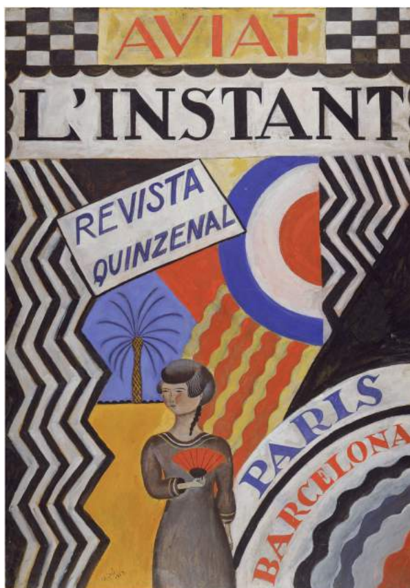
..JOAN MIRÓ. Aviat l'Instant , 1919. IVAM. © Successió Miró 2018

En la obra de Miró, el cartel supone la captación instantánea de su mundo iconográfico y la posibilidad de llevar la provocación que sus signos generaban en las galerías o en los museos al centro de la vida pública. La muestra incluye el cartel titulado Aviat l'Instant , 1919,