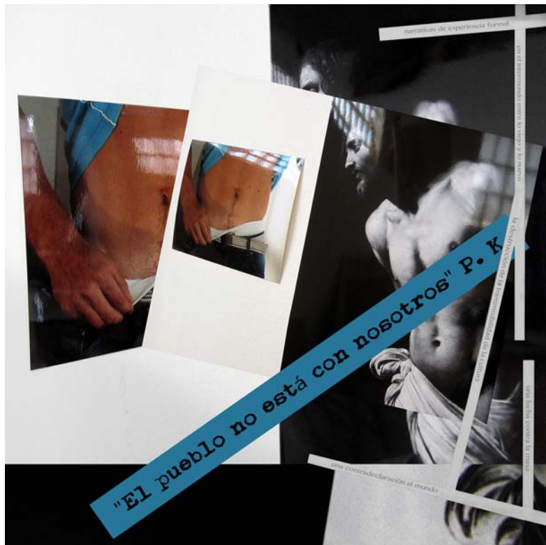
El Pueblo no está con nosotros. Intervenció de Txomin Badiola per a la façana de l'IVAM / Intervención de Txokmin Badiola para la fachada del IVAM