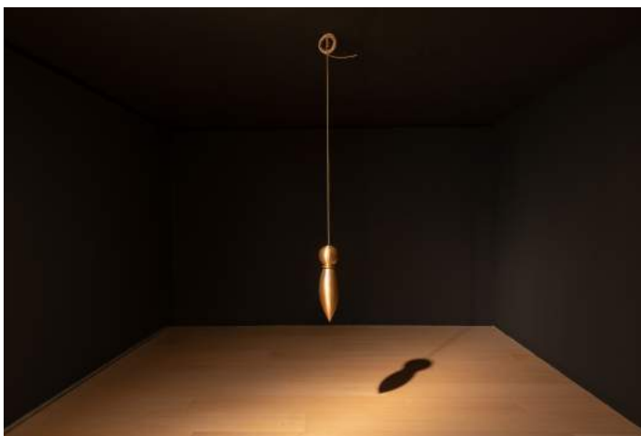
El péndulo de oro, 2006.