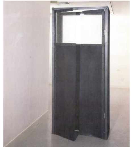
Puertas (Serie El tránsito ), 1987. Fundació La Caixa

tránsito. Una de las más sorprendentes era la insólita -por los materiales empleados- Desembocadura , una obra realizada en madera y sal que se ha reconstruido expresamente para esta exposición. La obra fue concebida por la artista como una metáfora de los ciclos de la naturaleza, de la transformación de la materia en su devenir.