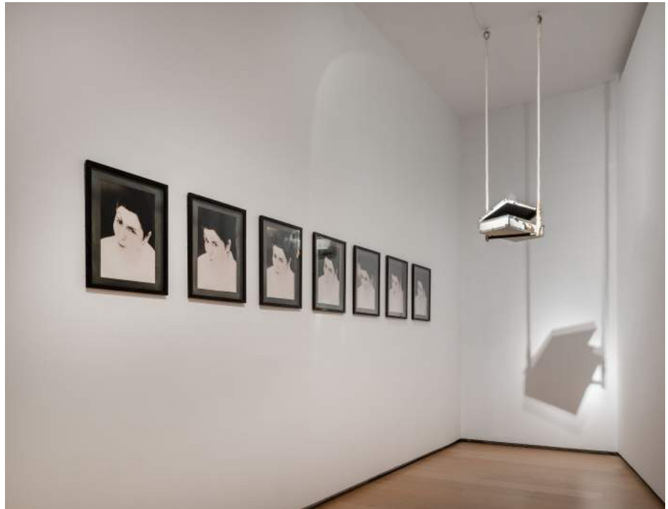
"Entre" en la duda, 1993.

enigmàtiques superfícies de cautxú lliscants, ponts dislocats, palanques relliscoses o pertorbadors elevadors sobre els quals apuntar-se a l'abisme de l'existència.