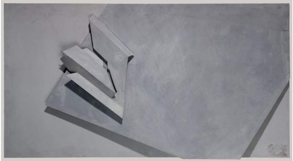
Mesa de proyecto , 1983. Colección MNCARS

memòria, que el propi IVAM va dedicar a l'escultora.