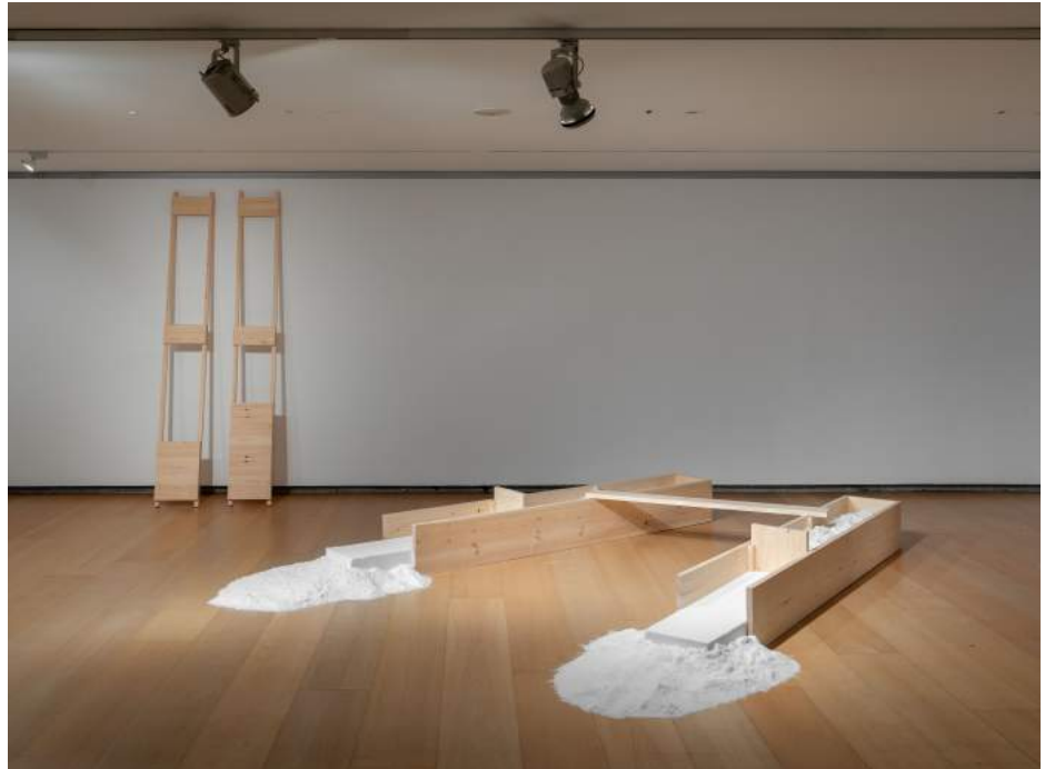
Desembocadura, 1986.

Este conjunto de obras realizado en 1986 fue un hito en el desarrollo de la práctica escultórica de Ángeles Marco, ya que incorporó de una manera mucho más programática el concepto de instalación, es decir, la apuesta por definir una narración escultórica en forma de escenografía. La disposición calculada en un habitáculo de estos objetos reconocibles provenientes del mundo doméstico (una mesa, un sobre, unas cajas) conduce al público a traspassar el umbral donde comienza el espacio de la confusión, el delirio, o el sueño.