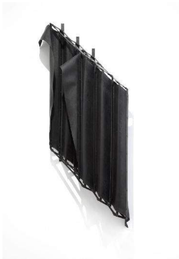
Pasadizo de pared, 1989. Colección del IVAM