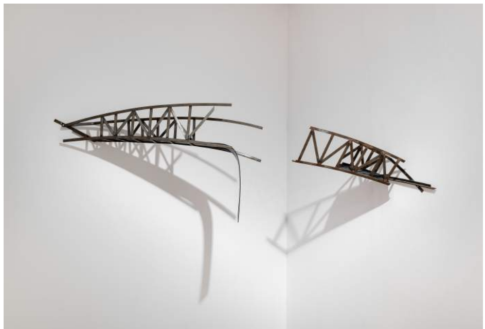
Puente, 1986. Colección Ajuntament d'Alfajar.

Otros artefactos presentes en aquella exposición, como Puertas o Acera , simulan ser enigmáticas puertas de acceso a espacios inhóspitos o pegajosas aceras impracticables que desprenen un fuerte olor a alquitrán, lugar de ciénaga