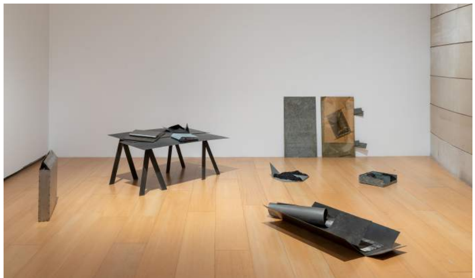
Entre lo real y lo ilusorio , 1986, Cortesía familia de la artista, Galería Espai Visor

En la serie de obras titulada Espacios Ambiguos (1981-1985) encontramos el origen genuino del lenguaje escultórico de Ángeles Marco . En estos extraños relieves grisáceos realizados sobre chapa metálica y despojados ya del cromatismo de sus obras modulares del periodo anterior, la artista abordará problemáticas nucleares como el misterio y la ambigüedad perceptiva, así como la transgresión de la visión del espectador.