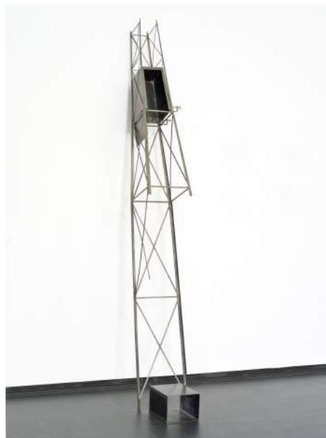
Ascensor oblicuo, 1987. Colección CA2M

Aquesta obra va formar part del germen de la seua sèrie Salto al vacío , un vast conjunt conformat per