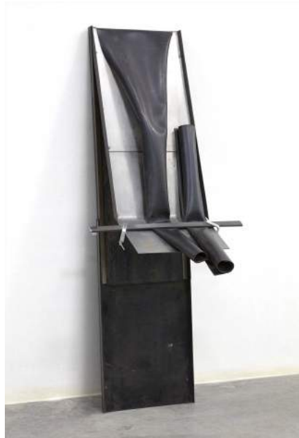
Abismos nº2 (Serie Salto al vacío), 1988. MNCARS, Colección Soledad Lorenzo

Su instalación sonora "Entre" en la duda