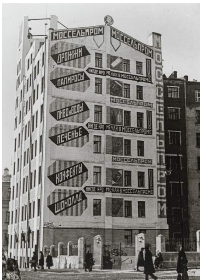
ALEXANDR RÓDCHENKO. Establecimiento Mosselprom, 1925.

La exposición también analiza los ejemplares que Ródtchenko y su mujer, la artista Varvara Stepánova , diseñaron para la revista propagandística URSS en construcción , impulsada por Stalin durante los años 30 para dar a conocer al mundo los logros de los planes quinquenales auspiciados por el dictador. Durante esta época Ródtchenko había hecho evolucionar su fotografía a un desarrollo conceptual que acercaba cada vez más su trabajo a la práctica de la fotografía documental y al