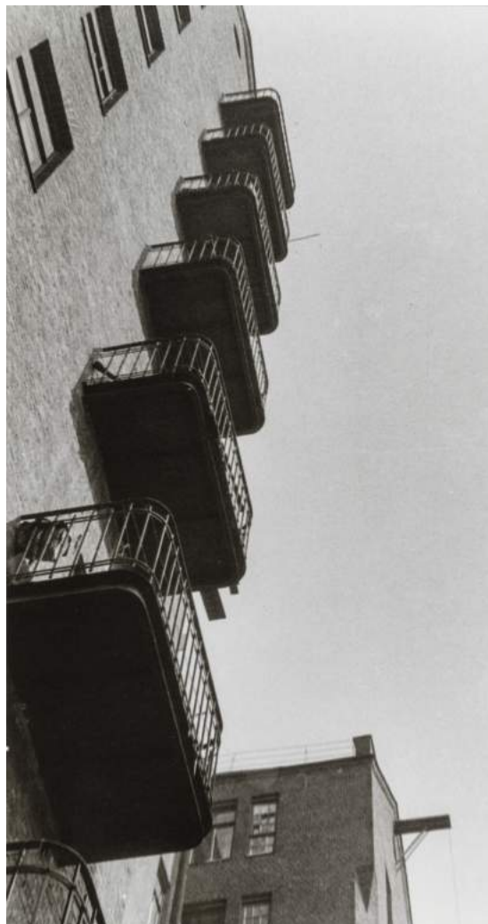
ALEXANDR RÓDCHENKO. Balcones, 1925. Archivo Lafuente