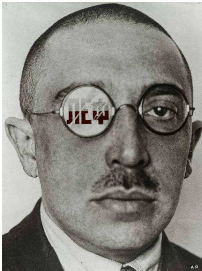
ALEXANDER RÓDCHENKO. Osip Brik, 1924. Archivo Lafuente

L'IVAM presenta l'exposició Caso de Estudio . Ródtchenko comissariada per Joan Ramón Escrivà que analitza les radicals aportacions de l'artista rus Alexandr Ródtchenko (Sant Petersburg, 1881 - Moscou, 1956) al món de la fotografia i el disseny gràfic a partir de 1921, quan abraça la causa del constructivisme i el productivisme. La mostra, que s'exhibeix a la galeria 3 de l'IVAM del 13 de març al 26 d'agost, reuneix una selecció de més de 100 obres, entre les quals s'inclouen llibres, fotos i revistes de l'època, procedents de la Col·lecció de l'IVAM, de la Biblioteca del MNCARS i un important préstec de l'Arxiu Lafuente de Santander.