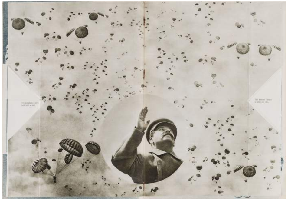
ALEXANDER RÓDCHENKO. Revista URSS en contrucción , 1935. Col. del IVAM

procés de industrialització i de transició cap al socialisme. Va ser aquesta una època en què el format dels llibres, les revistes o la cartellística comercial i política, va experimentar en aquest país la major revolució des que Mallarmé dinamités els esquemes de lectura i de composició del llibre tradicional amb el seu poema Un coup de dés jamais n'abolira le hasard (1897).