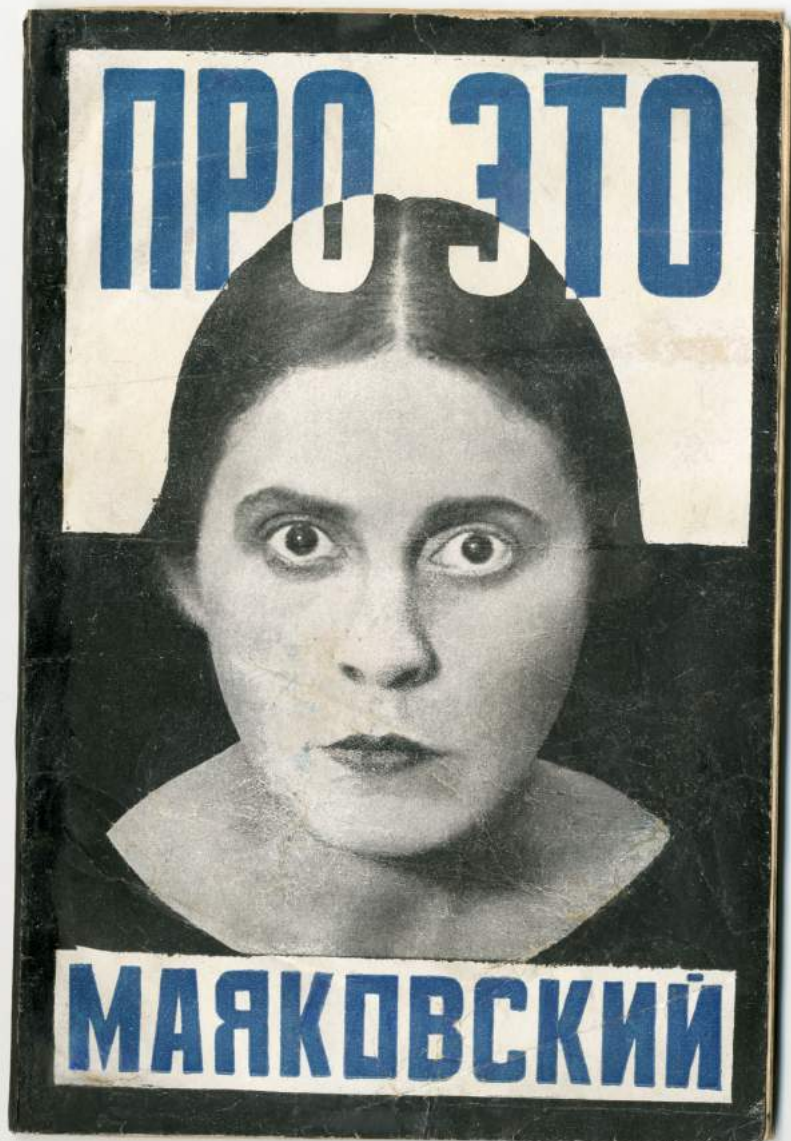
ALEXANDER RÓDCHENKO. Cubierta del libro Sobre Esto de Mayakovsky, 1923.

Abans de convertir-se en un dels grans mestres de l'avantguarda fotogràfica soviètica, Ródtchenko va començar els seus primers experiments amb la càmera com un aficionat. Va ser l'any 1924 quan va adquirir el seu primer equip mogut per la necessitat d'optimitzar els seus recursos en la realització dels seus fotomuntatges. Era obvi que Ródtchenko era, a més, plenament conscient de l'enorme potencial que tenia la fotografia, com així quedava manifest en les pàgines de Kinó-fot o la revista LEF en què col·laborava.