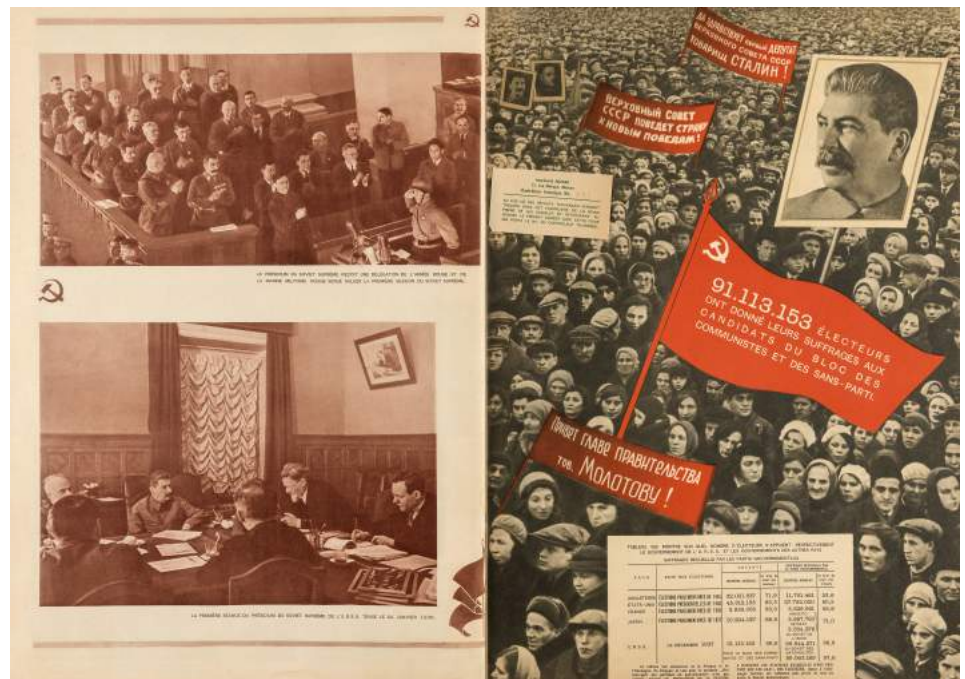
ALEXANDER RÓDCHENKO y VÁRVARA STEPÁNOVA. Revista URSS en construcción , 1938. Col. del IVAM

El fotomontaje y la nueva tipografía fueron los recursos plásticos sobre los que el constructivismo sustentó su estrategia de transformación del libro concebido como arquitectura, un objeto mecánico y revolucionario para las masas convertido en poderoso instrumento para la construcción del socialismo.