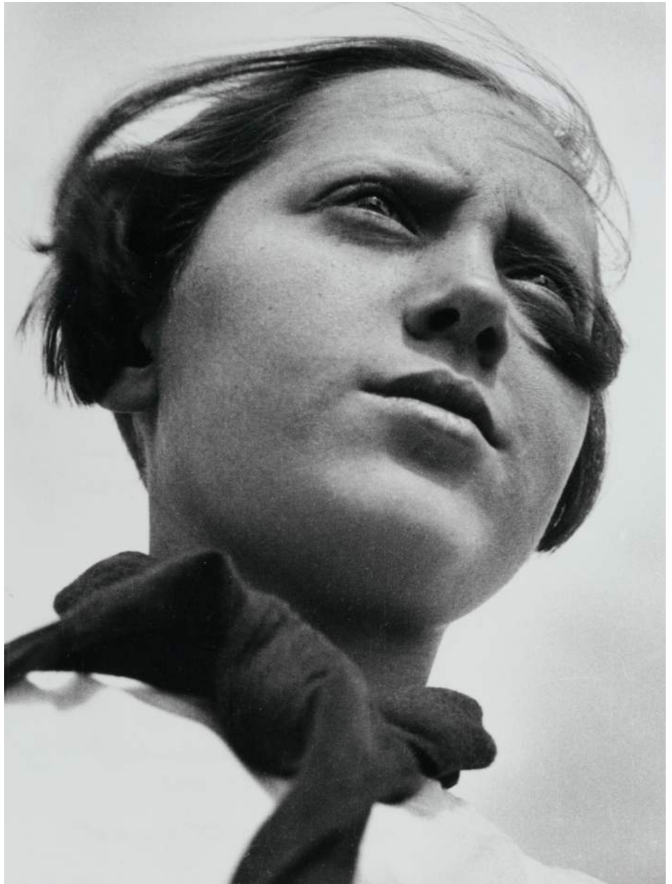
ALEXANDR RÓDCHENKO. Joven pionera, 1930.