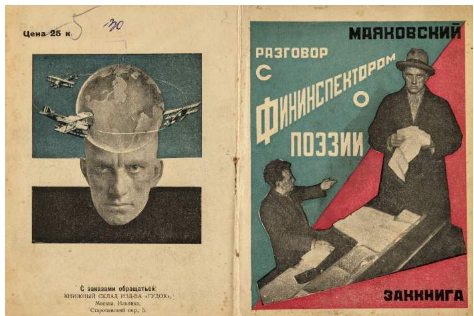
ALEXANDR RÓDCHENKO. Diseño del libro Conversaciones sobre poesía con un inspector fiscal de Mayakovsky , 1926. Col. del IVAM