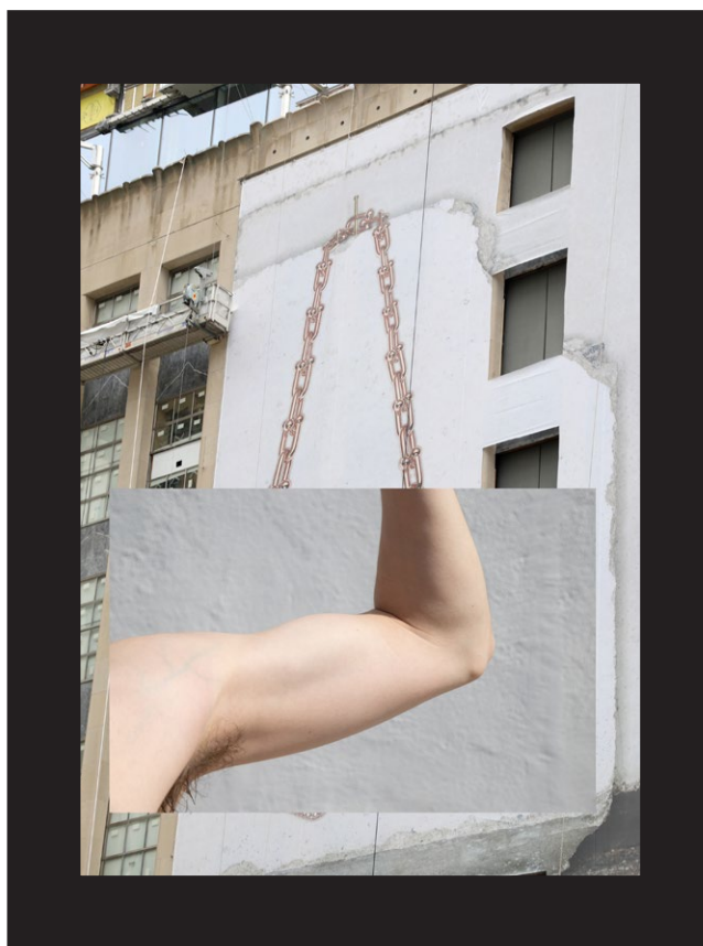
Ximo , 2023. Cortesia de l'artista

Dossier de premsa IVAM Centre Julio González