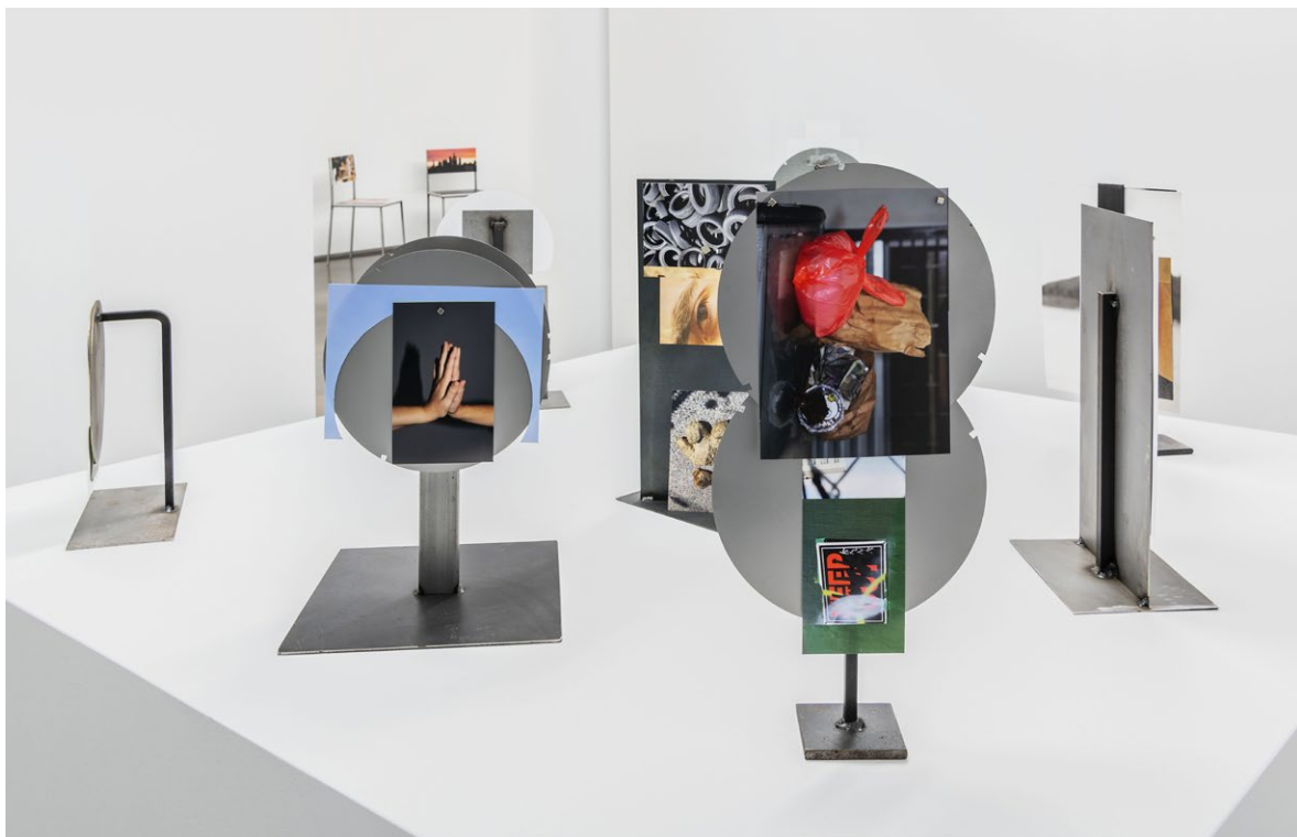
Vista de l'exposició a l'IVAM, 2023