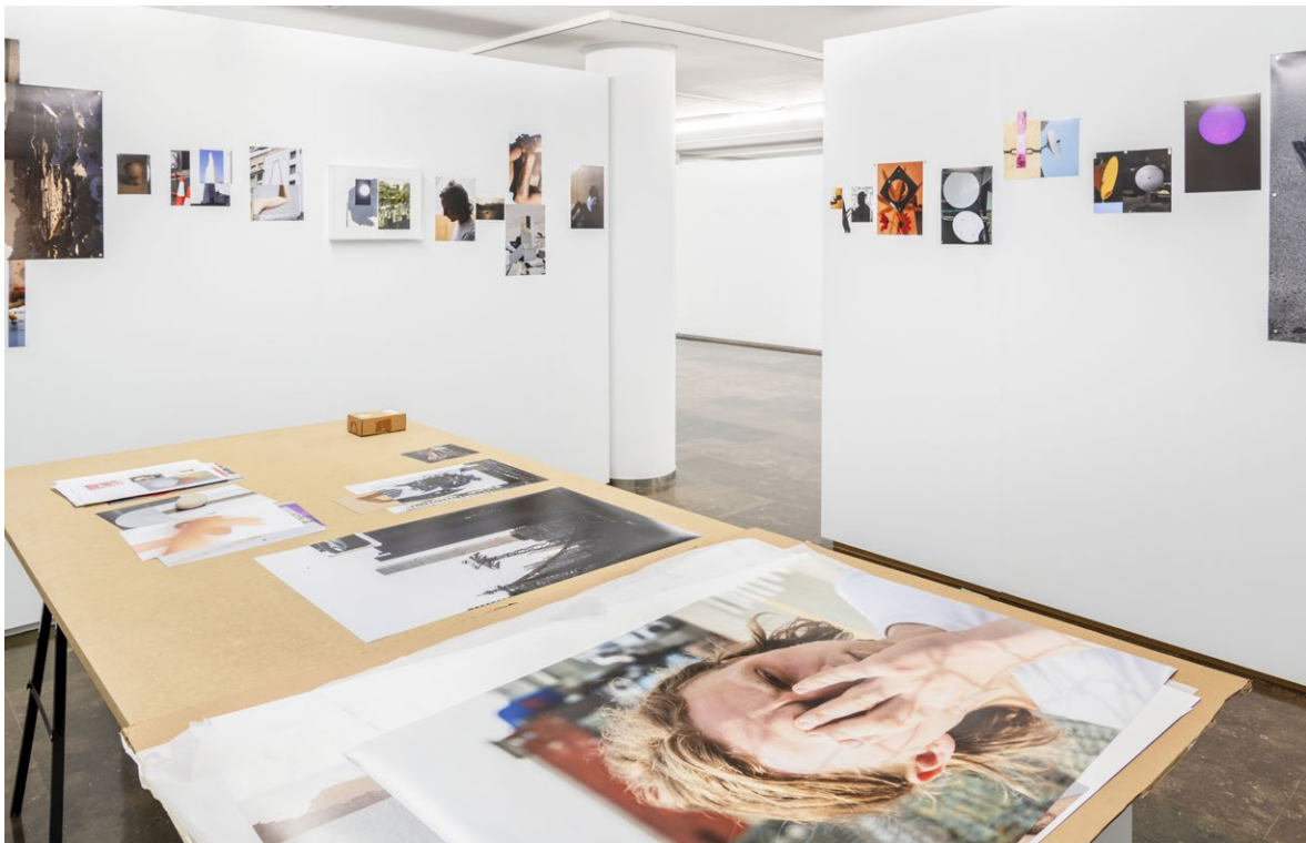
Vista de la exposición en el IVAM, 2023

Las fotografías de Feijóo plantean una discontinuidad, un continuo desplazamiento, un devenir, una constante diferencia. Frente a la imagen única, seriada o tipológica, aparece la imagen múltiple, diversa, mutante, abierta a lo raro, a lo extranjero, a lo queer . En la cuarta sala se muestran fotografías que van un paso más allá —o más hacia dentro— del collage fotográfico, que suponen más bien una mise en abyme resultado de la inclusión de unas imágenes dentro de otras. Algunos dualismos se perciben en su obra, pero no tanto en contraposición, sino en contigüidad, en afinidad. Las imágenes invaden las paredes, sin marco definido: materialidades diversas que unen cuerpos y objetos mostrando una materia compartida; cuerpos blandos en superficies duras o paisajes alterados y residuales.