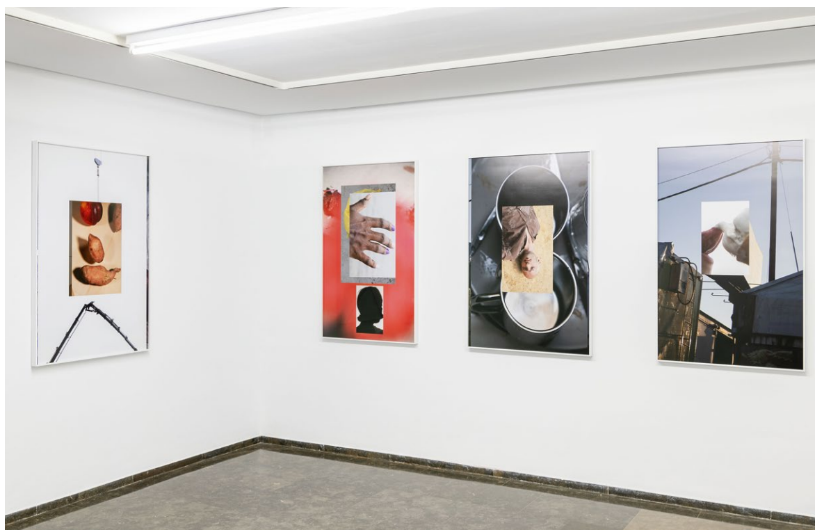
Vista de la exposición en el IVAM, 2023