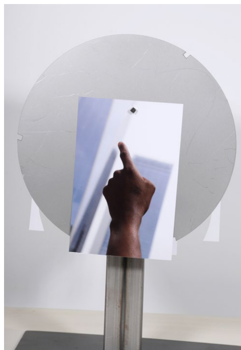
Señal #9 (2) de la serie Trascity, 2023.