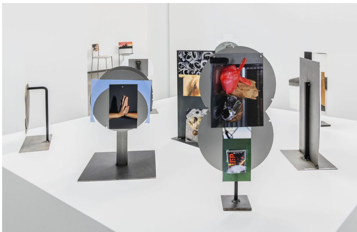
Vista de la exposición en el IVAM, 2023