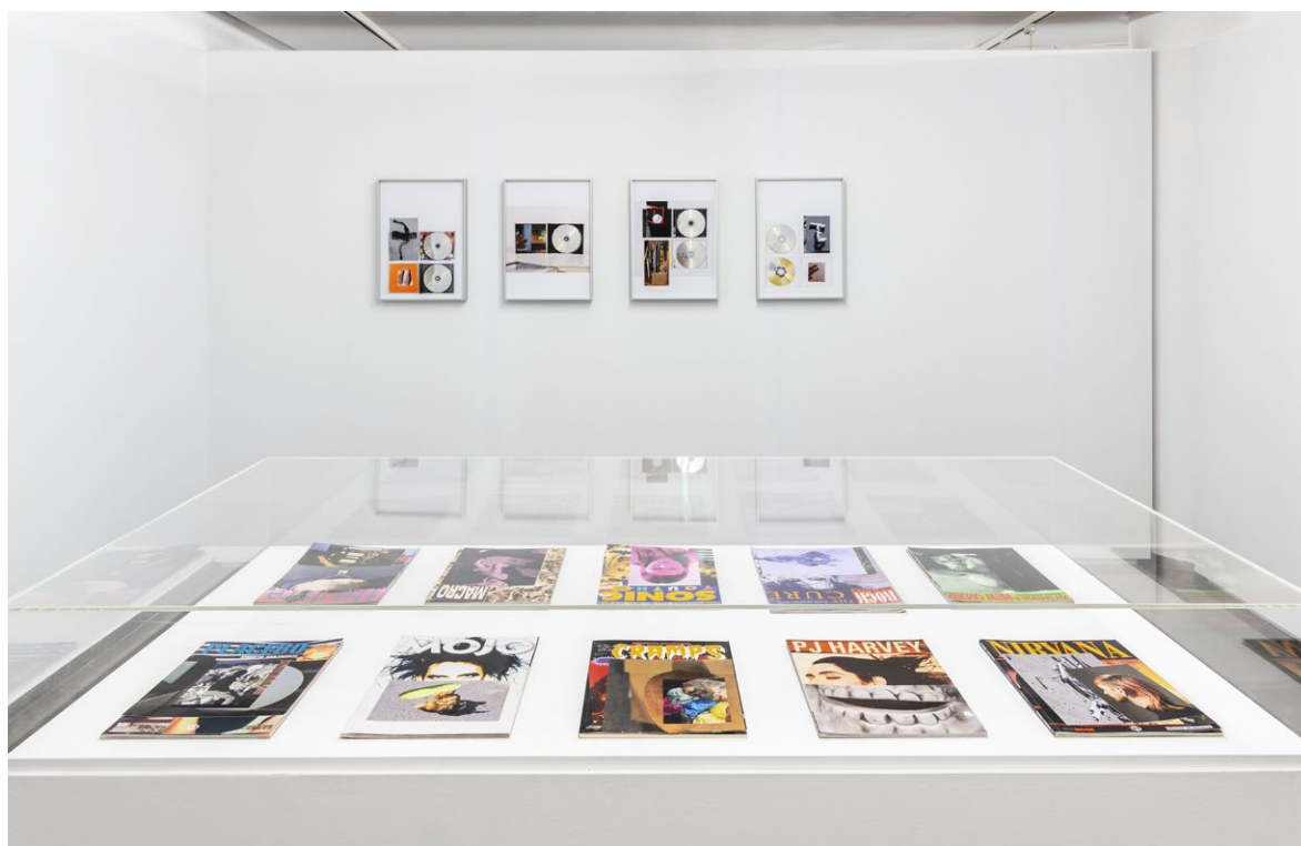
Vista de la exposición en el IVAM, 2023