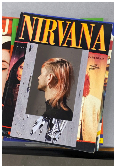
Nirvana - Sebas (detalle), 2023. Cortesía del artista

Artista visual, fotógrafo, aprendiz y acumulador coinciden en el rol del coleccionista, siempre un fetichista de los formatos. A su vez toda colección es un archivo de imágenes propias y ajenas. En esta estancia hay continuas referencias a la música y a cómo abordar una respuesta visual a algo etéreo como es la música. Feijóo construye para ello un gabinete a base de discos, revistas musicales de épocas pasadas y otras referencias; imágenes dispuestas en vitrinas, en las paredes y en los objetos. Un archivo siempre en danza, que muestra unos modos de hacer —de enfrentarse al continuo de imágenes digitales— alejados de taxonomías y clasificaciones, más bien llevando al límite las posibilidades poéticas y conceptuales de la imagen, que se podrá observar en la quinta y última sala.