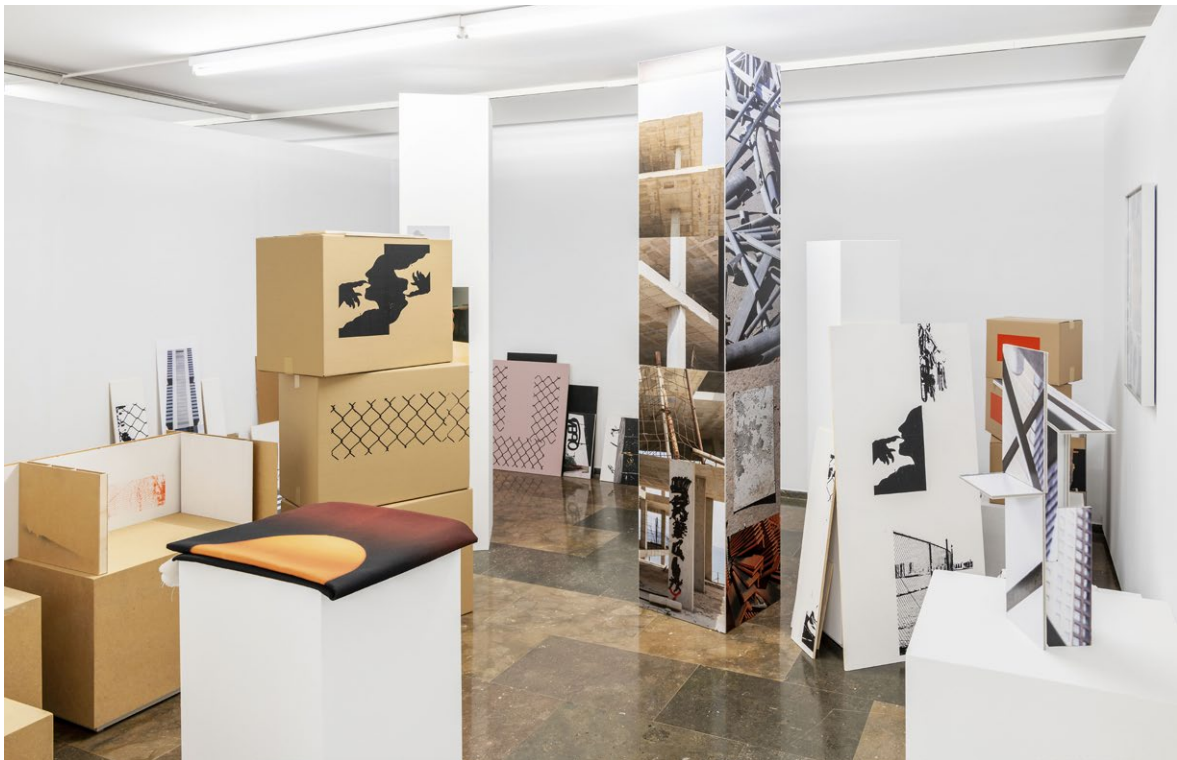
Vista de la exposición en el IVAM, 2023