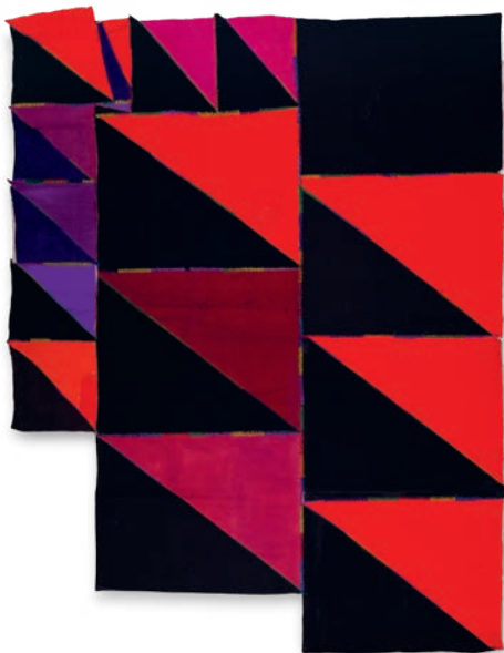
Plaça Reial, 2020