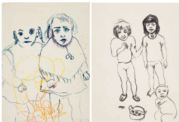
Herodes. Las amigas y Herodes. Los cangrejos, 1992

En la quinta, y última sala, se muestra un conjunto de obras que surgen de las vivencias de la artista en el Raval de Barcelona, el antiguo «barrio chino», en el que vivió entre 1969 y 1985 y al que, décadas más tarde, volvió como profesora de arte de la Escola Massana. Una serie de telas marcadas por los colores rojo y negro se disponen a modo de paredes y nos invitan a adentrarnos en sus calles y a la vez recordar