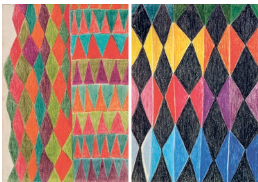
Compenetraciones , 1998 y Sin título, 2 , 1998

así como ritos y labores. Cuenta Lanceta que tejer es un proceso estructural que posibilita la creación simultánea del lenguaje y el objeto. Un código de carácter universal que va desarrollando ideas, incorporando relatos, marcando estados de ánimo, propiciando tiempos íntimos y tiempos colectivos. Un código abierto que la artista hace suyo en un arte ligado a la vida. A diferencia de los intereses de la época, el desarrollo de alfombras como «arte útil» plantea una reflexión ecológica avanzada a su tiempo y abraza la sostenibilidad.