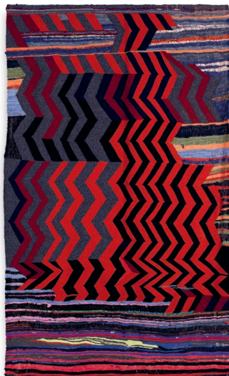
Hospital, 56, 2019

algunos de los lugares en los que residió la artista: Jerusalén 8 (1984), Plaça Reial 13 (1984), Garduña 9 (2000), Hospital 56 (2019) y Obradors 5 (2020). Se escuchan de su propia voz vivencias de un barrio que es un palimpsesto de historias de vida. Historias que le llevaron a trabajar sobre lo roto, las cosas destruidas y los remiendos, como se aprecia en su serie Cosidos .