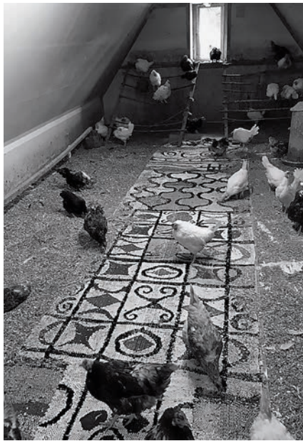
Cuadras/Gallinero en la Bergen Assembly, 2019