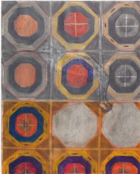
Descendimiento, Albacete- Palencia-USA, 2005