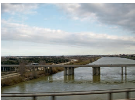
El paso del Ebro, 2013-2015 (detalle)