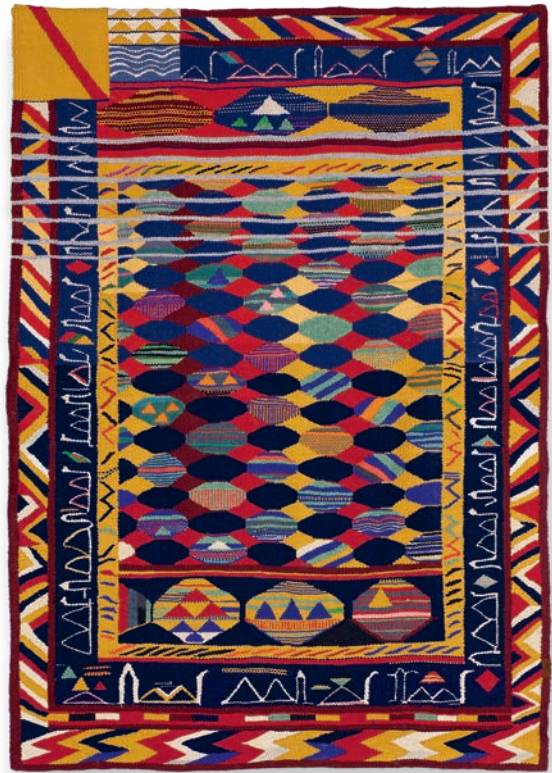
La Orden de la Banda I, 2004

quedaba mermada por el protagonismo de los temas religiosos, como el de Anunciación a la Virgen de Berruguete.