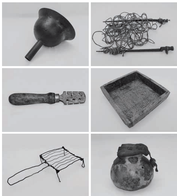
Utensilios de la Guerra Civil de la colección permanente de La Trinxera