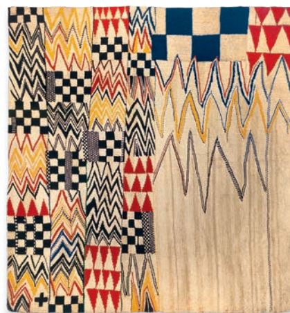
Navajo I, 1990

La exposición no sigue un orden cronológico, sino que propone una aproximación a una serie de proyectos que va hilvanando una narrativa con la intención de fijar la voz de la artista. El punto de partida es una primera sala donde se presentan piezas de gran formato suspendidas, como flotando en el aire, realizadas desde los años setenta hasta la actualidad. A partir de esta introducción la exposición se organiza en cinco salas y su recorrido se ordena a partir de parejas de conceptos, en otro tiempo antagónicos, presentes en la producción de Lanceta: colectividad y autoría, tradicionalmente entendidos desde una visión exacerbada de lo individual; remediación e historia, esto es, la capacidad de negociar pasados todavía presentes que incomodan; performatividad y materia, que sitúan las labores en un espacio de experiencia común de cuerpos y objetos que reconocen el cuidado en el trabajo; y, finalmente, oralidad y biografía, que ponen de manifiesto las enseñanzas feministas según las cuales el arte es una práctica de vida. En este sentido, el trabajo de Lanceta es un trabajo memorable: su potencial crítico reside en su capacidad para construir memoria.