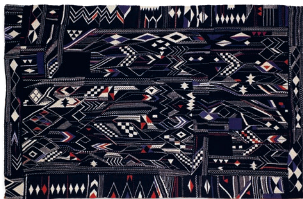
Barcelona - Plaça Reial, 13, 1984

algunos de los lugares en los que residió la artista: Jerusalén 8 (1984), Plaça Reial 13 (1984), Garduña 9 (2000), Hospital 56 (2019) y Obradors 5 (2020). Se escuchan de su propia voz vivencias de un barrio que es un palimpsesto de historias de vida. Historias que le llevaron a trabajar sobre lo roto, las cosas destruidas y los remiendos, como se aprecia en su serie Cosidos .