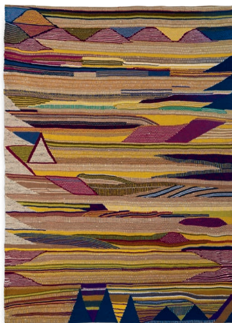
Granada oro, 2002