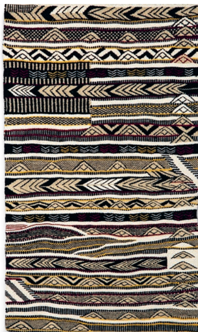
Handira II , 1997