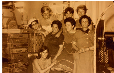
Las cigarreras, 2011/2022 (detalle)