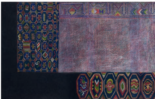
Chinchilla o Hellin, s. XV- Detroit, s. XX, 2004

Otra historia y otra tradición reconoce La alfombra española del siglo XV , que recoge una serie de dibujos realizados con lápices de colores sobre papel negro, así como unas alfombras y cerámicas inspiradas en la esplendorosa industria de ejecución morisca que abastecía los palacios de los grandes señores cristianos en Albacete y Cuenca. En estos, la rica geometría