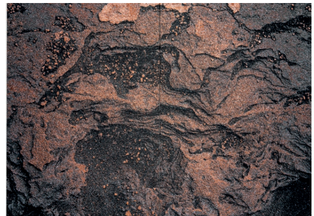
Acer per a oxidar – Fusió , 2016. Cortesia de l'artista

de les seues trobades amb una zona devastada per la mineria a Namíbia coneguda com a «Green Hill» que, des de 1875, ha vist com el seu sòl ric en minerals es buidava, deixant una cicatriu en el paisatge. Maniobres sòlides és una traducció poetitzada de la topografia invertida i excavada de Green Hill —que conté vermiculita, sal, maquillatge, arenes minerals pesades i coure triturat— i serveix de recordatori commovedor de les implicacions ecològiques de l'acumulació capitalista. La grava i la mica de la instal·lació formen un paisatge similar a l'escòria. Els elements escultòrics s'assemblen a illes o paisatges d'arxipèlags i estan compostos per diferents materials que s'han anat superposant per a crear les diverses formacions. El títol evoca el fet que és el cos el que maniobra, transforma i manipula les matèries primeres que extraiem de la naturalesa. Els paisatges naturals es transformen o exploten constantment en funció del que poden aportar-nos. Integrant la performance en l'obra, Nkanga considera com la maquinària utilitzada per a l'extracció d'aquests paisatges es nodreix dels gestos físics del cos humà. Dues obres penjades, Steel to Rust – Meltdown (Acer per a oxidar – Fusió, 2016) i The Rift (La clivella, 2023) al·ludeixen a la corrosió social, econòmica i industrial i a les seues repercussions físiques i emocionals en el cos humà i el medi ambient.