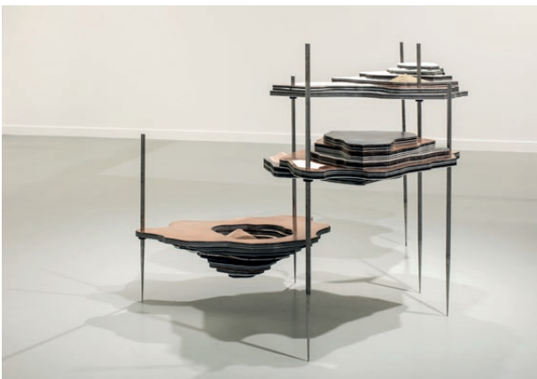
Maniobres sòlides , 2015. Cortesia de l'artista

En l'última sala, la presentació d'Otobong Nkanga se centra en la instal·lació Solid Maneuvers (Maniobres sòlides, 2015), una manifestació