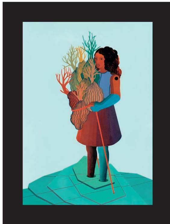
La collita, 2022. De la sèrie Conseqüències socials V.

Dossier de premsa Institut Valencià d'Art Modern