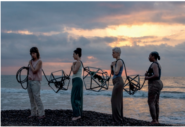
Constellation to Appease , platja del Saler, València, 2023

petjades de la història geològica i social de Cornualla. L'obra continua canviant a mesura que els materials reaccionen i es descomponen. Les formes hexagonals d'acer evoquen les estructures cristal·lines de minerals i sals, i la corda industrial recoberta de cautxú reflecteix la importància de la corda en la navegació industrial de Cornualla.