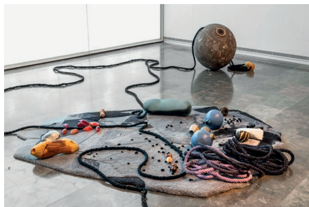
Deixant rastres en la distància , 2021

món amb els seus recursos». Una vegada produït, el sabó s'exposa en forma de xicotetes torres basades en depòsits reals de sabó d'Alep (Síria) i Nablus, ciutat palestina de Cisjordània. Les pastilles de sabó s'han venut a Kassel i altres llocs, i els beneficis s'han destinat a finançar un espai artístic a Atenes (Grècia) i la Fundació Carved to Flow, una organització sense ànim de lucre de Uyo, en l'estat nigerià de Akwa Ibom. Cada pastilla de sabó venuda s'emboïca en paper imprès amb un poema de l'artista, com aquest: