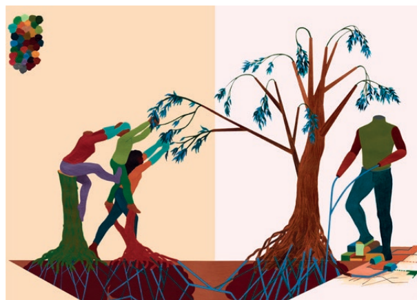
De qui és aquesta crisi? , 2013. Cortesia de Maurice Van Vale

Les narracions paral·leles constitueixen el tema central del tapís monumental Double Plot (Doble trama, 2018) de Nkanga. El tapís plasma diferents perspectives i narra actes que han afectat les terres i a la vida de les persones. El fons representa l'estructura del sistema solar i les formacions estel·lars. Una xarxa de línies a vista d'ocell recorda a les mesures del terreny i les fronteres, a les divisions estructurals que generen tensions. La perspectiva frontal mostra a un home sense cap ni mans que, al costat d'un arbre, subjecta una corda que es vincula a la xarxa de discos de la capa següent. Aquest pla s'acosta a imatges fotogràfiques d'explosions i disturbis —moments de manifestació del poder i moments en els quals la gent és manipulada i controlada per les estructures de poder—, com l'alçament de la plaça Tahrir, que s'alinea amb la constel·lació estel·lar de fons d'aqueix mateix dia. Així doncs, l'home et convida a mirar a dalt, a baix i avant per a descobrir les dobles narratives i connexions. El treball tèxtil també obri una temporalitat, com la llum de les estrelles