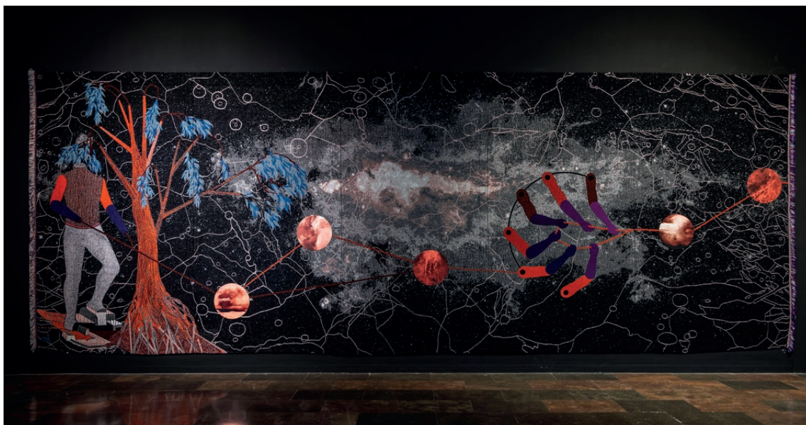
Doble trama , 2018. Cortesia de l'artista

projectada a l'univers molt abans que el seu centellege arribe als nostres ulls, o les situacions d'opressió política que es desenvolupen paral·lelament a escala mundial. Situacions i aparences que van succeir en un moment determinat i es fan visibles en un altre. Els elements representats de cossos, terres i plantes estan literalment entreteixits i connectats i ens recorden que les decisions polítiques tenen repercussions humanes, geològiques i socials.