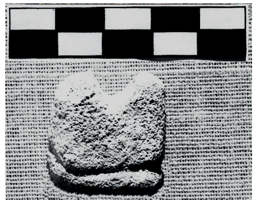
Imagen de proceso d'Álvaro Porras

Álvaro Porras desenvolupa una investigació centrada en els trens de la Sèrie 592 —col·loquialment coneguts com a «camells»— per desplegar diferents línies d'estudi i relacions apofèniques (connexions entre patrons o successos aparentment sense sentit) que plasma a la sala a través de cinc peces en diferents suports. Aquest model de tren, produït a València entre 1981 i 1984, coincidint amb el desgast de les bases militars estatunidenca en el context de la Transició i la conseqüent obertura de la comunitat militar a la societat espanyola (i amb això l'aparició d'un estil de vida relacionat amb l' hip hop ), forma part essencial de l'acostament del grafiti a la «cultura del ferrocarril» en el territori espanyol. Les relacions apofèniques del projecte apareixen en una sèrie de connexions terminològiques i formals, travessades per referències culturals, que permeten reflexionar al voltant dels marges de la visualitat i dels models de representació, des del «camell» a la finestra (història de la mirada occidental), la perspectiva zenital (imatge canònica militar), la direccionalitat (tendència per a la descripció i creació d'un camí) o l'alquímia (registre històricament aplicat a models neoliberals de producció d'espai).