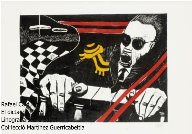
Rafael Carduà El dictador, 1975 Linografía sobre papel Col·lecció Martínez Guerricabeitia