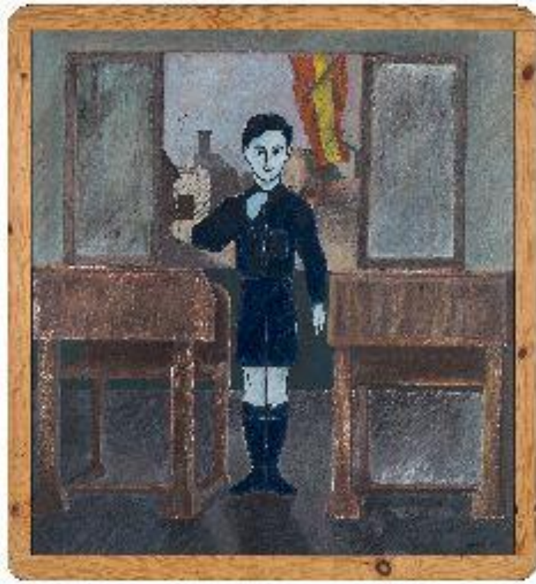
Rafael Martí Quinto 1948, 1974 Técnica mixta sobre tabla Universitat Politècnica de València