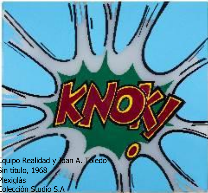
Equipo Realidad y Joan A. Toledo Sin título, 1968 Plexiglás Colección Studio S.A

En Valencia la industria del cómic había tenido un desarrollo excepcional durante el franquismo a través de editoriales como Maga o Editorial Valenciana, esta última promotora de tebeos de gran éxito popular como El guerrero del antifaz o Roberto Alcázar y Pedrín . Este apartado de la exposición analiza el fenómeno de deconstrucción y de apropiación de los códigos del mundo del cómic por parte de la vanguardia figurativa valenciana.