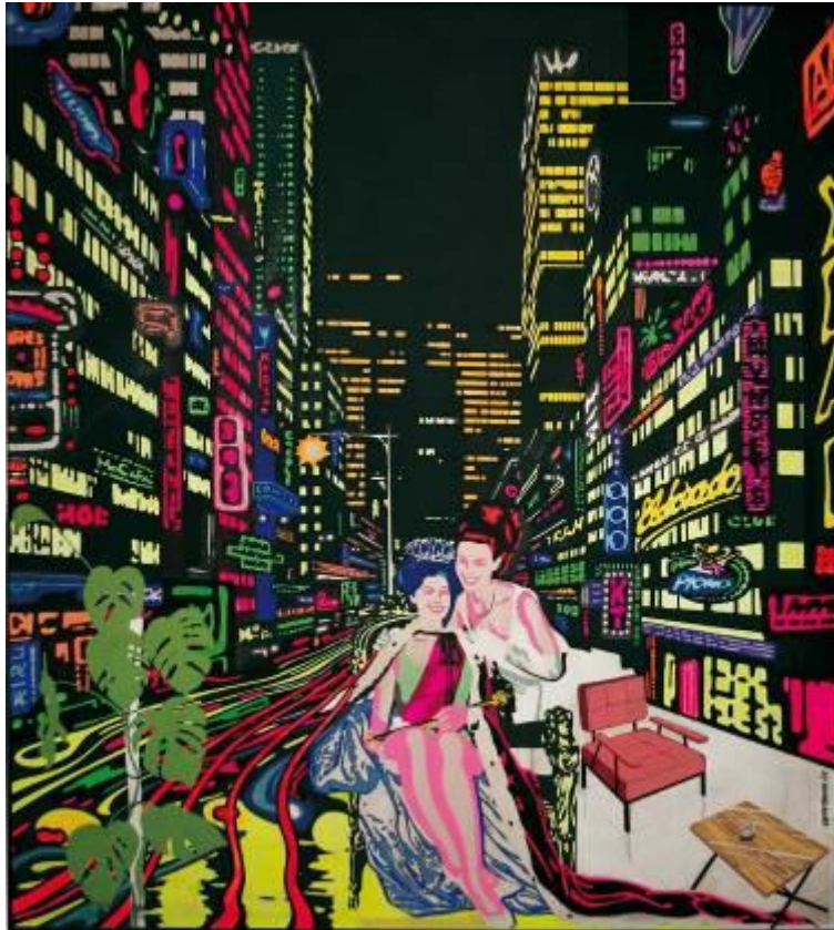
Equipo Realidad Reina por un día II, 1969 Acrílico sobre tabla Colección Ignacio Agraït

Reina por un día fue un programa de televisión estrenado en 1964 por RTVE. Fue ideado para satisfacer, en pantalla y en directo, los sueños estereotipados de confort de la mujer española del momento materializados en forma de viajes vacacionales o de un repertorio de electrodomésticos para el hogar.