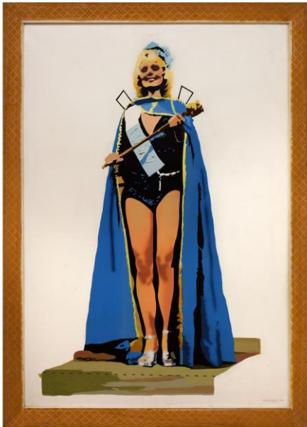
Ángela García Recortable, 1974 Acrílico y aerógrafo Colección particular

En los magazines, en las revistas de moda, en los tebeos, en el cine y en la publicidad, la mujer es sometida a un proceso de