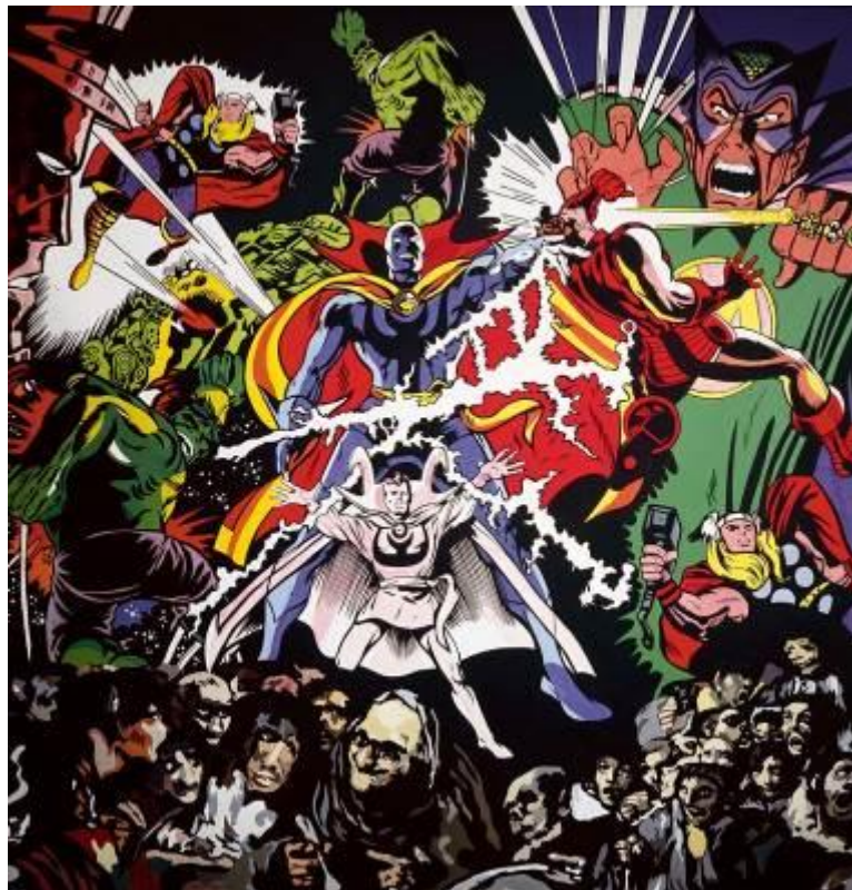
Equipo Crónica Aquelarre 71, Una odisea en el museo (Serie Policía y cultura), 1971 Acrílico sobre lienzo Universitat de València, Col·lecció Martínez Guerricabeitia

En la estrategia, pionera en España, de asimilación crítica por parte de la vanguardia valenciana de las innovaciones impulsadas por el Pop art americano, ocupa un lugar destacado la apropiación de los recursos visuales y narrativos del tebeo .