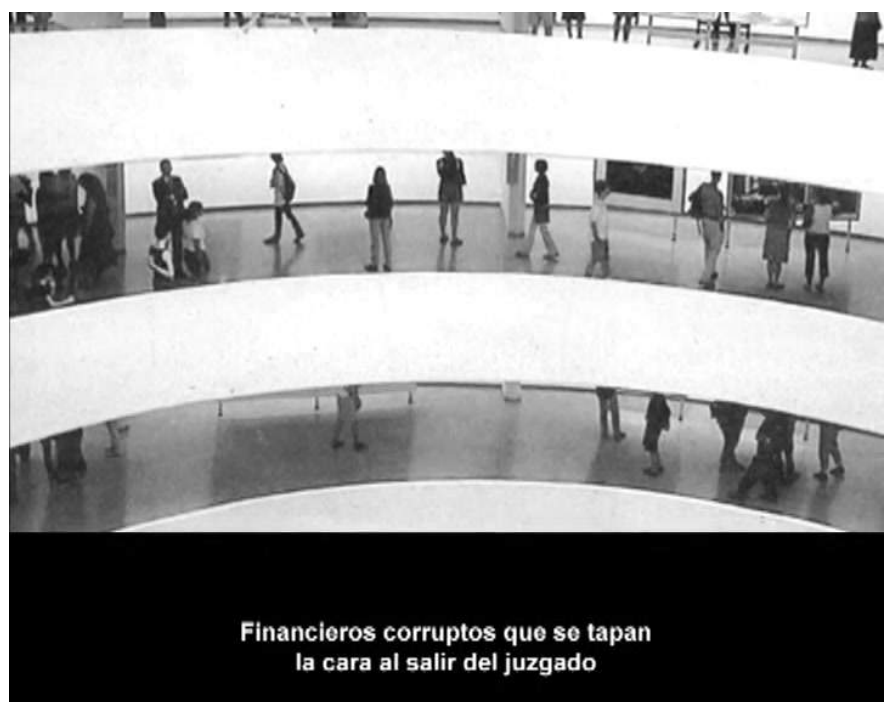
Disparition, 2002. Ignasi Aballí

Y finalmente, la desaparición es la de Perec. El título remite directamente a la novela de Perec La disparition , traducida al castellano como El secuestro . En su caso, a la desaparición que alude el