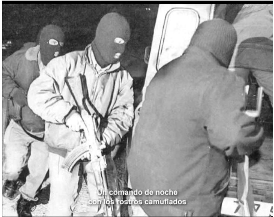
Disparition, 2002. Ignasi Aballí

La mostra també exhibeix el vídeo Disparition (2002) de 180 minuts de projecció en bucle, en el qual totes les imatges en blanc i negre han aparegut en la premsa i mantenen el mateix nexa comú: la desaparició. Sempre hi ha una cara oculta, un rostre vetlat o vetat pel maquillatge, per l'ombra que li envolta o perquè està d'esquena.