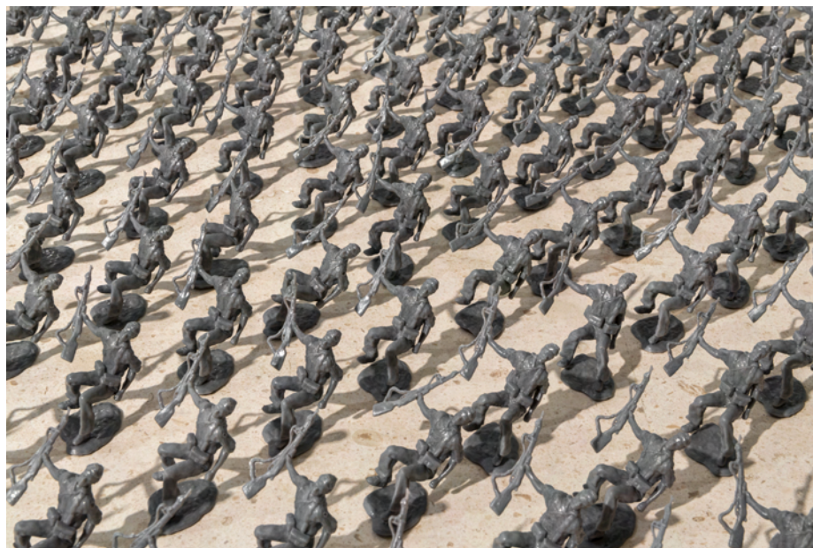
Detalle de la instalación Instrucción , 2019. Fernando Sánchez Castillo