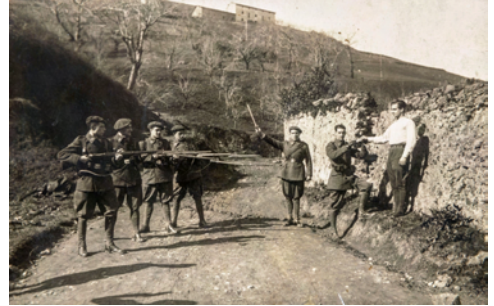
Fotografias anónimas amateur

l'escala, converteix els monuments en joguet, els col·lectivitza i cerca l'intercanvi amb la ciutadania. A mesura que desapareguen les milers d'unitats del soldadets, l'arxiu de memòries, idees i reflexions dels visitants s'anirà ampliant sobre els murs del museu.