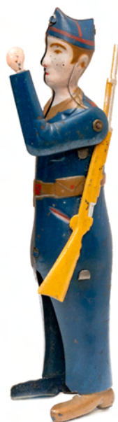
Anónimo, Miliaciano, 1937. Museu del Joguet de Catalunya