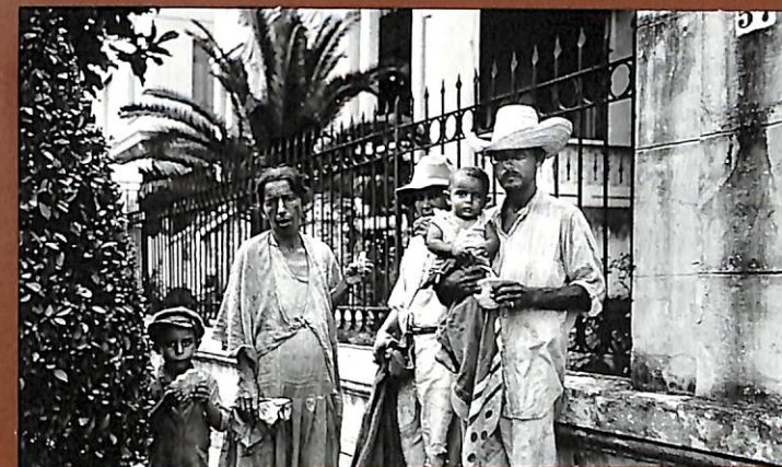
Havana: Country Family.

Fa una setmana que vaig tornar de Cuba i acabe de presentar totes les fotografies. Em pregunte què en pensarà vosté. Lamente molt que ara no estiga vosté amb mi. Gaudiria si pogués contar-li com ho vaig passar. És un lloc meravellós i sent no tornar-hi. Suppose que vosté té permanentment prohibida l'entrada, encara que ¿per ventura no li retrien honors els enemics de Machado? El vell carnisser sembla que estarà en el poder encara durant algun temps. Els seus amics foren un ajut molt valuós per a mi, així com una diversió immensa. La meua estada va durar un mes i vaig eixir molt. Els editors li enviaran sense dubte les còpies de les reproduccions, potser tinga vosté res a dir dels títols. De vegades he sentit certa presumpció per tenir tant a veure amb un treball tan acurat d'altra persona. Vaig fer una selecció que, pel que fa al nombre de les fotografies, l'ordre i els títols, sembla no necessitar cap canvi en absolut, i li he demanat al Sr. Jefferson Jones que ho deixi així. També m'ho he demanat a mi mateix, per-