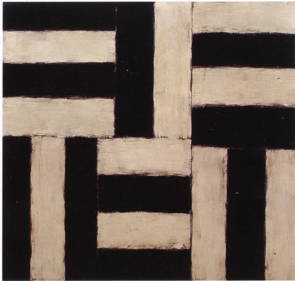
SEAN SCULLY Voice (Voz) , 1993 Óleo sobre lienzo, 201,6 x 213,3 cm IVAM Institut Valencià d'Art Modern, Generalitat

La exposición Entre bambalinas... arte y moda se enmarca en el proyecto cultural Viva Valencia . Revisa el diálogo que surge entre la moda y el arte contemporáneo que activa una lectura comparativa en sus procesos creativos. Parece claro que ambas disciplinas comparten sensibilidades, códigos de lectura e influencia social convergentes, dado que las fronteras entre ambas están cada vez más difuminadas, en una sociedad donde las referencias cruzadas son una constante entre todos los lenguajes artísticos.