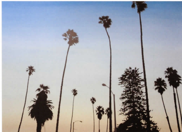
GLEN RUBSAMEN If we can't have spots where no man has ever been, at least we can have spots where no man is at the moment (Si no podemos tener puntos donde nadie haya estado, al menos podemos tener puntos donde ahora no hay nadie), 2005

Antonio de Pascale y Sandra Gamarra embalan la noción de paisaje de manera menos directa. De Pascale utiliza tabletas de chocolate cuyos ingredientes se convierten en causantes de desastres naturales, y Gamarra reproduce páginas de libros de culto del mercado del arte cuyas hojas se convierten en topografías.