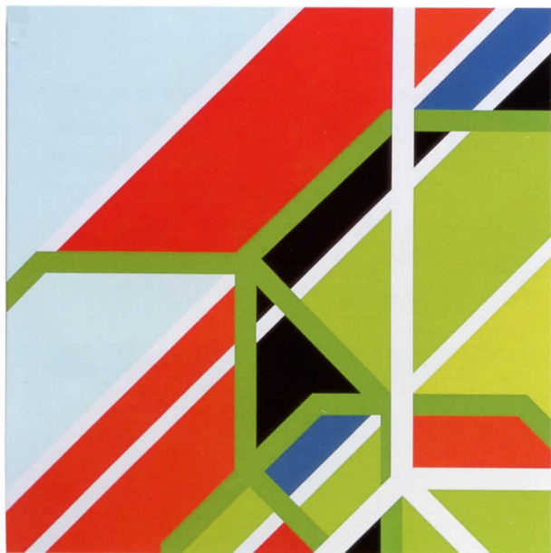
SARAH MORRIS Sony (Los Angeles) , 2004

Para muchos artistas de la colección como Torben Giehler, Paul Morrison, Melanie Smith, Jean-Marc Bustamante, Eugenio Dittborn o Peter Zimmermann el vídeo, el ordenador y la manipulación digital son parte integral de sus cuadros. Otros, que además son cineastas, no pueden separar su obra pictórica