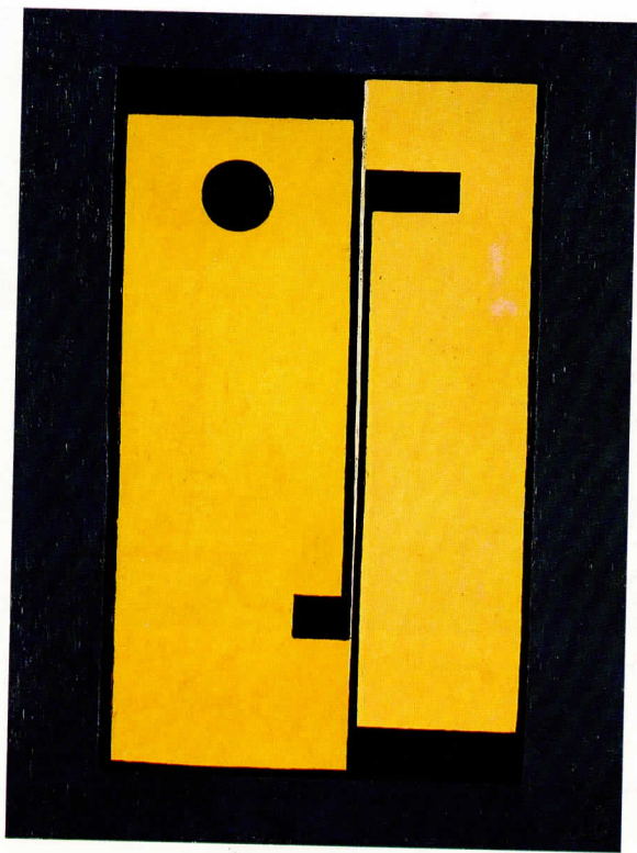
Pastor Pla, Composició (Tons grisos, ocre i negres) , 1957

pel realisme, en especial en la seua faceta expressionista. Després de la contesa bèl·lica, potser per les circumstàncies vitals determinades pel moment polític, les experiències renovadores es mantingueren en letargia fins la dècada dels anys cinquanta. No seria fins els intents dels grups Los Siete i Parpalló, quan s'inicié la recuperació dels llenguatges moderns.