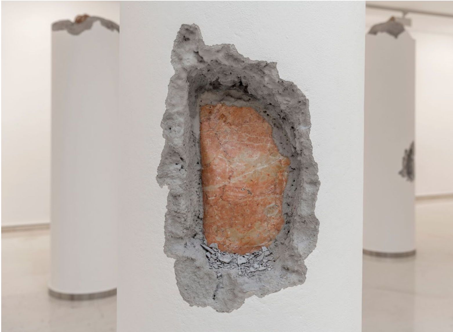
Un ejercicio de violencia. Guillermo Ros, IVAM. 2021.