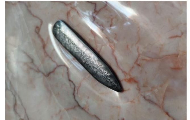
Un ejercicio de violencia. Guillermo Ros, IVAM. Proceso de producción, 2021.