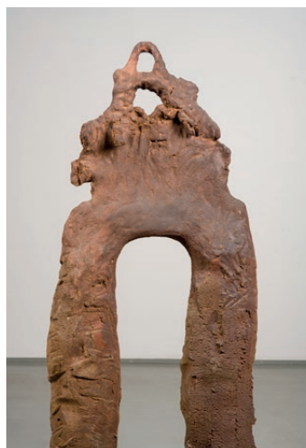
Simone Fattal, Zbat El Himma , 2006.

A través de mitjans com l'escultura, la pintura i la fotografia, Fattal explora els límits de la figuració inspirant-se en figures històriques del Mediterrani, creant una cosmogonia de cossos i arquitectures resistents. Les seues escultures de bronze, argila o gres, evocuen la literatura, contes sumaris, èpica àrab i poesia sufí. Àngels, centaures, herois i deus es mesclen amb ruïnes arquitectòniques i figures de fruites i animals que fan referència a la pèrdua de llocs