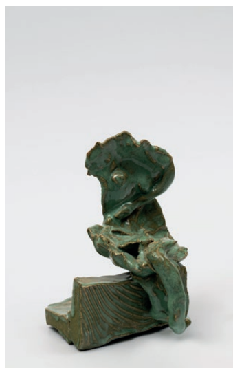
Simone Fattal, Woman on a rock , 2009. Cortesia de l'artista