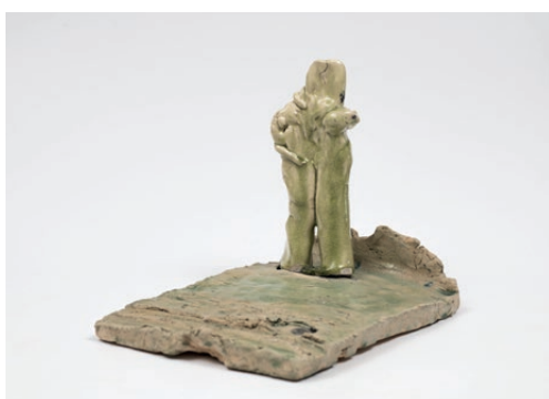
Simone Fattal, Man on the Moon , 2003. Cortesia de l'artista

L'exposició Suspensió de la incredulitat és la primera exposició de l'artista a Espanya i reuneix 85 obres que comprenen un arc temporal des del 1999 al 2023. La pràctica multidisciplinària