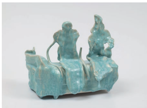
Simone Fattal, Mermaids , 2004. Cortesia de l'artista

de Simone Fattal concep el temps com una entitat elàstica que va més enllà de les distincions entre el passat, el present i el futur. La seua obra es nodreix de la mitologia, passant des de l'antic Egipte fins al misticisme sunní i la tradició grecoromana, creant figures arquetípiques que integren narratives històriques al present.