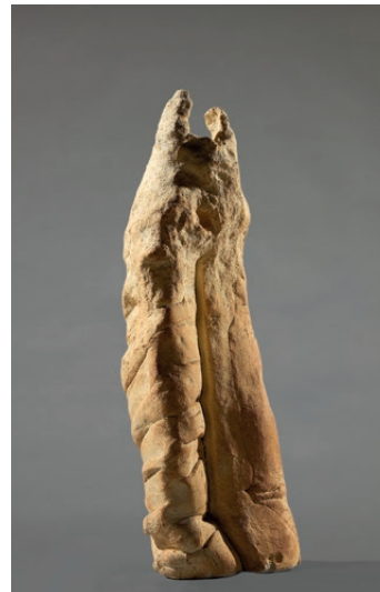
Simone Fattal, Visitation II , 2008.

de Beirut. Va ser en esta etapa, al 1971, que va començar la producció de la seua pel·lícula Autoportrait , finalitzada l'any 2013. Al 1973 va realitzar la seua primera exposició individual en la Gallery One de Beirut.