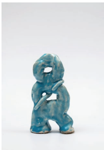
Simone Fattal, Youth , 2005.