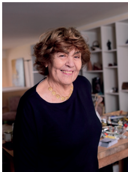
Simone Fattal.

A més, va ser guardonada amb prestigiosos premis, com el Gran Premi d'Art de Berlín i el Premi Internacional Julio González l'any 2024, mostrant d'aquesta manera el gran reconeixement que ha aconseguit en la comunitat artística internacional. Les seues obres formen part de importants col·leccions públiques i privades, incloent el Centre Pompidou a París, el Walker Art Center a Minneapolis i el Museu Nacional de Qatar a Doha, entre altres.