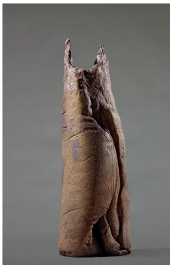
Simone Fattal, Visitation I , 2008. Cortesia de l'artista

Quan va acabar els seus estudis a París l'any 1969, Fattal va tornar a Beirut i va començar la seua trajectòria artística de manera autodidacta, dedicant-se a la pintura. Les seues primeres obres es caracteritzen pels paisatges abstractes i colorits, que recorden llocs emblemàtics del Líban, com el Mont Sannine i el passeig marítim