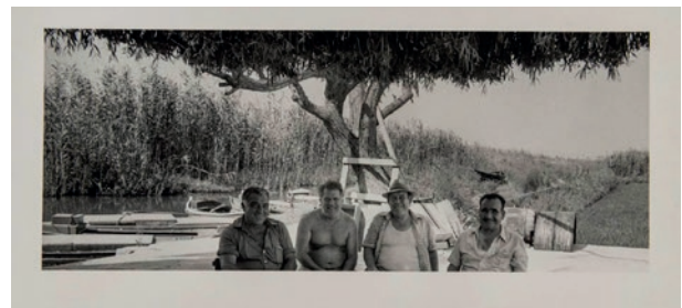
Gabriel Cualladó. L'Albufera , València, 1985. IVAM Institut Valencià d'Art Modern, Generalitat. Donació de l'artista