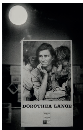
Gabriel Cualladó, Real Sociedad Fotográfica , Madrid, 1979-1982. IVAM Institut Valencià d'Art Modern

En aquestes fotografies destaca la inclusió d'una imatge dins d'una altra, com per exemple la que mostra el cartell de Dorothea Lange —una de les obres més representatives de la fotografia documental estatunidenca dels anys trenta— i que, a més, va ser la primera artista de qui va adquirir, ja als anys setanta, una obra per a la seua col·lecció.