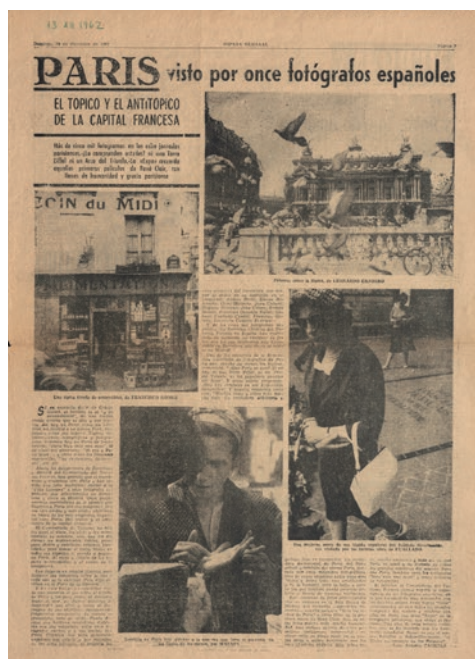
«París visto por once fotógrafos españoles», España Semanal, 1962.