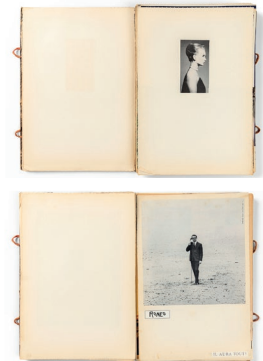
Gabriel Cualladó, Carpeta de retalls i fotomuntatges , ca. 1960-1970. Biblioteca i Centre de documentació IVAM, Generalitat

Les seues polaroids mostren motius que escapen a allò que coneguem com Cualladó. Moltes plantes i flors del seu jardí, retrats en els que trobem dificultat per reconèixer la cara, fotografies mogudes o borroses, naturaleses mortes inquietants, etc. Són fotografies que mostren un treball que va evolucionant d'acord a les condicions personals en les que es troba cap al final de la seua carrera (mor a 2003), i que reflecteix el seu entorn