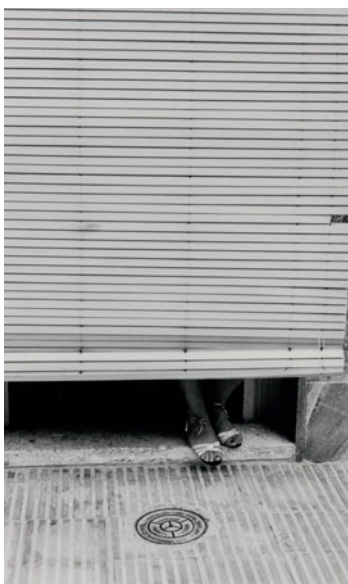
Gabriel Cualladó, Sin título , Gandia, 1990. IVAM Institut Valencià d'Art Modern, Generalitat. Donació de l'artista

fotografies que recullen, en paraules del fotògraf, «la intimitat de cases particulars, en petits tallers o indústries, en les feines del camp [...]». Cualladó justifica amb estes paraules la seua selecció final d'una manera evident, deixant fora, entre altres, dos retrats que no mostraven aquella realitat tan costumista que s'ha vinculat amb la identitat del poble i les terres valencianes, com per exemple Actor del grupo de teatro 'La Plutja' (Actor del grup de teatre 'La Plutja') de Gandia o Sin título, retrat (Sense títol, retrat). A la vegada, en aquesta sèrie destaca la divisió que fa entre l'espai domèstic habitat per dones i l'espai de l'horta i laboral ocupat pels homes, una tàctica que ja havia utilitzat en 1985 a la sèrie L'Albufera. Visió Tangencial .