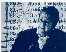
La tierra madre. José Antonio Hergueta/ Marcelo Expósito, 1993-94