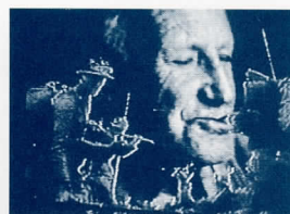
Señuelo. Jaime Subirana/Gringos, 1991

Cubierta: Uomo Blue . Carlos Gil-Roig, 1993