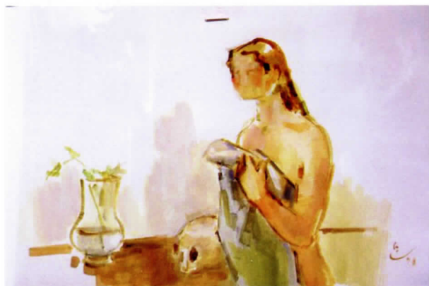
La Magdalena cubriéndose, 1998. Gouache sobre papel, 45 x 59 cm

producir una serie de reconocimientos públicos e institucionales que culminarán con la concesión del primer premio "Velázquez" en 2002.