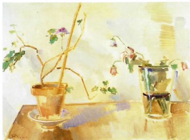
Homenaje a Chu Ta, 1992. Óleo sobre lienzo, 70 x 90 cm