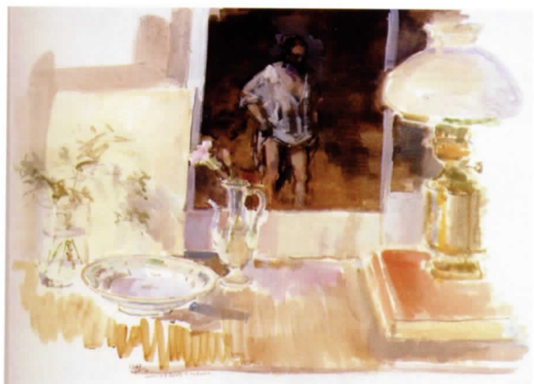
Homenaje a la bañista de Rembrandt, 1990. Gouache sobre papel, 57 x 79 cm

son "homenajes", es decir encuentros de Ramón Gaya con los pintores que más admira en el escenario del lienzo o del papel. Un recorrido asistemático por las obras de una serie de pintores, dispares en su procedencia geográfica, alejados en el tiempo, distintos en su apariencia formal pero todos ellos poseedores de una gran fuerza creativa y con los que siempre encuentra un rincón para conversar.