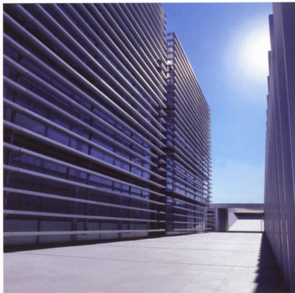
Centro de Investigación Príncipe Felipe, Valencia