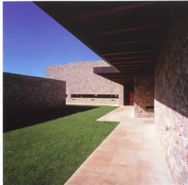
Vivienda en Desnivel, Valencia