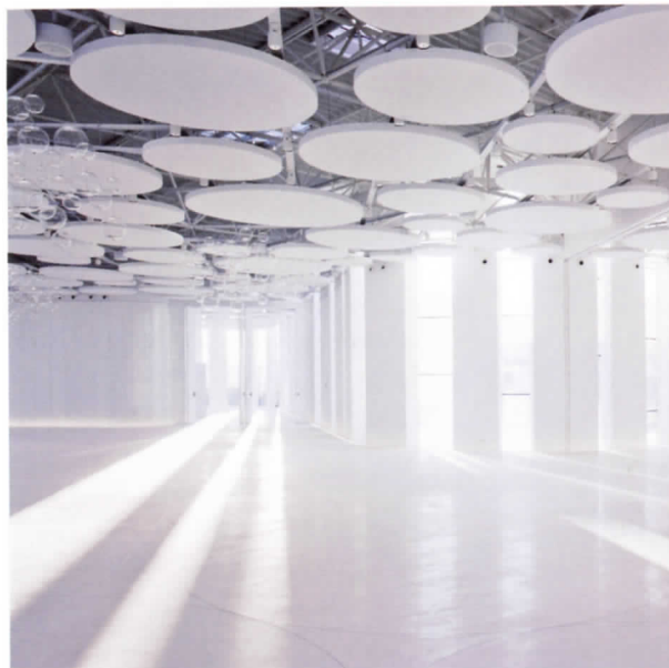
Interior del Centro de convenciones Myrtus, Valencia

con una presentación del arquitecto y diseñador, y con un resumen cronológico de veinte años de trayectoria. Arquitectura, que nos sumerge en el universo creativo y formal como arquitecto de Esteve: Paneles, fotografías, maquetas, textos, planos y bocetos nos acercan al lenguaje visual presente en los edificios públicos y las viviendas particulares desarrolladas por su estudio. Diseño, por su parte, muestra algunos de los muebles más destacados de la trayectoria de este multidisciplinar artista. Y, finalmente, un último bloque, Concursos, está planteado como una aproximación a los más recientes proyectos abordados por su estudio, presentados en forma de proyecciones de vídeo y maquetas.