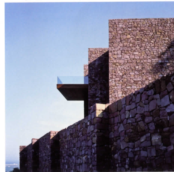
Casa Paz y Comedias

Frente al gesto y el espectáculo, Ramón Esteve nos reconcilia con la arquitectura eficiente, no por ello carente de poética, utilizando materiales cercanos como la piedra rodado en su conocida casa Paz y Comedias en Montepicayo, o relejendo la herencia de las construcciones populares cúbicas de Ibiza en la ya afamada vivienda Na Xemena, con su lámina de agua que se pierde en el horizonte del mar. Fue en esta última casa donde, tal como explica el arquitecto, comenzó el diseño de interiores y muebles: "Aquí está diseñado absolutamente todo, para que todas las piezas cuenten la misma historia". Así pues, el mobiliario surge como desarrollo y complemento de su arquitectura, dando lugar a colecciones vanguardistas y mediterráneas de gran éxito como las de Gandía Blasco, Vondom, Vibia o De Castelli. Su capacidad para crear espacios coherentes con el entorno ha llevado a Ramón Esteve a desarrollar, incluso, una imaginativa propuesta