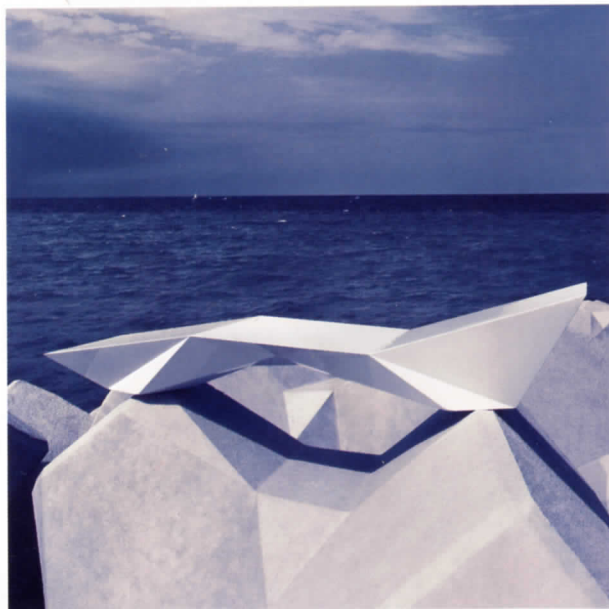
Tumbona Faz, Vondom

La presente exposición monográfica que le dedica el IVAM Institut Valencià d'Art Modern, está organizada en cuatro grandes áreas: Estudio, donde se ubica al visitante en el tiempo y el espacio de la exposición