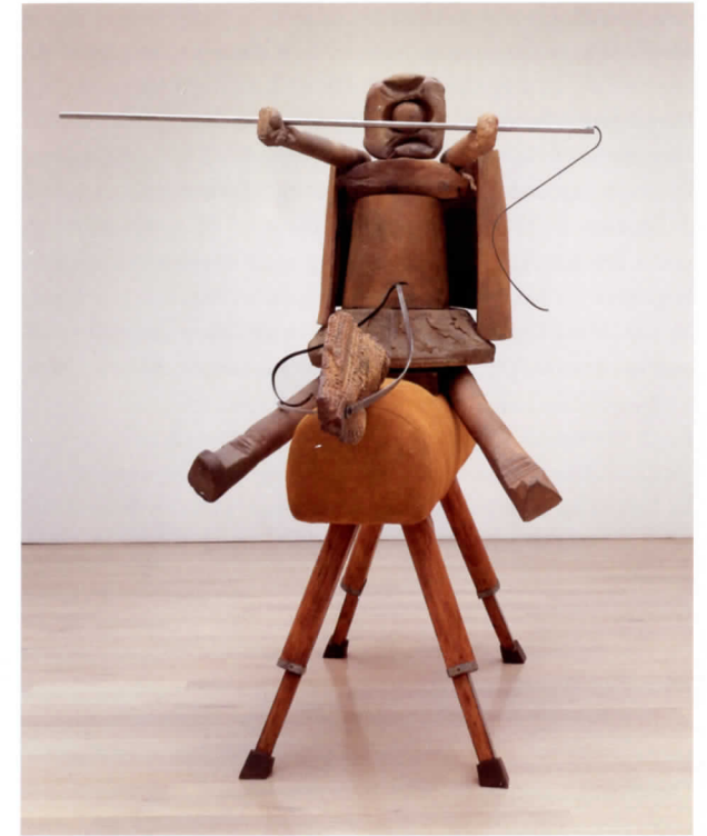
Sulde (esperit o símbol o emblema), 1999-2002

Caro treballa habitualment amb acer, però també utilitza una gamma diversa de materials: el bronze, la plata, el plom, la ceràmica, la fusta, la terracota o el paper. Sempre ha despertat la seua curiositat treballar amb els materials menys usats en la seua escultura. Els inclou, els combina, els acobla i li influencien intensament en el seu procés creatiu.