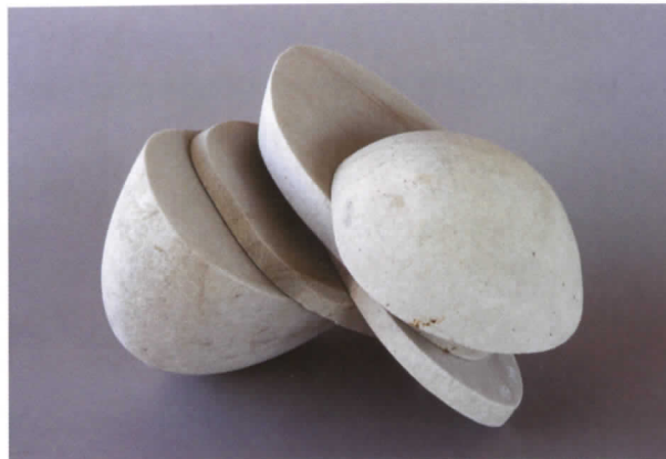
Alberto Bañuelos Balón I (Opus 552) , 2008

INSTITUT VALENCIÀ D'ART MODERN 5 MARZO - 6 ABRIL 2008