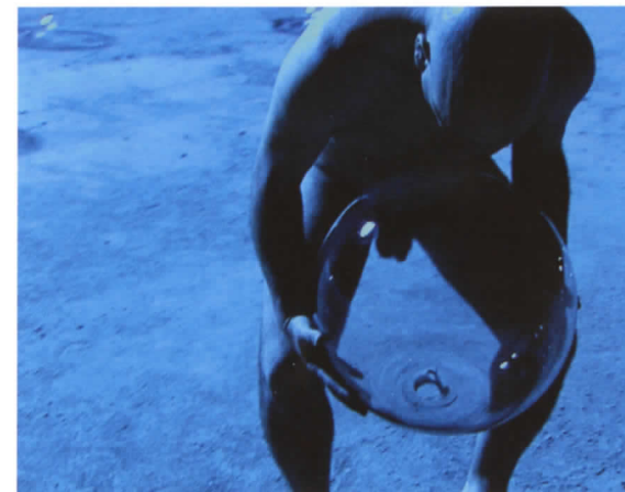
Javier Pérez Fotograma de Un universo a medida (Métrica mundis) , 2002

“Adherirse al ideal de una vida más elevada, para buscar su perfección; representar a una elite cuyo origen fuera totalmente igualitario, y de la que se hubiera destacado mediante cualidades morales; crear una tregua de paz en el mundo cada cuatro años, como si fuera una primavera del hombre; y glorificar la belleza, por involucrar lo mejor de la filosofía y las artes humanas en los Juegos Olímpicos”. Son estos algunos de los sólidos preceptos que definió Pierre de Coubertin para el movimiento olímpico en