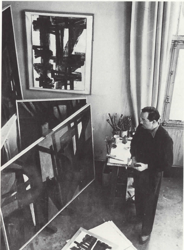
Atelier Rue Schoelcher Paris 1950

In der Ausstellung wird ein Videofilm über Pierre Soulages gezeigt.