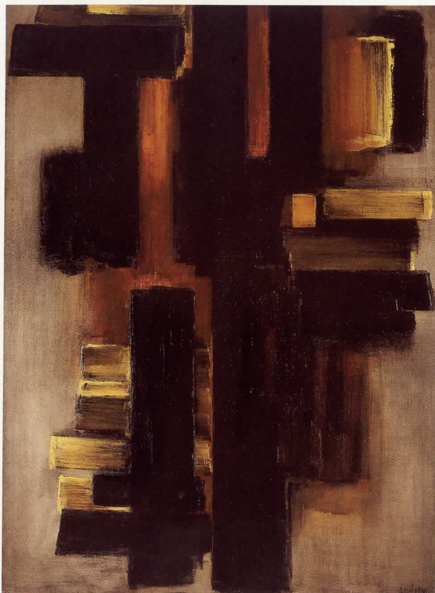
Peinture, 195 x 130 cm, 29 Juin 1953 hulle sur tolle

Die Ausstellung wurde mit Unterstützung der Association Française d'Action Artistique – Ministère des Affaires Étrangères – Secrétariat d'État aux Relations Culturelles Internationales, Paris, realisiert.