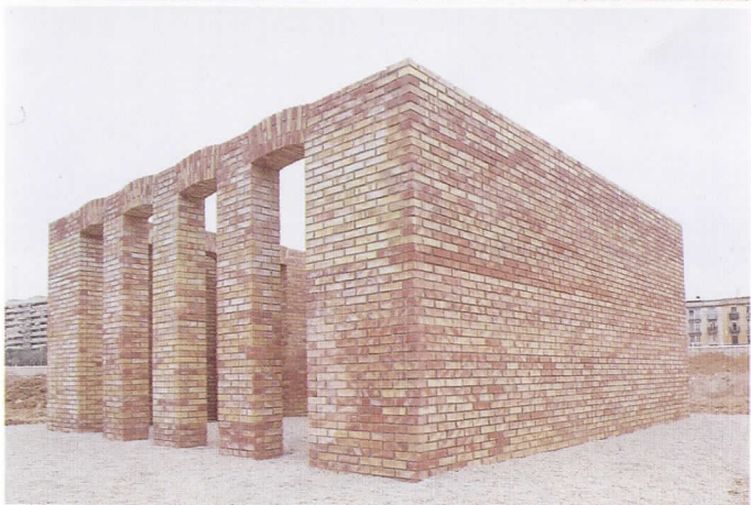
València, 1989 Ladrillo de barro hecho a mano 300 × 736 × 736 cm.