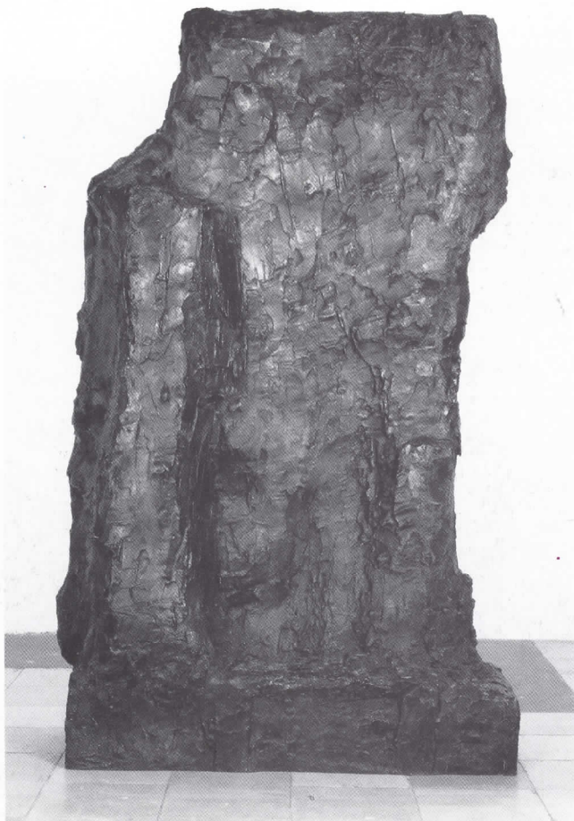
Torso I , 1983 Bronce, 201 × 130 × 58 cm. Galería Michael Werner, Colonia