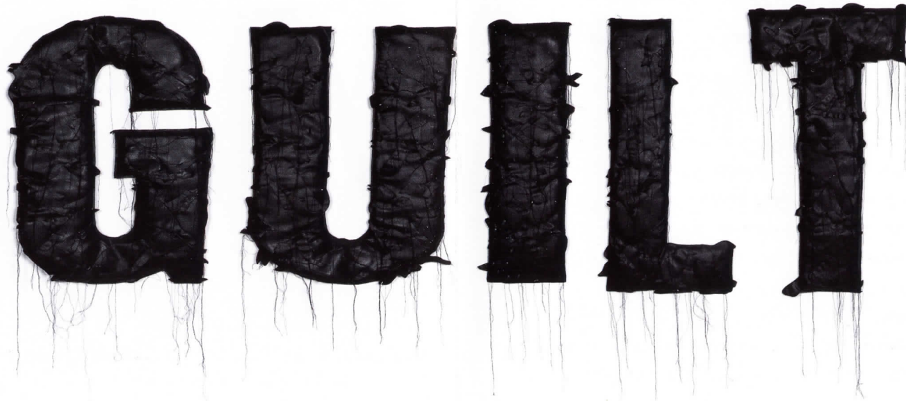
Guilt (Culpabilidad), 2006. Colección particular, Lisboa

"Esta enorme colección de objetos (Pedro Valdez es un artista extremadamente prolífico) explora temas de la vida cotidiana contemporánea, historia del arte y del pensamiento social y ficción literaria, arreglándose como un universo visual en expansión, una especie de lista de posibilidades para una realidad narrativa paralela de una naturaleza completamente escénica y teatral, donde la mayoría de estos objetos podrían ser utilizados como atrezzo de escena.