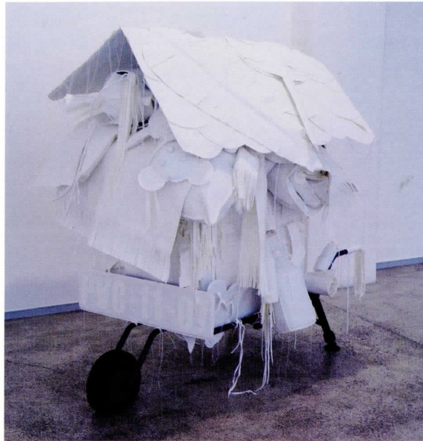
No man's land (Tierra de nadie), 2002-2007. Colección particular, Lisboa