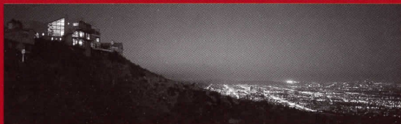
Casa Miller, Hollywood, USA, 1988

Arquitecto y urbanista ha vivido dejando huella por todo el mundo. Ha construido edificios en Tokyo, Nueva York, Boston, Los Angeles, Moscú, Riyadh, Beirut, Libia y naturalmente en Italia. Profesor asociado en la Universidad de Columbia en Nueva York (1970/1974), y profesor titular en la Facultad de Ingeniería de Pisa (2004/2010). Senador de la República italiana (1994/1997). Director del Instituto Italiano de Cultura en Nueva York (2000/2003) y también escritor, fotógrafo y autor de varios libros de arquitectura y viajes.