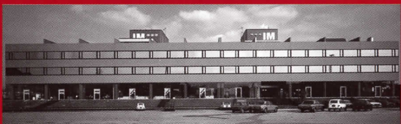
Centro Italmaco I, Viareggio, Italia 1978-81