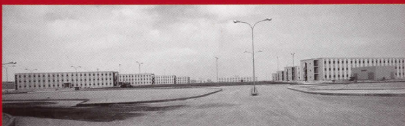
Ciudad de nueva planta en el Desierto de Libia, 1978-81