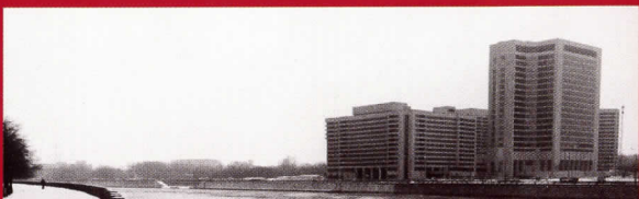
World Trade Center, Moscú, Rusia, 1975-80