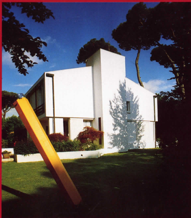
Casa Torre del Lago Puccini, Viareggio, Italia, 1963-1965

La investigación paciente de la época de formación universitaria y sus primeros proyectos, luego la experimentación y la renuncia, siempre el riesgo, siempre un cierto desencanto, y la exploración continua – permanente- del lugar en su más amplio sentido, del lugar