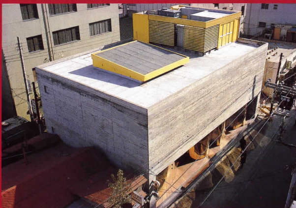
Caesar's Palace, Tokio, 1969

La investigación paciente de la época de formación universitaria y sus primeros proyectos, luego la experimentación y la renuncia, siempre el riesgo, siempre un cierto desencanto, y la exploración continua – permanente- del lugar en su más amplio sentido, del lugar