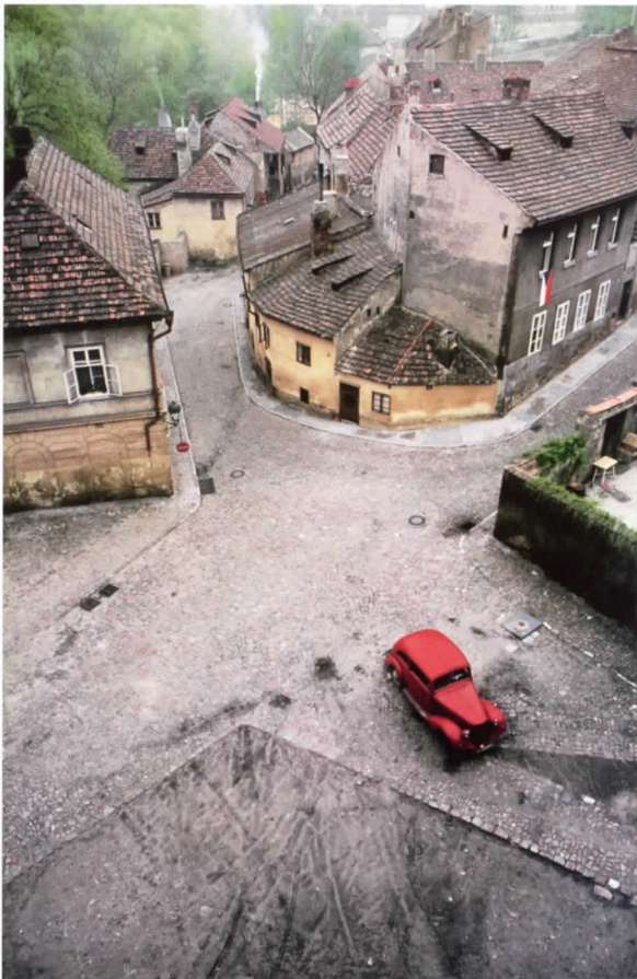
Franco Fontana. Praga , 1967. Donación del artista

denominamos es para tomar conciencia de ellas, pues existe lo que somos capaces de nombrar, y los clichés dan forma a lo que evocan. Así, la visita es un trayecto de varias etapas. Podría ser una cronología relatada, pero preferimos hacer un itinerario poético por su cartografía simbólica. Y así, intrigados por las miradas sagaces de los fotógrafos, cambiamos nuestra forma de ver la ciudad, en busca de la utopía cautiva.