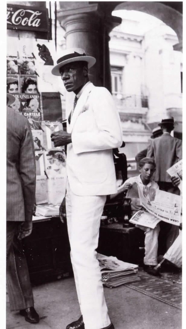
Walker Evans. Havana citizen (de la serie La Habana ), 1933 Donación del Legado de Walker Evans

Hemos organizado este viaje como el joven veneciano relatara al Gran Kan sus expediciones por los dominios del emperador de los Tártaros, en las Ciudades Invisibles de Italo Calvino. Todas las ciudades son la misma, pues de su versión utópica toman los rasgos que la caracterizan. Si las