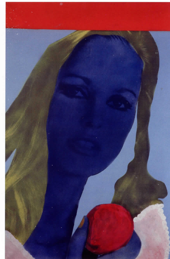
MARTIAL RAYSSE Visage en bleu , 1963

desde los primeros pasos de la abstracción y que ha seguido operativa hasta la actualidad. El momento cenital de esta orientación se produjo tras la segunda guerra mundial, con el expresionismo abstracto americano y otras versiones afines en la Europa de aquellos años, entre las que cabe destacar la del grupo COBRA o la de los pintores informalistas, entre los que algunos españoles tuvieron especial relevancia. Este bloque que se ha denominado "Acción" se centra en la dimensión mática pura y el gesto pictórico en sí. Precisamente, por el natural arraigo de lo español dentro de esta corriente, la colección del IVAM ha hecho particular énfasis en esta pintura de "acción", un término quizás más adecuado para englobar el sentido multiforme de una obra basada en el automatismo.