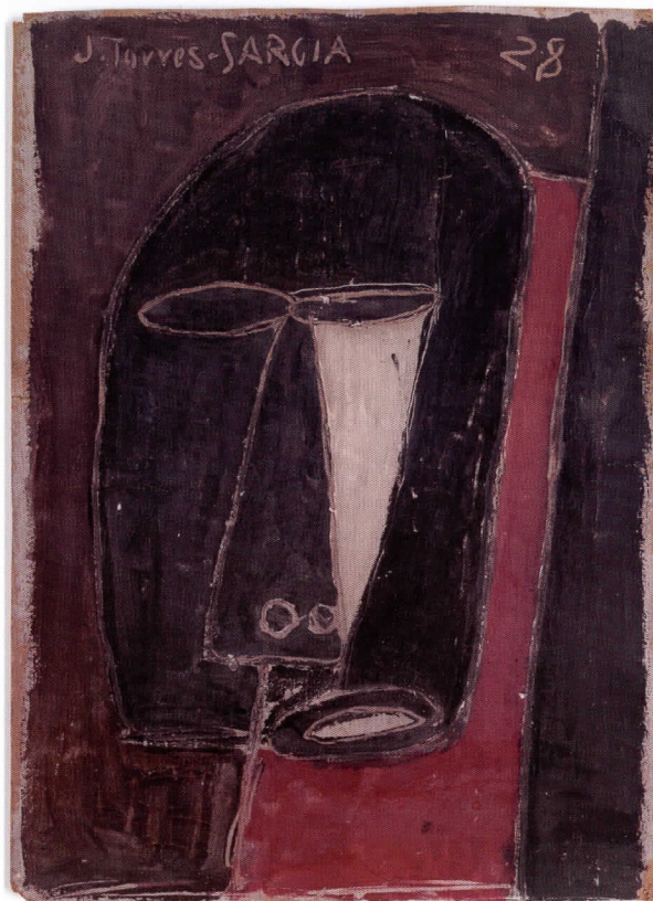
JOAQUÍN TORRES-GARCÍA Masque noir , 1928

INSTITUT VALENCIÀ D'ART MODERN 18 mayo - 4 septiembre 2011