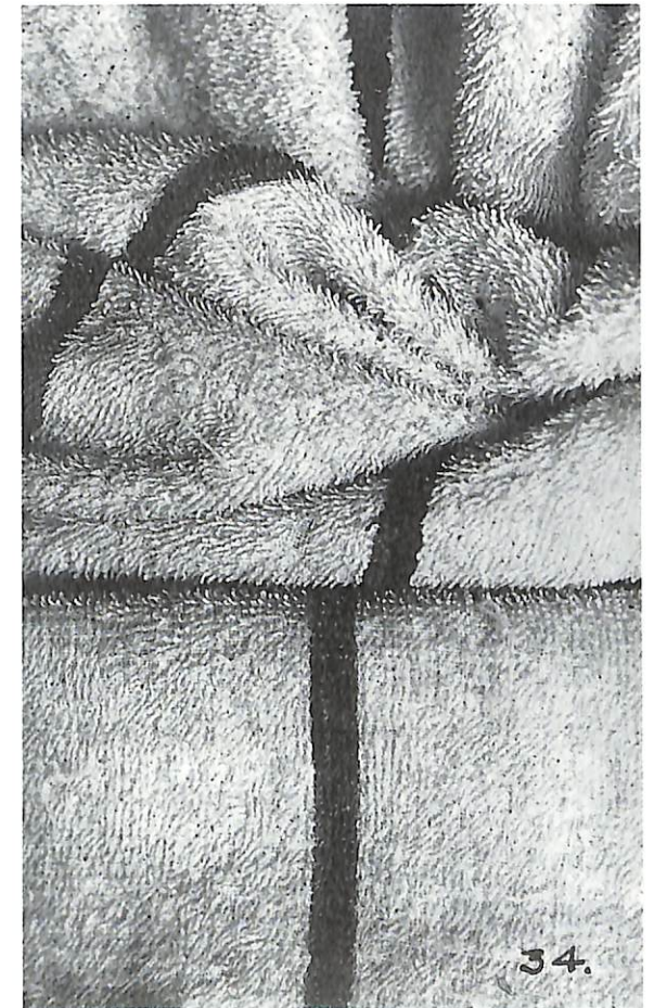
Sense títol, 1934

A Madrid també faria projectes d'exposicions i activitats avantguardistes destinades a realitzar-se al País Basc. Lo més important fou l' Exposició de Pintura, Escultura, Fotografia , celebrada a Sant Sebastià el 1934. Ací va presentar el ca-