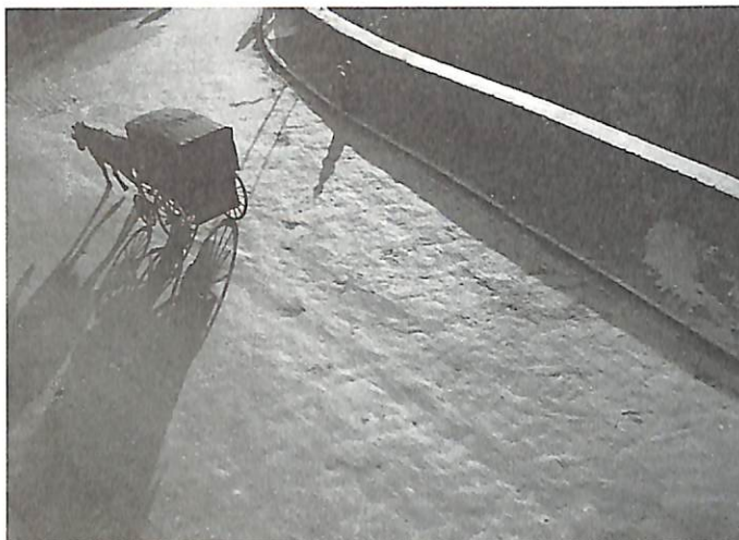
El carrer de ningú. Paisatge de soledat, 1932

nics. Però sobretot aquest plantejament optimista sobre la modernitat, evident en els fragments fotogràfics seleccionats, hi ha la bellesa de les seues imatges evocadores d'uns mons fascinadors, absurds i incongruents.