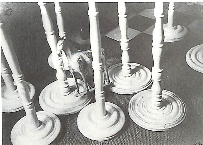
Sense títol, 1934

ràcter multidireccional de la seua obra, amb olis, dibuixos, fotografies i un fotomuntatge. Amb ell exposaven Jorge Oteiza, que seria el seu gran amic, i Narkis Balenciaga.