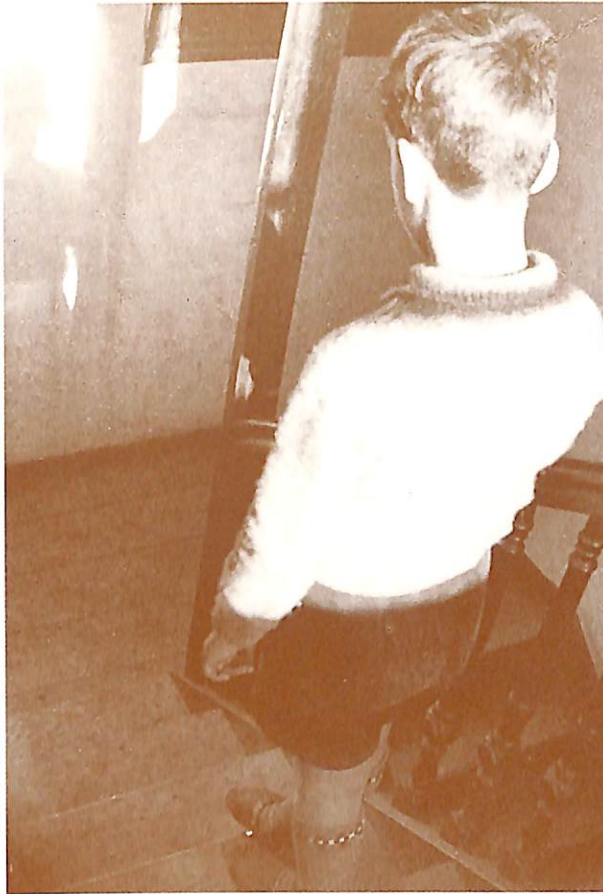
Sense títol, 1933