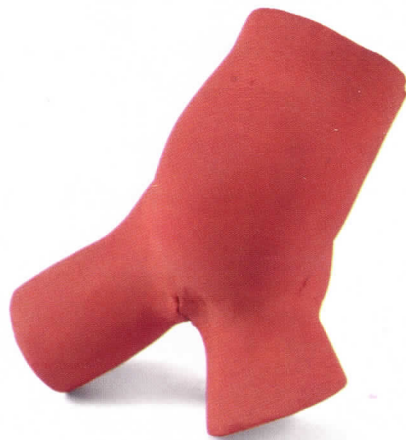
Prenyada (Embarazada), 1993 Terracota, 12 x 12,5 x 12 cm

la Galería 1 para exponer permanentemente una amplia selección de estos fondos artísticos fechada entre 1964 y 2004. En este espacio artístico se pueden encontrar sus tempranos dibujos y pinturas, esculturas de pequeño y gran formato y cuatro de sus instalaciones en las que el artista interpreta el tema de la ciudad.