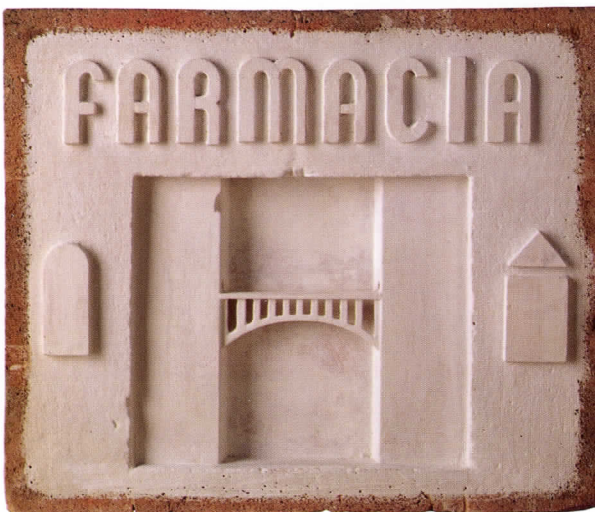
Farmacia (relieve), 1977 Refractario / Yeso, 43 x 39 x 6 cm

La colección permanente del IVAM, debido a la donación que realizó Miquel Navarro en el año