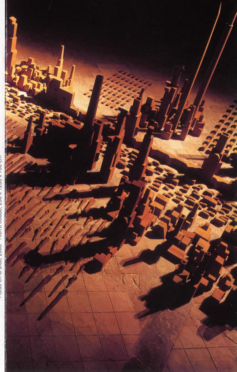
Fluido en la urbe, 2003 Hierro colado, 250 x 1200 x 700 cm