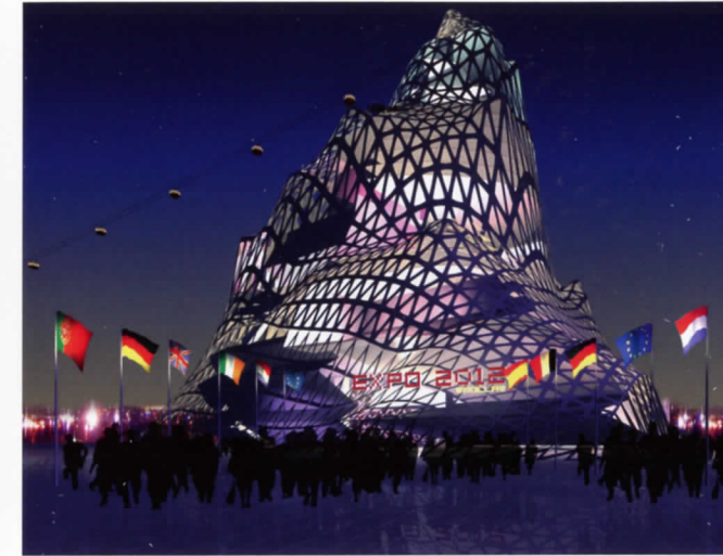
Wroclaw Expo 2012

a través de escalas, conectando cualquier construcción en cemento o acero con la estructura tectónica de una montaña, las geometrías microscópicas de un mineral, o las estructuras arbóreas. Su campo de investigación no es solamente la biología y la geología. Encuentra patrones similares en los rituales o hábitos de nuestra vida cotidiana y en los movimientos de la gente a través de paisajes urbanos y los intersecta con sus investigaciones sobre los materiales para construir todo un repertorio de formas que responde a la más fundamental manera de guía social, económica y geográfica física de la ciudad moderna. El resultado es lo que él llama la “re-naturalización del territorio”, dentro de la cual los edificios