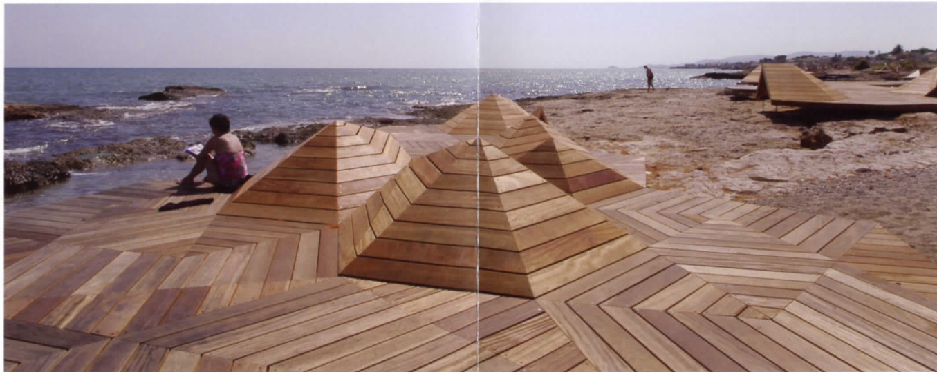
Microcostas Vinaròs.

a través de escalas, conectando cualquier construcción en cemento o acero con la estructura tectónica de una montaña, las geometrías microscópicas de un mineral, o las estructuras arbóreas. Su campo de investigación no es solamente la biología y la geología. Encuentra patrones similares en los rituales o hábitos de nuestra vida cotidiana y en los movimientos de la gente a través de paisajes urbanos y los intersecta con sus investigaciones sobre los materiales para construir todo un repertorio de formas que responde a la más fundamental manera de guía social, económica y geográfica física de la ciudad moderna. El resultado es lo que él llama la “re-naturalización del territorio”, dentro de la cual los edificios