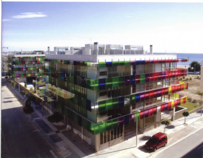
34 Apartamentos en Cambrils.

esta arquitectura profundamente moderna no es ni más ni menos que una revelación y puesta en evidencia de la antiguas estructuras en las que vivimos.