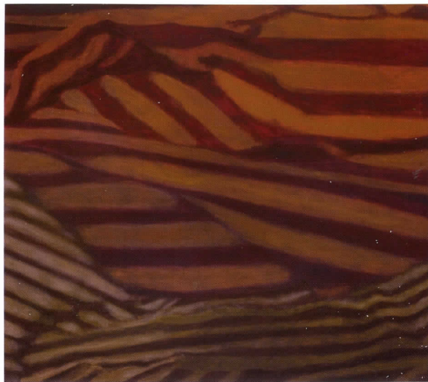
Folding Cold (Pliegue frío), 2010 Óleo sobre lienzo, 106,7 x 121,9 cm

Liliane Tomasko reúne grupos de bolsas de papel en bodegones y luego las fotografía con una cámara Polaroid. Sigue el mismo proceso con las pilas que, en realidad, son esculturas maleables que retrata en un extremo primer plano para empujar al espacio físico tridimensional hasta los márgenes y rincones del plano de la imagen.