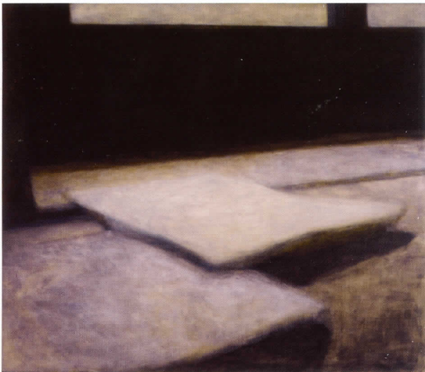
3-1-2 Lex (right) (Lex 3-1-2 [derecha]), 2009 Óleo sobre lienzo, 106,7 x 121,9 cm

A pesar de las diferencias existentes entre estos tres temas, el hilo conductor de todos ellos es su origen fotográfico.