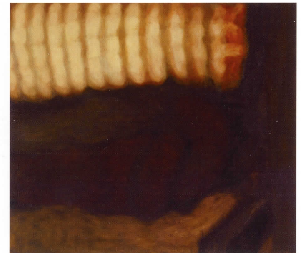
Gold on Brown (Dorado sobre marrón), 2008 Óleo sobre lienzo, 106,7 x 121,9 cm

El proceso de abstracción y mistificación permite a esta pintora emplear un estilo pictórico tenue que proporciona misterio y luminosidad, características originalmente ajenas al objeto representado. Así que las pinturas, a través de sus superficies revestidas de emociones, llevan al objeto de la fotografía barata a la pintura romántica de sus orígenes, desplegando una nueva belleza y una valiosa originalidad.