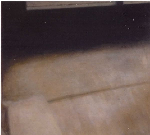
Shadow Line Lex (Lex de línea sombreada), 2010 Óleo sobre lienzo, 106,7 x 121,9 cm

Polaroid y, por lo tanto, son maleables y de alguna forma indistintas, a menudo de vivos colores, o colores que tienden a ser demasiado oscuros o demasiado brillantes con respecto al objeto original.