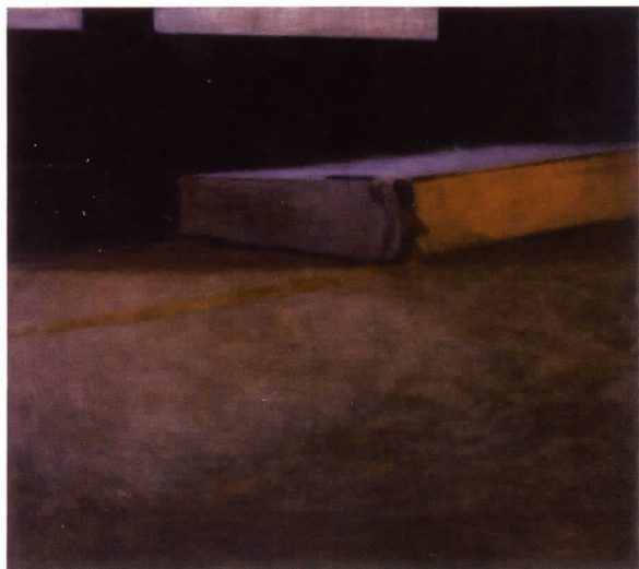
3-1-2 Lex (center) (Lex 3-1-2 [centro]), 2009 Óleo sobre lienzo, 106,7 x 121,9 cm

Se trata de un viaje por el poder transformador del medio, y por el poder de la pintura como medio manual en la actualidad.