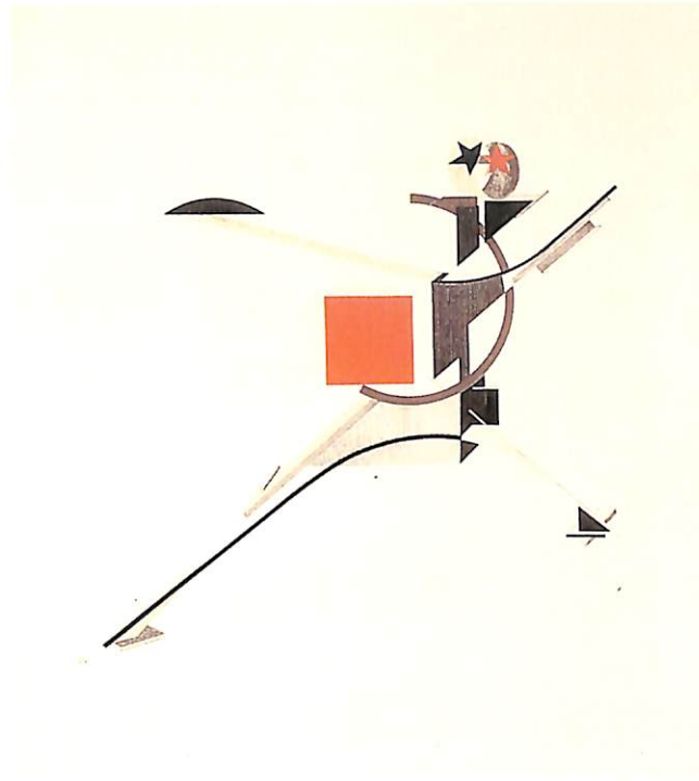
El Lissitzky. Litografia pertanyent a la sèrie "Figures", 1923

Portada: Liubov Popova. Sense títol. Linogravat en color.