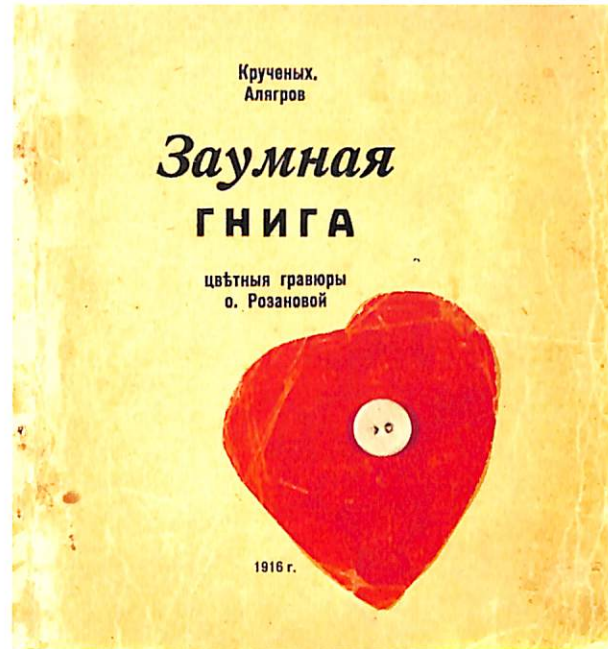
Olga Rozanova. Portada del llibre "Ribre Transracional", 1916