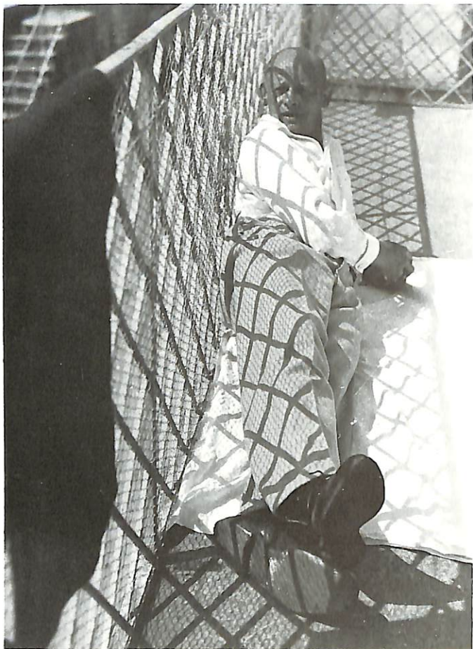
Oskar Schlemmer a Ascona, 1927