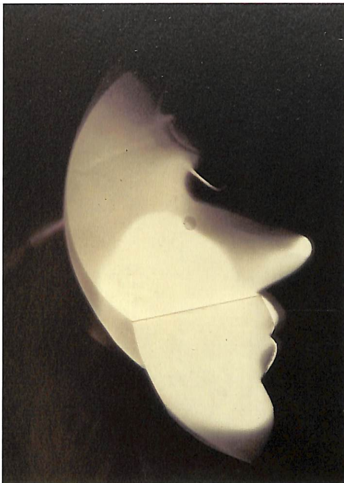
Sense títol (autoretrat), 1926