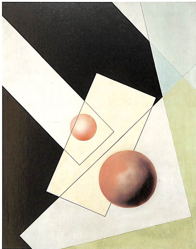
Composició A m 4, 1926

Lucia Schultz, amb qui contrau matrimoni el 1921, li descobreix la fotografia com a un mitjà d'expressió; paral·lelament a la pintura, Moholy-Nagy comença a realitzar foto-collages, fotogrames i experiències amb uns materials transparents. La seua gran preocupació estètica en aquest període rau a resoldre la presència de la llum en l'obra d'art. En aquesta línia d'experimentació exposa, el 1922, les seues primeres escultures construïdes en vidre, zinc, fusta i metalls cromats les superfícies polides dels quals li permeten integrar diferents efectes lluminosos.