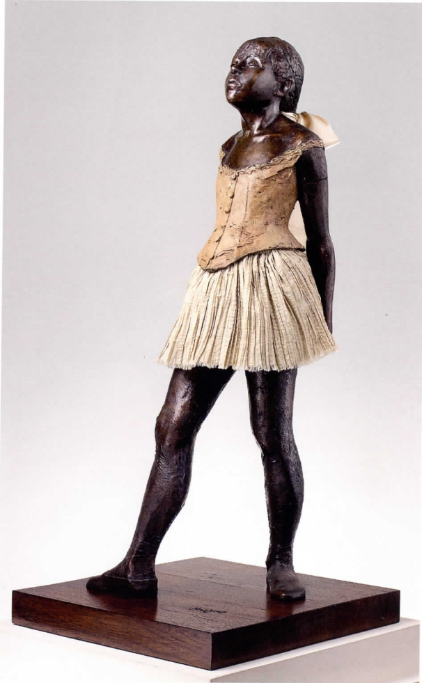
La pequeña bailarina de catorce años Altura: 99,1 cm. Bronce número 73

Esta exposición presenta la obra escultórica completa del maestro del impresionismo francés Edgar Degas (1834-1917). Si bien es cierto que los aficionados al arte conocen las pinturas y dibujos del artista, es muy probable que muchos de ellos nunca hayan tenido la