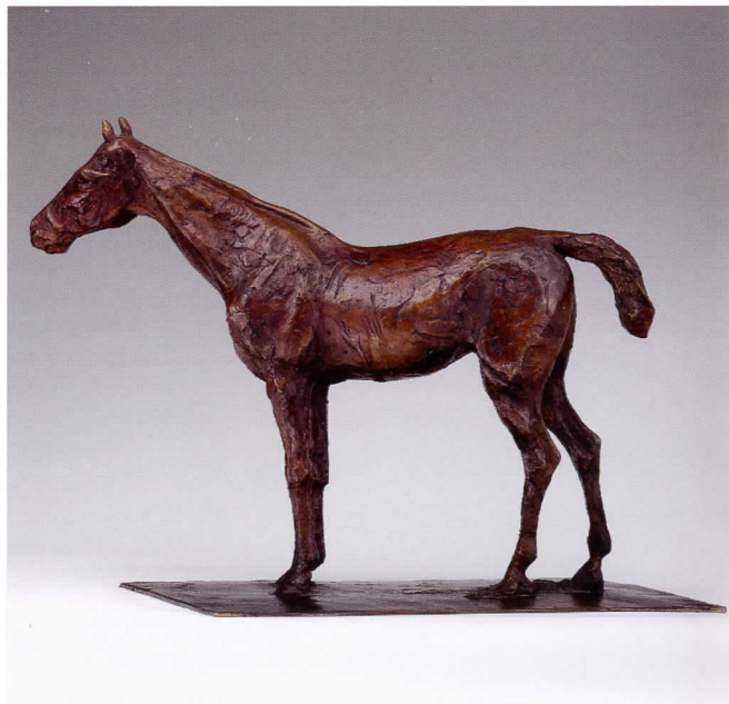
Caballo parado Altura: 29,5 cm. Bronce número 38

Esta muestra es una celebración del genio creativo del artista y presenta, por primera vez en España, la obra escultórica al completo de Edgar Degas.