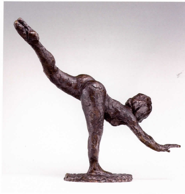
Grand arabesco, tercer tiempo Altura: 46,8 cm. Bronce número 60

posibilidad de admirar las magníficas esculturas de bronce que ahora se exponen. Éstas abarcan los temas icónicos del artista: las bailarinas en movimiento, las bailarinas descansando, las figuras sentadas, los retratos, los caballos al galope y en reposo.