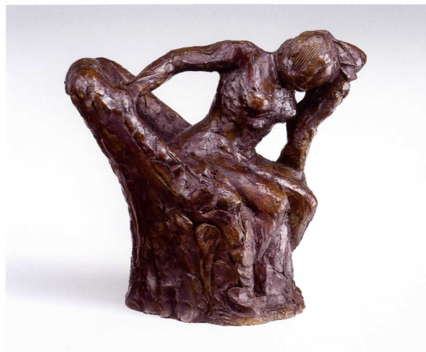
Mujer sentada en un sillón, lavándose la nuca Altura: 32 cm. Bronce número 44