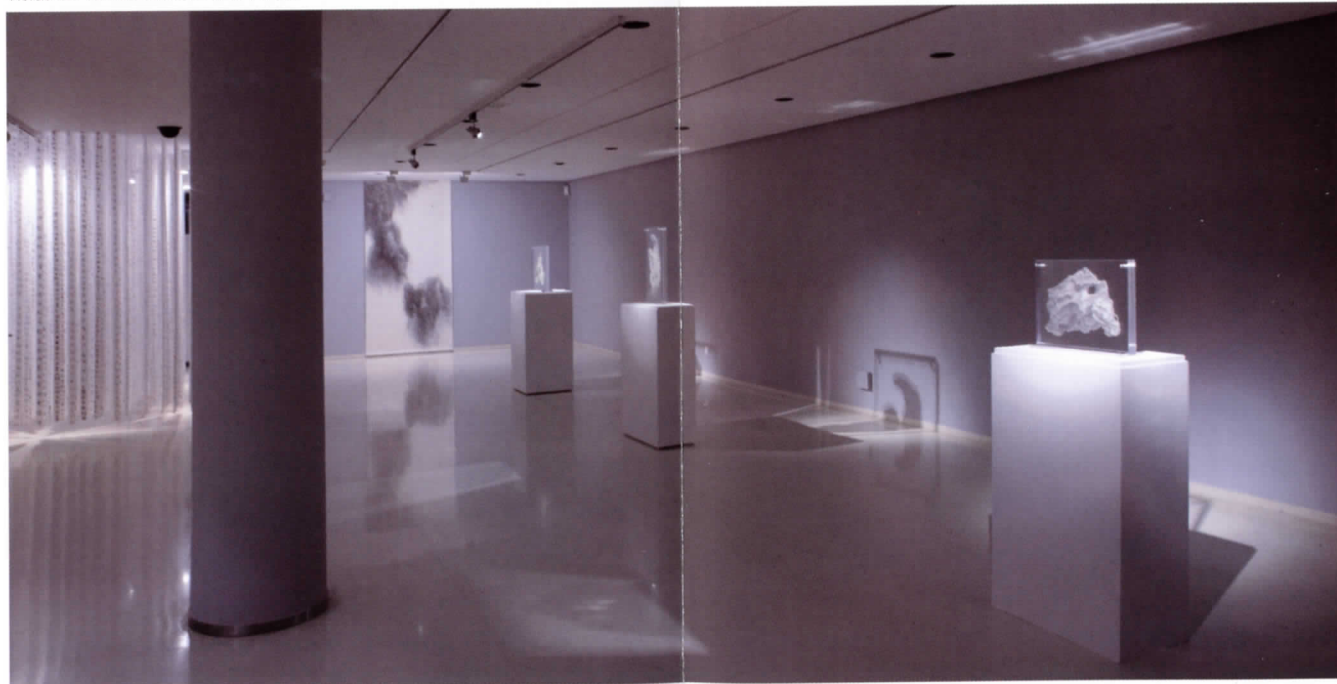
Vistas de la instalación en el IVAM

arte y se dedica con intensidad a la caligrafía. Su objetivo es la reflexión. Para Xiao Song, China no debería convertirse en otra Europa occidental, debe convertirse en una nueva China, recobrar su carácter propio. Por esta razón en el año 2002 decide trabajar y producir la tradicional pintura de montaña y agua "Shan Shui". Su objetivo es transformarla y convertirla en un nuevo símbolo para China, pero desde la utilización de los medios ancestrales y tradicionales. Dentro de ese contexto se encuentra su trabajo actual, de hecho hay dos pinturas "Shan Shui" en la muestra.