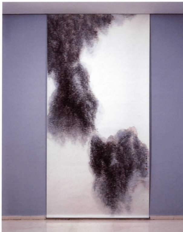
Shan Shui n.º 2 Tinta y agua sobre papel de arroz, 241 x 125 cm

En el arte Cai Xiao Song encontramos un punto de encuentro entre las culturas de oriente y occidente. Ambas aparecen definidas por lo que son, sin interferencias, conservando sus propias señas de identidad. Xiao Song a través de la reinterpretación, convierte los tesoros de la técnica del arte tradicional en símbolos de una nueva visión de la cultura china.